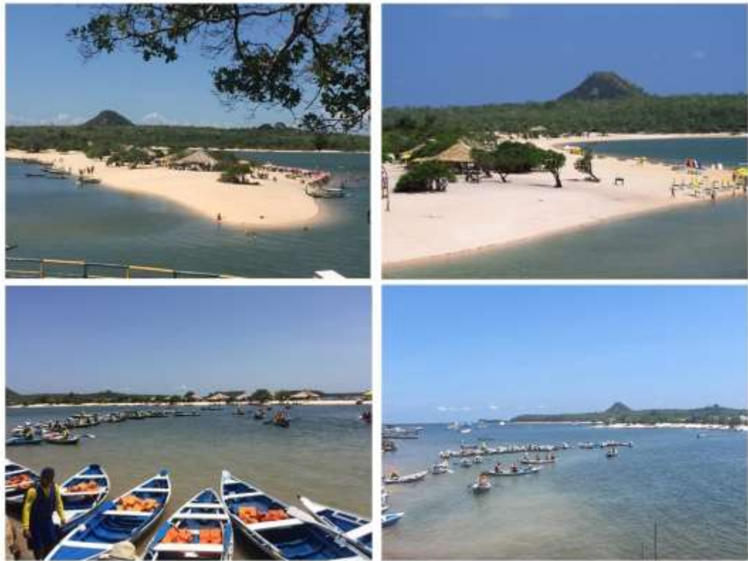
Figura 2: Praia de Alter do Chão. Fonte: Autores, 2019.

Os períodos de estação chuvosa (primeiro semestre) estação seca (segundo semestre) na Amazônia (ROCHA et al, 2017), influenciam a dinâmica do curso natural de rios e córregos. Nesse contexto, as florestas alagáveis, presentes nas áreas mais baixas da bacia amazônica, anualmente perdem e ganham muita água e oxigênio, adaptando-as a viverem parte do ano com suas raízes e troncos submersas, tornando-as assim, muito resistentes. Os lagos abertos, conectados aos rios, quando estão em níveis mais elevados, adentram na Floresta Encantada (FIGURA 3), e atraem turistas e pesquisadores para um passeio inesquecível.