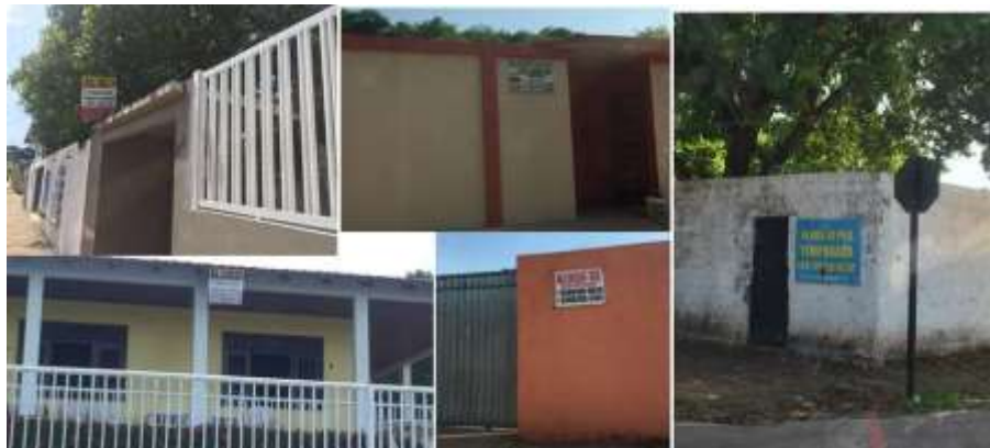
Figura 4: Imóveis para alugar em Alter do Chão.

Alter do Chão o intenso movimento de compra de terrenos e imóveis foi observado pela dinâmica de uso e ocupação do espaço, a qual é desencadeada também pelas casas de veraneio, as quais permanecem fechadas no período de baixa estação. Nesse cenário, é comum encontrar residências próximas às praias, com placas de aluguéis por temporada (FIGURA 4).