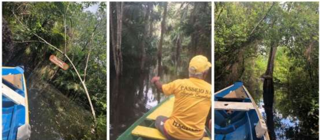
Figura 03: Floresta Encantada.

Os períodos de estação chuvosa (primeiro semestre) estação seca (segundo semestre) na Amazônia (ROCHA et al, 2017), influenciam a dinâmica do curso natural de rios e córregos. Nesse contexto, as florestas alagáveis, presentes nas áreas mais baixas da bacia amazônica, anualmente perdem e ganham muita água e oxigênio, adaptando-as a viverem parte do ano com suas raízes e troncos submersas, tornando-as assim, muito resistentes. Os lagos abertos, conectados aos rios, quando estão em níveis mais elevados, adentram na Floresta Encantada (FIGURA 3), e atraem turistas e pesquisadores para um passeio inesquecível.