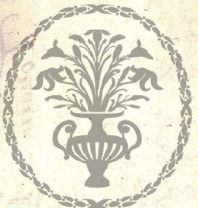
ARCHIVO CATEDRAL DE MURCIA