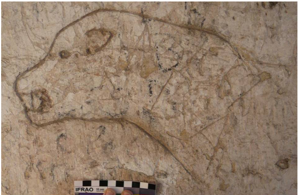
Figura 6. Detalle graffiti N° 5