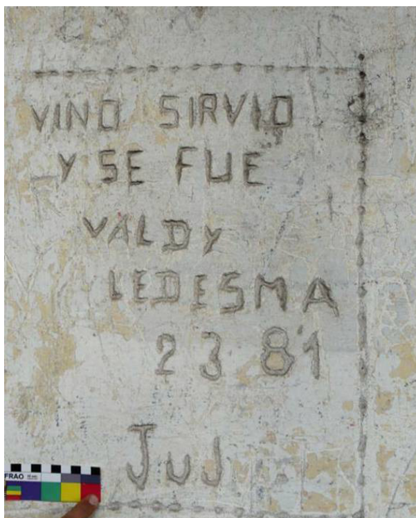
Figura 4. Detalle graffiti N°26 "vino sirvió y se fue Valdy Ledesma 23 81 Juj"

Dentro de los nombres y apodos se encontraron una serie de graffitis que contenían la fecha en que se realizaron (Figura 4); otros manifestaban la clase del conscripto que los efectuó, lo cual otorga una cronología relativa del tiempo en que fueron realizados debido a que los conscriptos ingresaban a la edad de 17 años. Es a partir de estas fechas que establecimos una cronología que nos provee un rango mínimo de tiempo en que los militares estuvieron instalados en este espacio: desde marzo de 1978 hasta marzo de 1981.