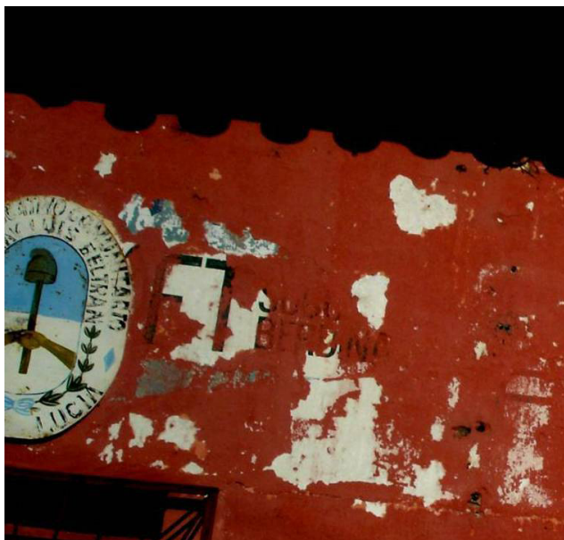
Figura 3. Detalle pintura en TUC-SL3

Una mención sobre la existencia de dicha inscripción, así como de otras pintadas en el frente de las otras instalaciones utilizadas por los militares, la encontramos en el Informe de Comisión Bicameral, en una visita realizada al CCD con el testigo Enrique Godoy. En la época en que se efectuó esta visita, el año 1985, estas instalaciones aún no se encontraban en uso y no habían sufrido ninguna modificación, por lo cual las marcas en el frente se encontraban visibles y a la vista del testimoniante: