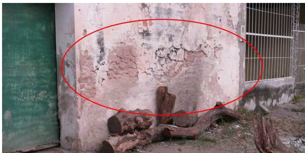
Figura 2. En esta figura se señala la erosión particular localizada en el Frente exterior de la estructura TUC-SL2.

En este sitio en particular es llamativa la ubicación de algunas de estas marcas, sumado al hecho que las fuentes testimoniales mencionan que se escuchaban ruidos de ametralladoras provenientes de “La Base”, por lo cual sugerimos a modo de hipótesis que éstas son producto del impacto de proyectiles. Sin embargo, consideramos que para poder realizar esta determinación es necesario abordar otras