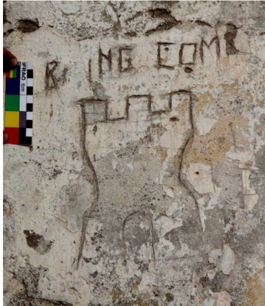
Figura 5. Detalle graffiti N° 11 "B ing com"