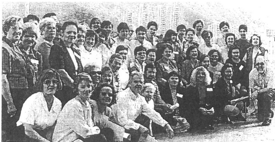
Encuentro de grupos de adultos del arciprestazgo de San José 1997

La situación de los distintos arciprestazgos es desigual, ya que por una parte hay varios arciprestazgos que tienen una realidad bastante alentadora, mientras que en otros no terminan de arrancar y casi siempre la causa es la misma, la falta de motivación de los párrocos.