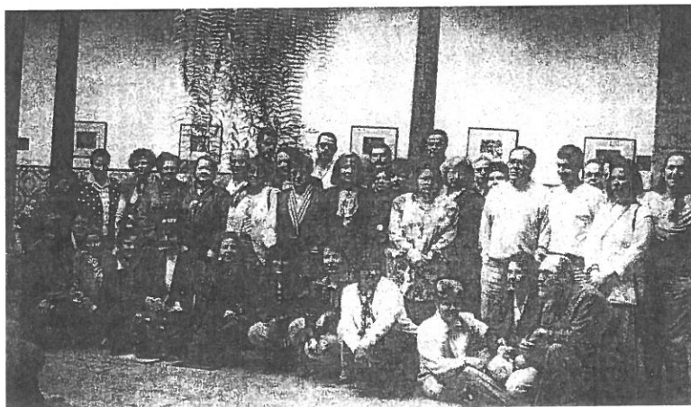
Escuela de Catequistas de adultos de Las Palmas de G.C. 16 de abril de 1994

Estos encuentros eran de tipo celebrativo o formativo según los casos y la participación rondaba las cincuenta personas.