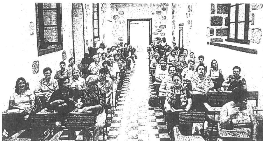
Reunión de responsables parroquiales de catequesis (8-11-2002)

El trabajo se inició con una amplia encuesta para tomar el pulso a la realidad, buscando la implicación de todos los agentes de pastoral y de manera especial los catequistas.