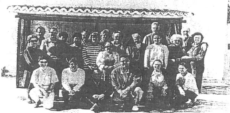
Reunión de catequistas de Fuerteventura. Enero de 1997

Los responsables parroquiales de catequesis nos reuníamos dos o tres veces en el año. Al iniciar el curso y aprovechando los cursillos de septiembre