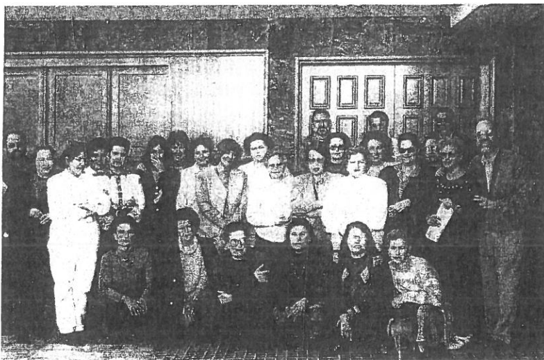
Escuela de catequistas de adultos en Lanzarote 21 de enero de 1995

Todo el esfuerzo que se realizó en el Sínodo, no impidió continuar la actividad de mantenimiento, fundamentalmente de las Escuelas de Catequistas de Adultos y el fortalecimiento del Departamento de Catequesis especiales y continuar con la elaboración de las dos carpetas restantes. La tercera fue asumida fundamentalmente por el equipo de la Diócesis de Tenerife.