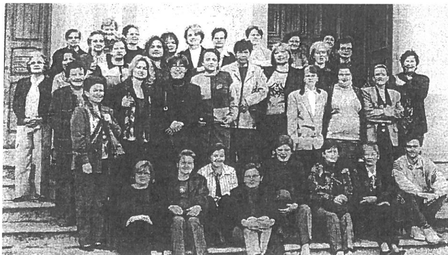
Participantes en el retiro previo para los que han terminado su proceso de catequesis de adultos. Celebración realizada en el Lomo Apolinario el 6 de abril del 2002