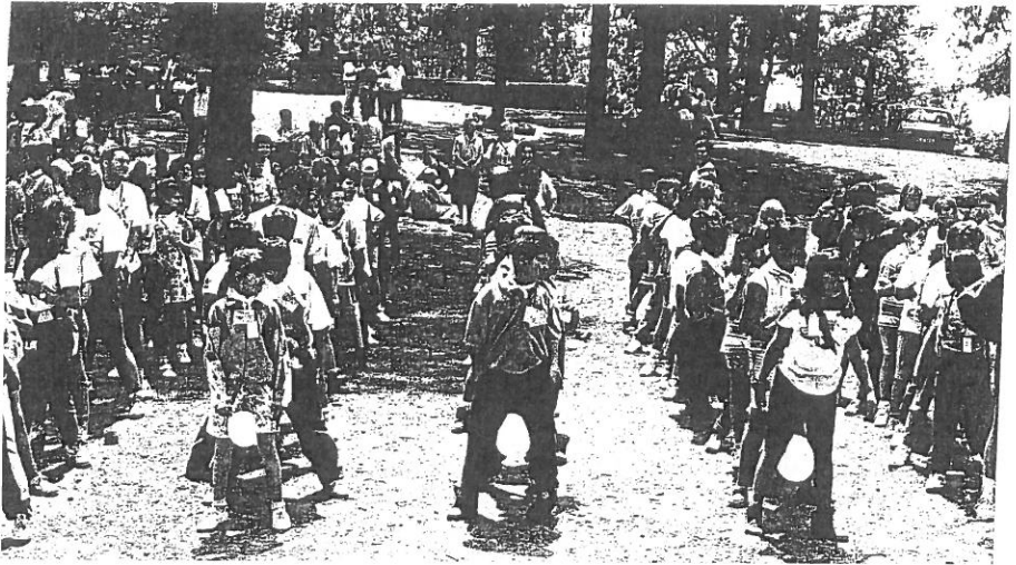
Encuentro de niños y niñas de Síntesis de Fe en Tamadaba 1994