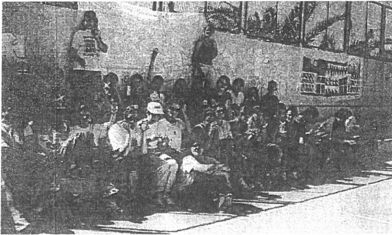
Encuentro diocesano de preadolescentes 1999