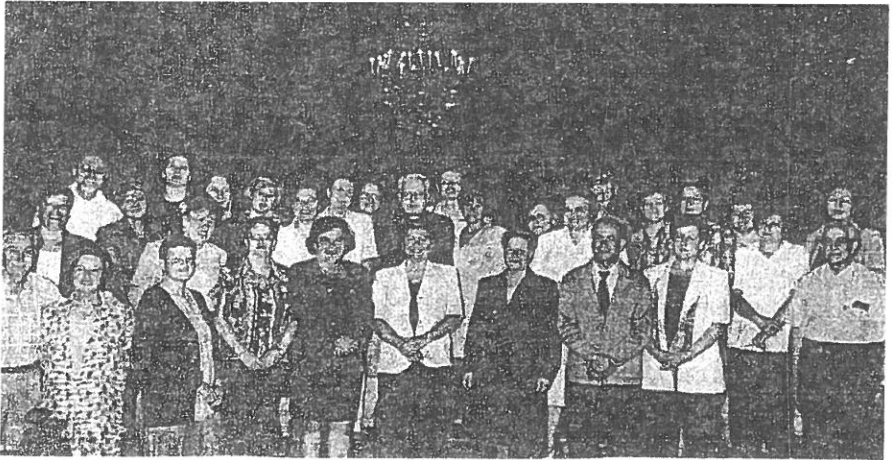
Celebración del Ministerio del Catequista en la Catedral el 22 de mayo de 1999.

"Reciben Vds. este ministerio y este envío en un año Jubilar y en la preparación de las misiones populares en Lanzarote. De ahí que en esta Eucaristía, le pida al Padre, en nombre de Jesús y por la intercesión de la Virgen María, que el rocío de gracia y santidad que la Iglesia, por el Señor Jesús, quiere otorgarnos en este año santo, sea especialmente significativo para todos Vds. El Hijo de Dios, hace dos mil años que, fiel al envío del Padre, le dijo: «Aquí estoy, Señor, para hacer tu voluntad». Este "sí" de Cristo, unido al "sí" libre y generoso de María, produjo la Encarnación del Verbo, inicio de la fe cristiana, inicio de nuestra salvación. Veinte siglos después, Vds. son "ikono", es decir, imagen de ese envío salvador, siendo también enviados a evangelizar, a catequizar, como testigos cualificados de Cristo Jesús".