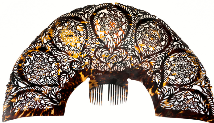
Figura 26. Peinetón

Número de inventario: 4895.