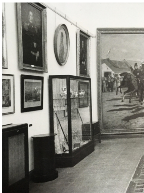
Figura 16. Fotografía de la Sala Las Heras - Lavalle, julio de 1967