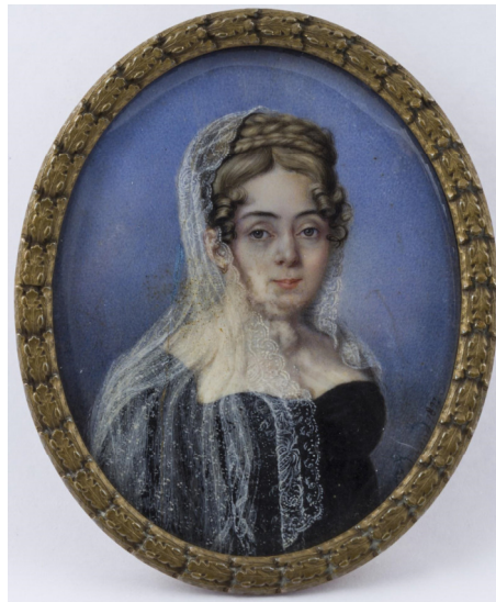
Figura 14. Durand, Carlos, Retrato de Javiera Carrera de Díaz Vélez, 1821

Fuente: Museo Histórico Nacional, Buenos Aires. Número de inventario: 4637.