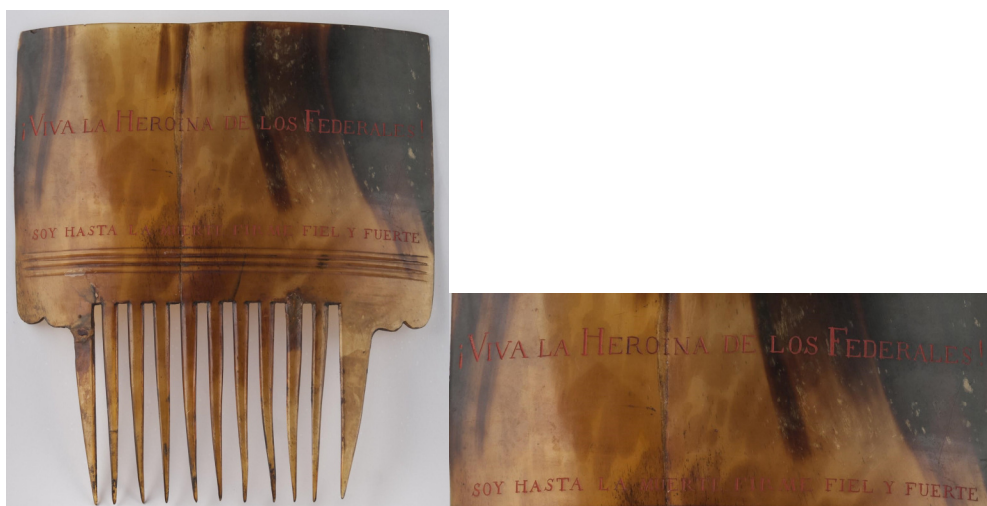
Figuras 27 y 28. Peineta “¡Viva la heroína de los federales!”.

Número de inventario: 2349.