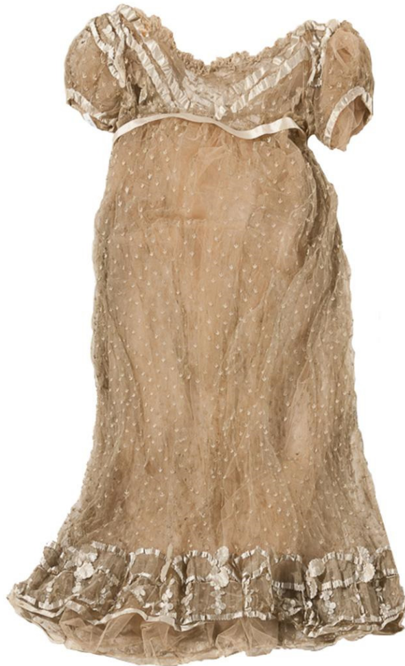
Figura 2. Vestido imperio de Bernardina Chavarría de Viamonte

Número de inventario: 4615.