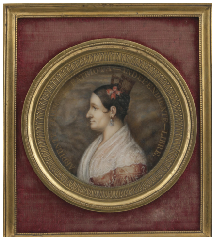
Figura 25. García del Molino, Fernando. Retrato de Encarnación Ezcurra de Rosas, 1839

Fuente: Museo Histórico Nacional, Buenos Aires. Número de inventario: 2460.