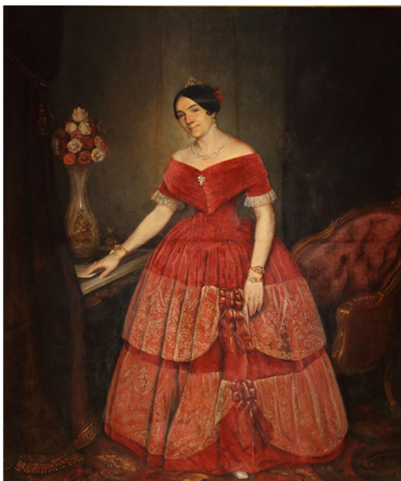
Figura 7. Pueyrredón, Prilidiano, Retrato de Manuelita Rosas, 1851

Número de inventario: 3188.