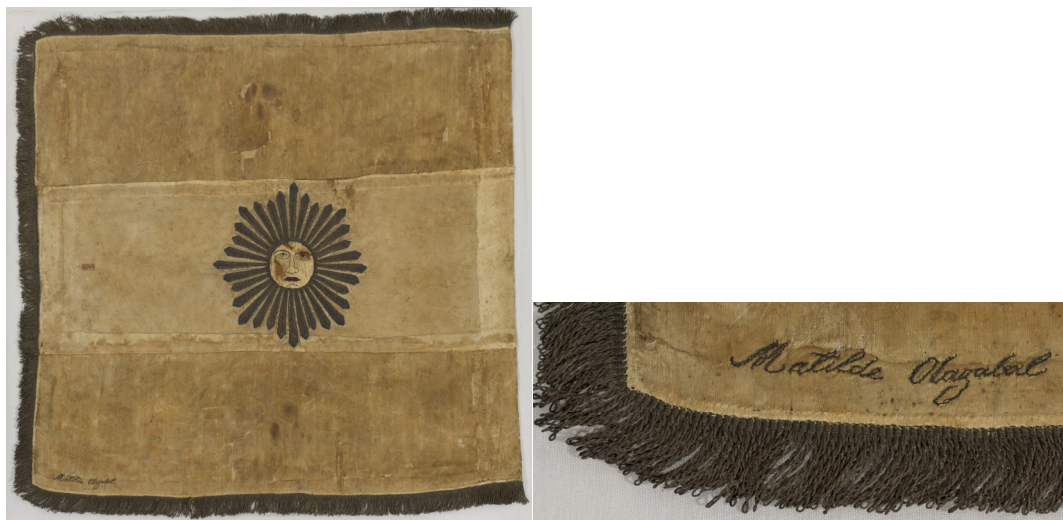
Figuras 32 y 33. Estandarte de la batalla de Caaguazú y detalle con la firma de Matilde Olazábal

Número de inventario: 2517.