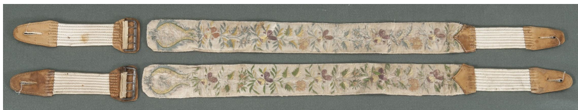
Figura 31. Tiradores de Manuel Dorrego

Fuente: Museo Histórico Nacional, Buenos Aires. Número de inventario: 2494.