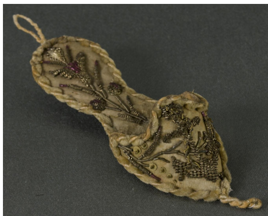
Figura 30. Relojera de José de San Martín

Número de inventario: 1232.