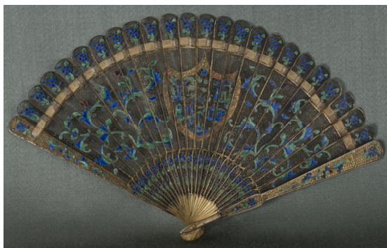
Figura 24. Abanico de filigrana

Fuente: Museo Histórico Nacional, Buenos Aires. Número de inventario: 4617.