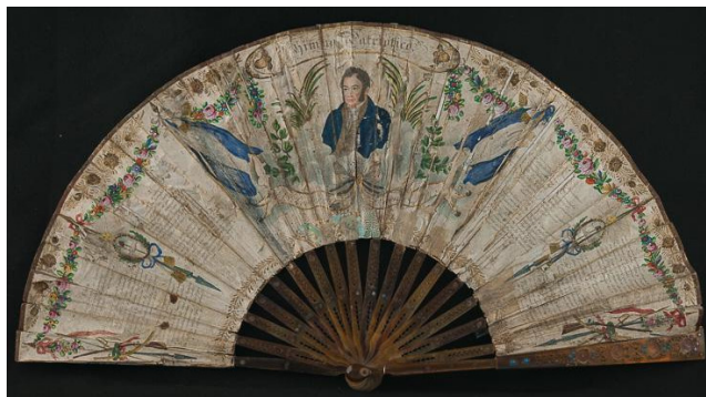
Figura 23. Abanico del Himno Patriótico

Número de inventario: 3042.