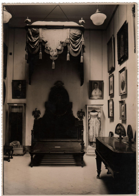
Figura 5. Sala Damas Patricias 1935