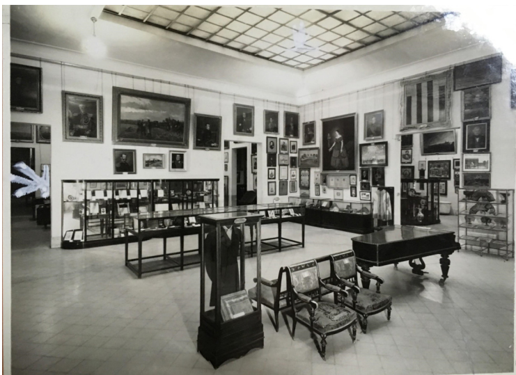
Figura 10. Sala Rosas, 1939. Vista general