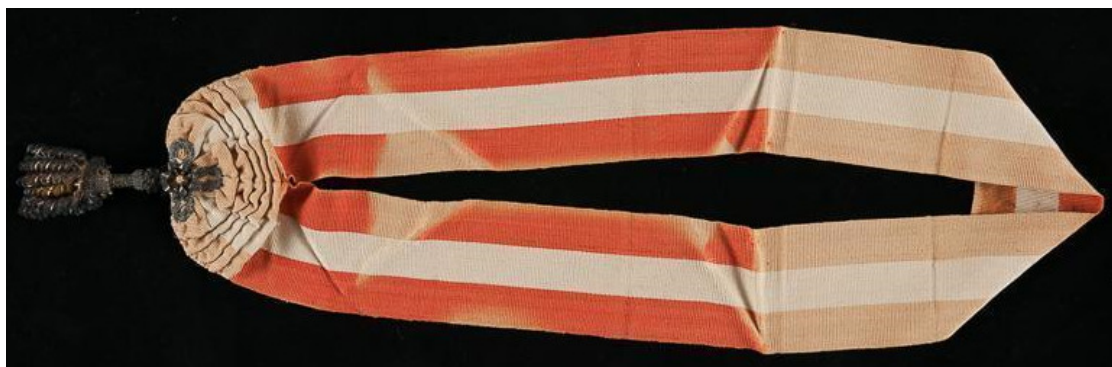
Figura 29. “Divisa del Patriotismo” del Perú, banda

Fuente: Museo Histórico Nacional, Buenos Aires. Número de inventario: 4690.