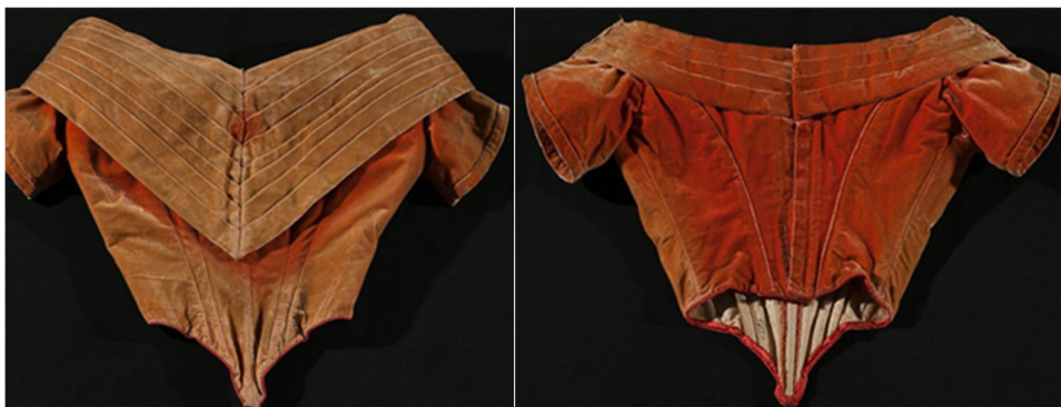
Figuras 8 y 9. Corselete de Manuelita Rosas, anverso y reverso

Fuente: Museo Histórico Nacional, Buenos Aires. Número de inventario: 2395.