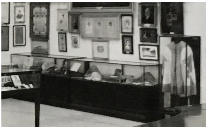
Figura 11. Sala Rosas, 1939, detalle