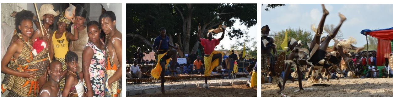
Fig. 3, Fig. 4 e Fig. 5 – Diversidade da cultura na dança.

No seu Projecto Político Pedagógico de 2015-2019, a ESC tem inscrita a preocupação de dar destaque à diversidade cultural e de, numa perspetiva histórica, recuperar a(s) cultura(s) tradicional(is) quer numa perspetiva nacional, quer na perspetiva que caracteriza a ESC; as fotos abaixo (Fig. 3, Fig. 4 e Fig. 5) revelam a preocupação da instituição em desenvolver e preservar as atividades representativas da diversidade da cultura local.