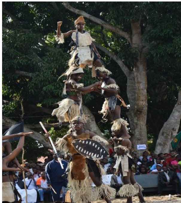
Fig. 6 – Foto tirada ao longo da atuação do Xigubo de Cambine no Festival regional de Xigubo.

No que tange ao II Festival, comparativamente ao I, de acordo a informação colhida no discurso de encerramento proferido pelo Diretor provincial de Cultura, Sr. Fredson Bacar, em representação do Excelentíssimo Senhor Governador da Província de Inhambane, Daniel Francisco Chapo, não temos muito a dizer, somente dar conta que, de acordo com o Diretor Provincial de Cultura, a organização é de destacar pelo seu valor, ultrapassando as expectativas; daí o agradecimento à escola, pelo representante do Governo do Provincial, incentivando as outras províncias a aproveitarem o festival não só na troca de experiência entre os(as) dançarinos(as), mas também na organização dos eventos. O objetivo é promover a candidatura de Xigubos à Obra-Prima do Património Oral e Imaterial da Humanidade (o objetivo sendo o lema do festival e constava dos dísticos), a nível das quatro províncias (Maputo Província, Cidade de Maputo, Gaza e Inhambane), sendo que cada delegação é representada por dois grupos. Para além do grupo Xigubo, são convidados outros dois grupos: Zore dança tradicional de Morrumbene e Timbila dança de Zavala, conforme o Programa do evento disponibilizado no local.