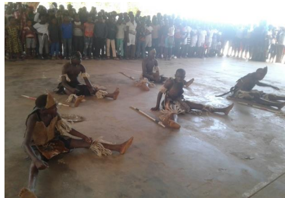
Fig. 7 e 8 – Fotos tiradas ao longo da acuação do Xigubo em Cambine no encerramento do ano letivo 2019.