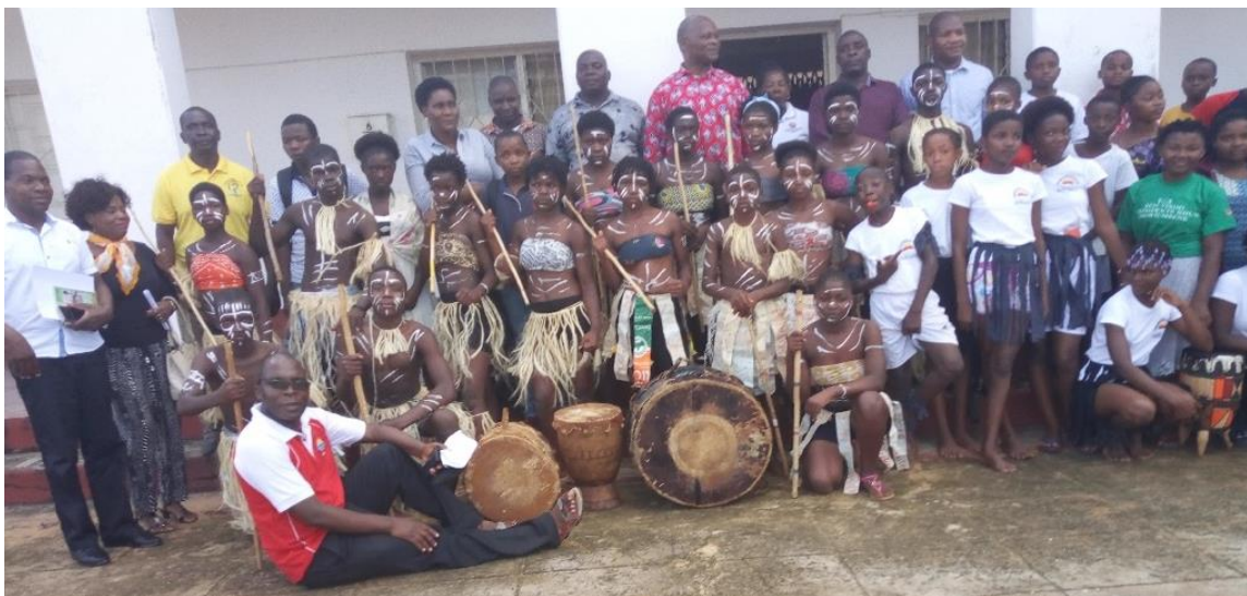
Fig. 9 – Foto de família, com o Excelentíssimo Senhor Administrador, depois de ocuparmos o primeiro lugar no Festival Distrital de Xigubo.