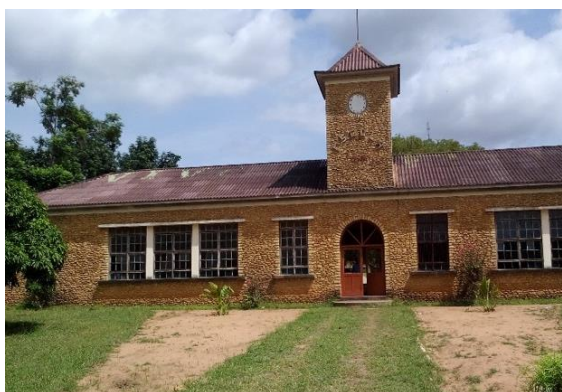
Fig. 2 - Vista frontal da Escola Secundária de Cambine.