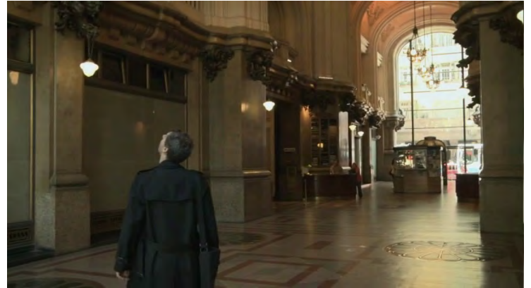
Figura 3. Fotograma de la película El rascacielos latino (2012), de Sebastián Schindel

La obsesión detallada por el protagonista tiene que ver con una mera instancia narrativa y el aspecto lúdico que el documental plantea con su intertexto genérico. A diferencia de esto, El rascacielos latino no intenta justi-