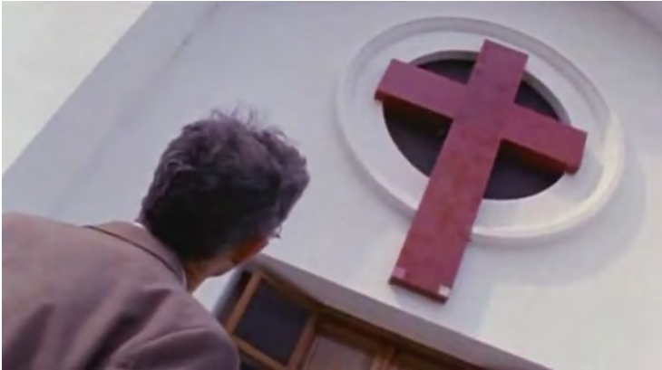
Figura 2. Fotograma de Yo no sé qué me han hecho tus ojos (2003), de Sergio Wolf y Lorena Muñoz

La construcción de los personajes principales es clave, ya que funcionan principalmente como un mecanismo para desarrollar el proceso investigativo. Sumado a esto, podría argumentarse que en ambos ejemplos la adopción estilística pareciera obedecer a la caracterización de la época y las temáticas seleccionadas, ya que tratan aspectos artísticos: el mundo del tango y el cine de la década del treinta, y la arquitectura de principios del siglo XX. Pero como mencionamos previamente, presentan algunas diferencias. El personaje protagónico interpretado por Wolf en Yo no sé qué me han hecho tus ojos intenta establecer una relación personal con su objeto de investigación desde la primera escena del filme, en la que el periodista Aníbal Ford lo introduce al mundo de las cantantes de tango y a la misteriosa historia de Falcón despertando su curiosidad. El relato en off de Wolf explica: