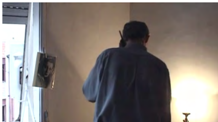
Figura 4. Fotograma de Yo no sé qué me han hecho tus ojos (2003), de Sergio Wolf y Lorena Muñoz

a la cinta y al que Yo no sé qué me han hecho tus ojos remite a partir de cierta construcción visual en las escenas en las que Wolf tiene una foto de la cantante colgada de las cortinas de su habitación a la manera del cuadro del filme de Preminger (Figura 4). 11