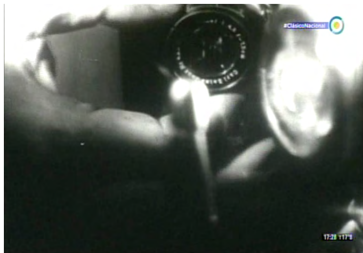
Figura 1. Fotograma de Captura recomendada (1950), de Don Napy.

El tenor de esta secuencia y las imágenes que presenta remite necesariamente a los noticieros institucionales del período, que podrían caracterizarse dentro de la modalidad expositiva de Nichols (1997), en tanto presentan una voz que subordina a las imágenes a la información transmitida en la banda sonora. 6 El estilo de estas escenas, en conjunto con las filmaciones en exteriores, constituyen los aspectos que permitieron en su momento caracterizarlos como semidocumentales,