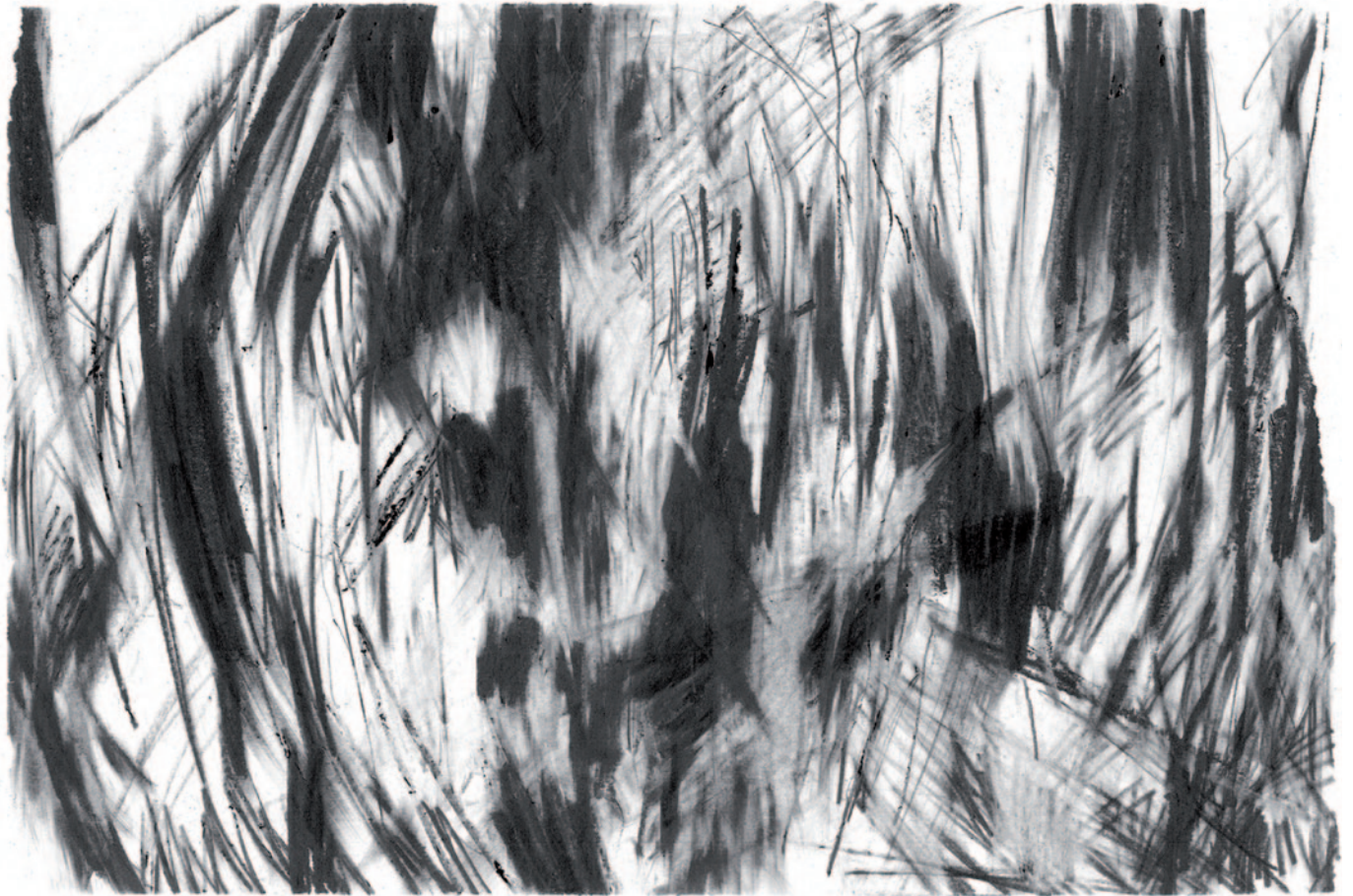
Autorretrato VI (serie), 2017. Grafito en barra, lápiz de grafito y goma sobre papel Accademia blanco de 160gr/m.