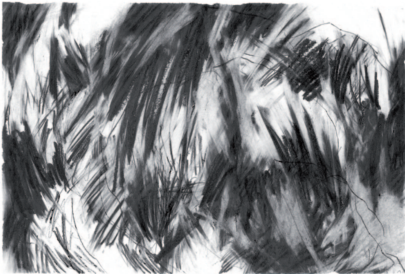
Autorretrato V (serie) , 2017. Grafito en barra, lápiz de grafito y goma sobre papel Accademia blanco de 160gr/m.