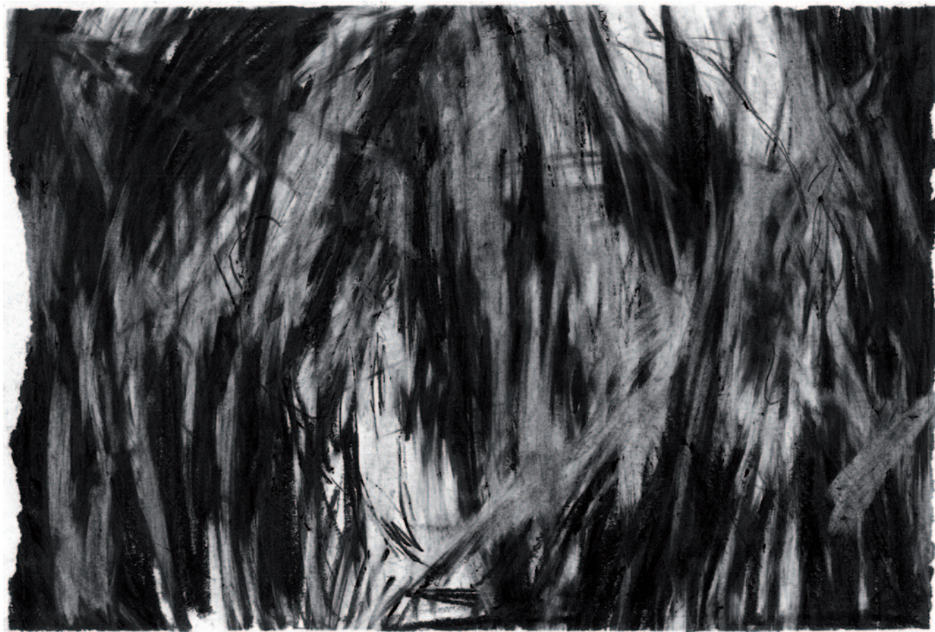
Autorretrato I (serie) , 2017. Grafito en barra, lápiz de grafito y goma sobre papel Accademia blanco de 160gr/m.