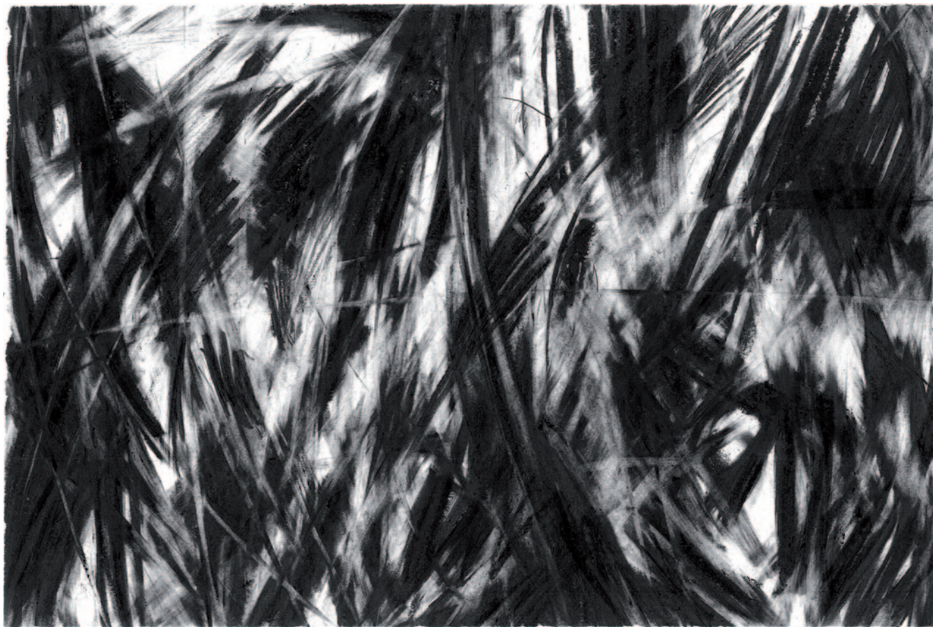
Autorretrato III (serie) , 2017. Grafito en barra, lápiz de grafito y goma sobre papel Accademia blanco de 160gr/m.