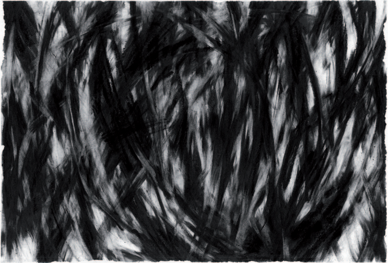
Autorretrato II (serie) , 2017. Grafito en barra, lápiz de grafito y goma sobre papel Accademia blanco de 160gr/m.