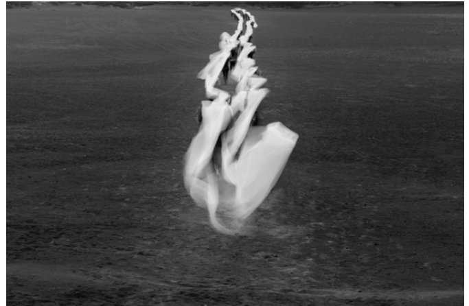
Imagen 5. Irazú (2016), Miguel Braceli. Intervención participativa. Cordillera Volcánica Central, Costa Rica.

De allí, que la abstracción geométrica venezolana sea continuamente retomada, pues en ella es factible la formulación de otros trayectos de la realidad, como los que realiza la artista venezolana Érika Ordosgoitti (Caracas, 1980- ), quien toma diversos campos abstracto-geométricos por asalto, con la intención de trastocarlos en medio de la estrategia apropiativa de la subtitulación.