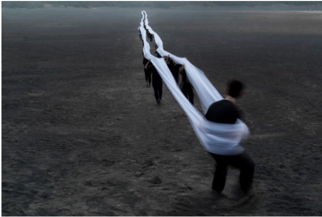
Imagen 4. Irazú (2016), Miguel Braceli. Intervención participativa. Cordillera Volcánica Central, Costa Rica. (Cortesía del artista).