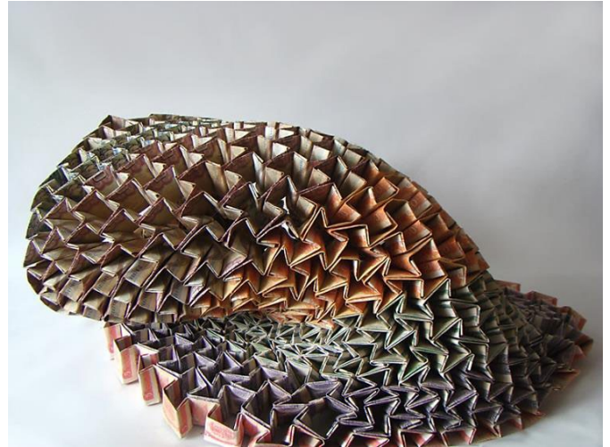
Imagen 1. Caída Libre (2014), Isabel Cisneros. Ensamblaje Billetes, monedas, pegamento, termofusible, guaya de acero y balines de plata, 150 x 63 cm. (Cortesía de la artista).

En este sentido, los tejidos, acumulaciones y ensamblajes realizados por la artista nos conducen por una abstracción geométrica que concreta la universalidad de las formas geométricas cotidianas desapercibidas y que muestran su coherencia en obras como Caída libre (2014) (Imagen 1), compuesta por la plegadura de billetes ya en desuso dentro del cono monetario venezolano, y que para sostener su frágil peso llevan por dentro monedas, igualmente en inútiles. Geometrías que ocultan, de forma discreta, en estos intencionados materiales