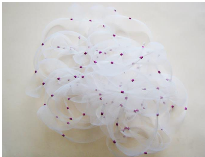
Imagen 2. Cariaquito (2014), Isabel Cisneros. Cinta de nylon y canutillos de plástico, 40 x 40 cm. (Cortesía de la artista).

Ambas obras, dan un paso más allá en el campo de la abstracción geométrica por medio de la búsqueda dirigida al desmantelamiento, la deconstrucción y la implicación comprometida con la realidad dentro de la necesidad actual de comprender la heterogeneidad de las posturas socio-culturales, de sus significaciones y afectaciones a partir de una pluralidad de registros y de formas exteriores e interiores capaces de “hacerse sitio y situación” en una nueva necesidad de significantes que requieren de otra voluntad de representación. Todo esto puede ser comprendido dentro de un impulso que las aleja del campo inicial de la abstracción geométrica, pero que al mismo