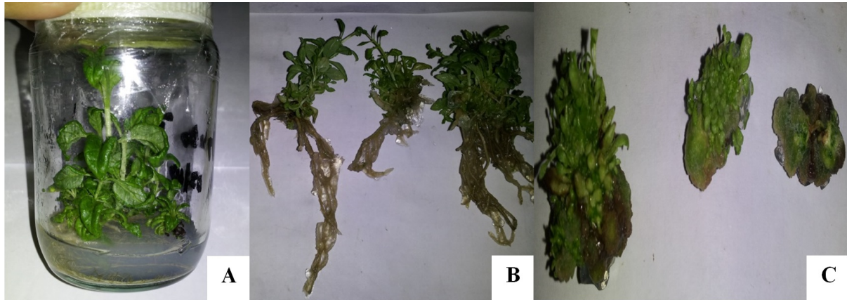
Figura 2. A) Multiplicación de vitropiantas en medio (MS) sin adición de hormonas. B) Evaluación longitud de raíces. C) Formación de callo en la base de plantas en medio (MS) con adición de BAP ( 0,1 \text{ g l}^{-1} ).

alteraciones que ocurren en el metabolismo celular.