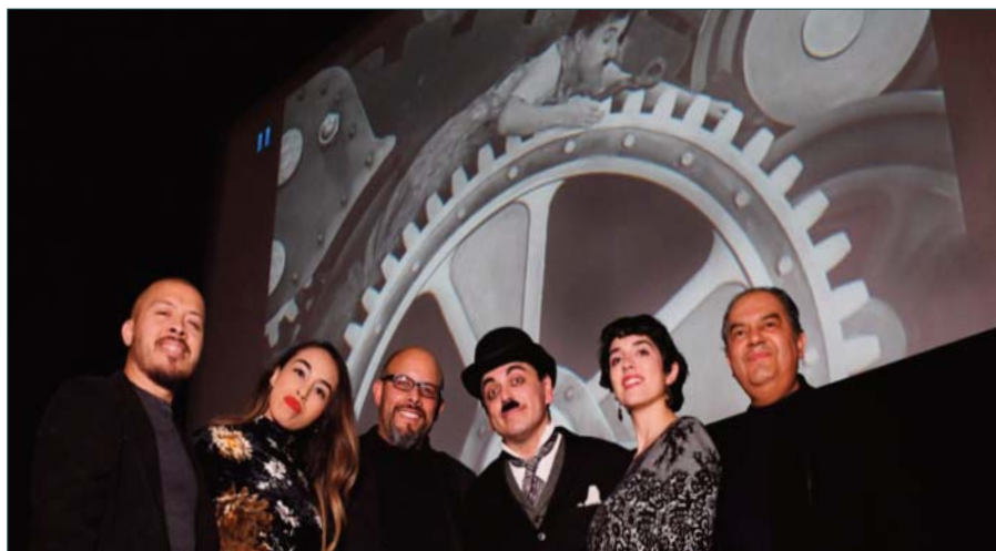
8º Aniversario. Equipo de trabajo

de las Artes que resguarda la memoria de la institución desde su fundación hace treinta y ocho años, con materiales digitalizados disponibles para la consulta externa en las diversas disciplinas, las actividades cinematográficas incluidas. En mi faceta como crítico de cine, en lo personal le he dado seguimiento al tema del cine hecho en Tijuana o que ha recreado a esta ciudad fronteriza desde principios del siglo pasado. Algunos de estos textos e investigaciones han quedado documentados en diversas publicaciones, como en el catálogo de lo audiovisual tijuanaense Obra Negra (CECUT, 2010) y el Diccionario Enciclopédico de Baja California (Instituto de Cultura de Baja California, 2013).