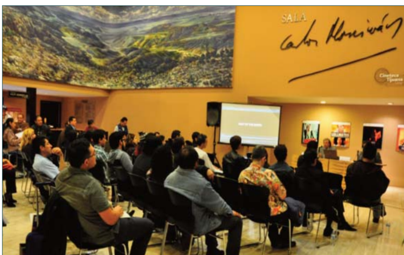
Conferencia en el Lobby de la Cineteca Tijuana