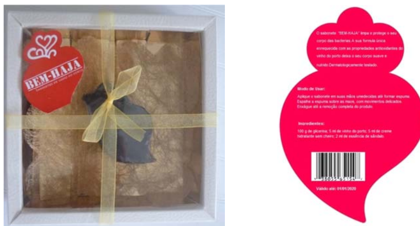
Figura 2. Embalagem comercial do sabonete Bem-Haja (esquerda) e rótulo aplicado na parte de trás da caixa (direita).

Tanto a escolha do nome como da embalagem teve como fundamento a rica cultura portuguesa. Relativamente à embalagem, optou-se por utilizar uma caixa de papel, visto ser um material reciclável. A envolver o sabonete utiliza-se uma rede porque é o mais adequado para proteger as características organoléticas do produto (propriedade das substâncias para impressionarem os sentidos). O nome do produto é Bem-Haja . Sendo uma palavra típica da língua Portuguesa, uma palavra que não tem tradução íntegra em mais nenhuma língua, é, muitas vezes, sinónimo de obrigado, mas também uma expressão bem mais portuguesa. Como imagem do produto, optou-se por colocar a imagem do coração de Viana, típico da região de Viana do Castelo, e usado no folclore como um acessório do traje de domingueira (Figura 2). O modo de uso, a sua constituição e código de barras encontram-se de forma legível no rótulo (Figura 2).