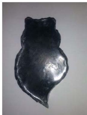
Figura 1. Sabonete Bem-Haja com a forma final.

Tanto a escolha do nome como da embalagem teve como fundamento a rica cultura portuguesa. Relativamente à embalagem, optou-se por utilizar uma caixa de papel, visto ser um material reciclável. A envolver o sabonete utiliza-se uma rede porque é o mais adequado para proteger as características organoléticas do produto (propriedade das substâncias para impressionarem os sentidos). O nome do produto é Bem-Haja . Sendo uma palavra típica da língua Portuguesa, uma palavra que não tem tradução íntegra em mais nenhuma língua, é, muitas vezes, sinónimo de obrigado, mas também uma expressão bem mais portuguesa. Como imagem do produto, optou-se por colocar a imagem do coração de Viana, típico da região de Viana do Castelo, e usado no folclore como um acessório do traje de domingueira (Figura 2). O modo de uso, a sua constituição e código de barras encontram-se de forma legível no rótulo (Figura 2).