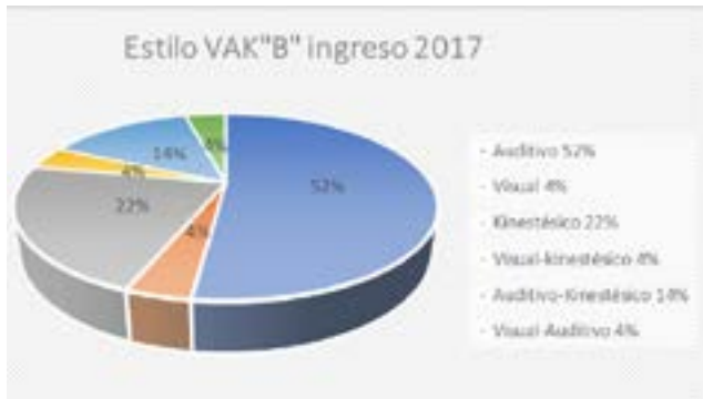
Figura 3 Estilo de aprendizaje VAK de los estudiantes del grupo "B" que ingresaron en 2017

respecto a su estilo de aprendizaje. El mayor porcentaje es 48% reflexivos y representa a los estudiantes reflexivos, característico de las personas que les gusta considerar las experiencias observadas desde diferentes perspectivas (González et al, 2018).