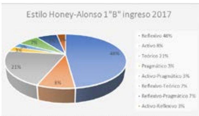
Figura 4 Estilo de aprendizaje Honey y Alonso de los estudiantes del grupo "B" que ingresaron en 2017

Como se aprecia en la figura 5 el estilo que predominó con 52% fue el canal de percepción auditivo, estos estudiantes no pueden olvidar una palabra porque no saben cómo sigue la oración; además, no permite relacionar conceptos abstractos con la misma facilidad que el visual (Flores, E. y Maureira, F., 2015 citado en Reyes, Molina, 2017).