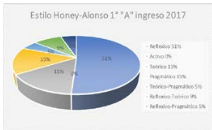
Figura 2 Estilo de aprendizaje Honey y Alonso de los estudiantes del grupo "A" que ingresaron en 2017

Como se aprecia en la figura 1 el estilo que predominó con 48% fue el canal de percepción auditivo este es cuando necesita escuchar su grabación mental paso a paso (Neira, 2015).