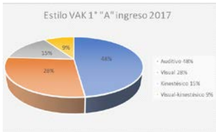
Figura 1 Estilo de aprendizaje VAK de los estudiantes del grupo "A" que ingresaron en 2017

Los estudiantes de los tres grupos que ingresaron en el año 2017 presentan los siguientes resultados: