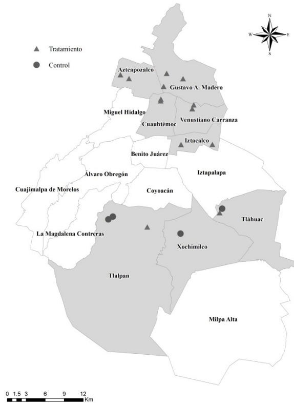
Figura 1. Distribución de la población evaluada.

cuarto y quinto grado de 17 escuelas primarias de los turnos matutino y continuo, ubicados en ocho delegaciones de la Ciudad de México, 3 tal como lo muestra la figura 1.