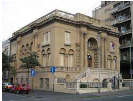
Figura 5: Museo de Tesla en Belgrado [27].