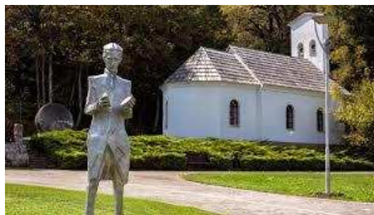
Figura 2: Museo e iglesia serbia ortodoxa en memoria de Nikola Tesla [17].

Su padre Milutin Tesla (1819-1879) era un sacerdote serbio de la iglesia ortodoxa. Su madre Georgina Đuka Tesla (1822-1892) era ama de casa y Nikola siempre afirmó que su genio e inventiva se lo debía a ella, ya que ideó varios