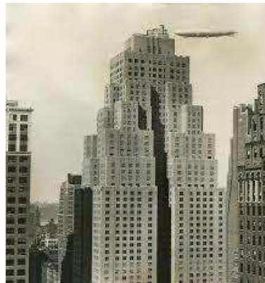
Figura 4: Hotel New Yorker [19].

En 1882 comienza a trabajar en la Continental Edison Company en París. En 1884, viaja en transatlántico a New York y comienza a trabajar con Thomas Alva Edison, gracias a una carta de recomendación. Son innumerables sus inventos, pasa años trabajando en un sistema diseñado para transmitir de forma inalámbrica voces, imágenes fijas y en movimiento y energía eléctrica convirtiéndolo en un futurista y el verdadero padre de la radio, el teléfono, los teléfonos celulares, la televisión y los sistemas eléctricos de potencia. Muere solo y, prácticamente como un indigente el 7 de Enero de 1943, a sus 86 años de edad, en un cuarto del Hotel New Yorker, ver Figura 4.