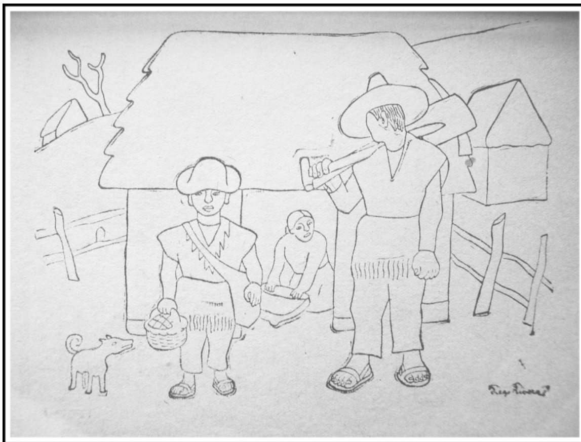
Ilustración 1. Campesinos y obreros como protagonistas de un libro de texto en el México de los 1930s. Dibujo de Diego Rivera, en Manuel Velázquez Andrade, Fermin (Ciudad de México, 193x), p. 5.

La representación de México como una nación mestiza casaba perfectamente con el nuevo énfasis en las clases populares como el sujeto nacional preponderante. Los libros de texto mostraban a los mestizos tanto como miembros de los sectores obreros, así como campesinos y clases medias. Como muestra la Ilustración 1, la vida diaria de los niños de origen humilde se convirtió en un punto focal de estos textos.