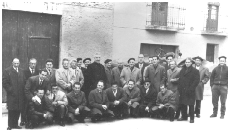
Acto de bendición del tractor de la Agrupación de Labradores