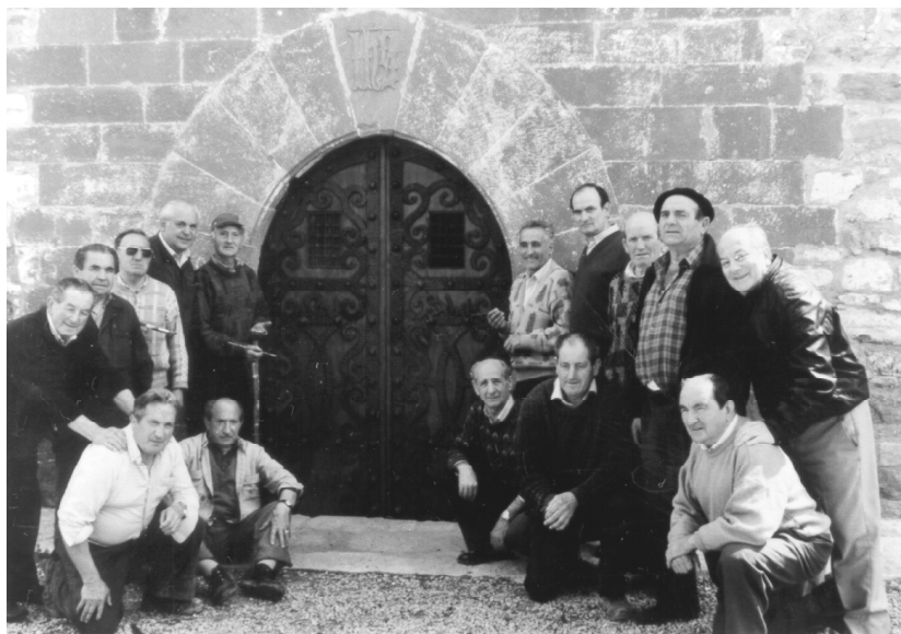
Grupo de jubilados que participaron en la restauración de la ermita de San Baibl.