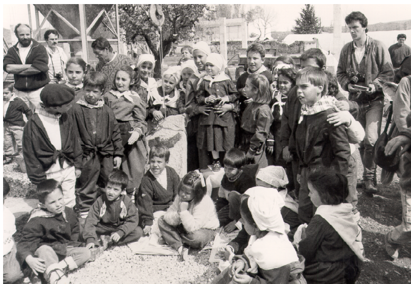
Colocación de la primera piedra en la Ikastola. 8-4-1989.

En 1990 salió el primer número de la revista de la Ikastola TTIPI TTAPA, correspondiente al curso 1989-1990. En el análisis de un año se decía: “La labor fundamental de la Junta Rectora a lo largo del presente curso se ha centrado con prioridad en todos los asuntos relacionados con la legalización y financiación del proyecto del nuevo edificio de la ikastola, su puesta en marcha y finalización del mismo....Queremos citar la actuación municipal en lo relativo a la Ikastola; la tramitación de la Licencia de obras no ha sufrido ningún problema importante por parte del M. I. Ayuntamiento de Sangüesa, encontrando una buena disposición del mismo hacia nuestro proyecto, como lo hace constar la concesión de gratuidad en la Licencia...” 400