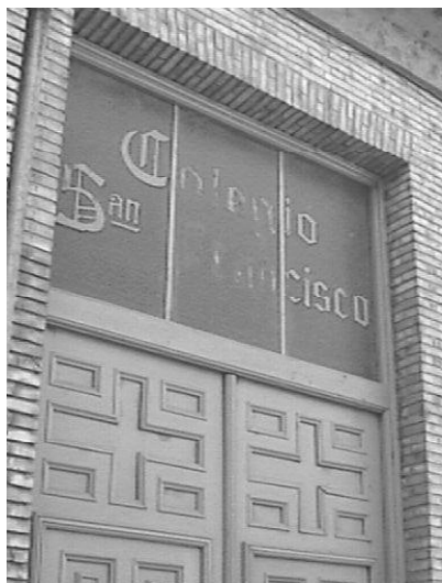
Colegio San Francisco. Puerta principal.

Zubeldía, 354 impulsor de varias iniciativas, el 23 de agosto de 1961. El comienzo de una conferencias en octubre de 1961, organizadas por la Orden