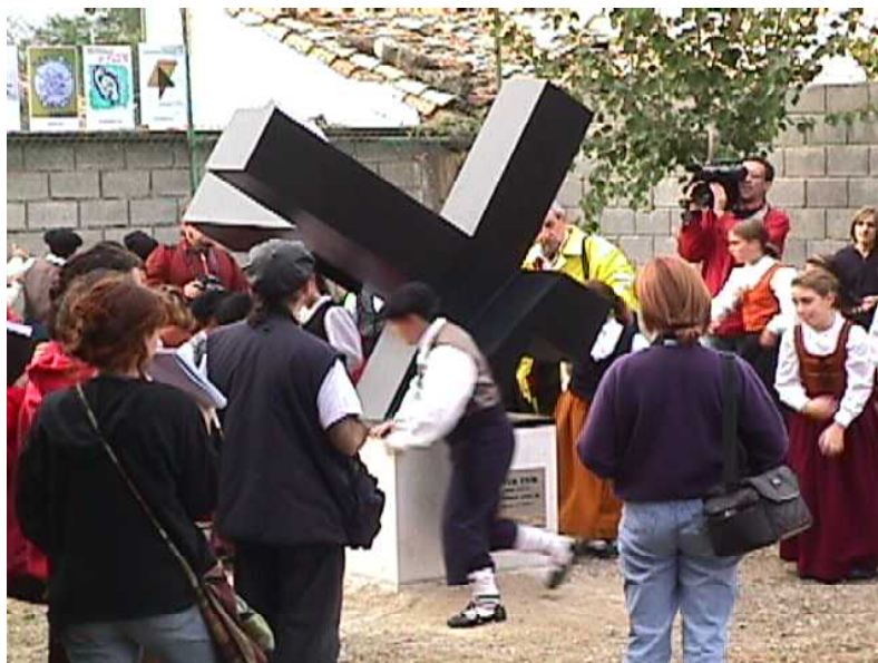
«Irtzen ezin», escultura de Jorge Oteiza, inaugurada el día del Nafarroa Oinez, el 18-10-1992.

Zangoza, según EUSKADI Informaciones, 410 seguramente record histórico de presencia humana en nuestra ciudad, que ningún otro acontecimiento haya podido registrar.