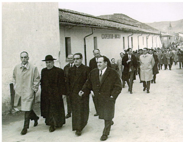
11-02-1968. Celebración de las bodas de plata de la Bodega Cooperativa San Sebastián.

la de litro, y la modalidad «borgoña 75» para la de tres cuartos. También contará con capsuladora, pondrá contraetiquetas y tapón de rosca. Las obras de acondicionamiento supondrán un coste adicional de 200.000 pesetas.