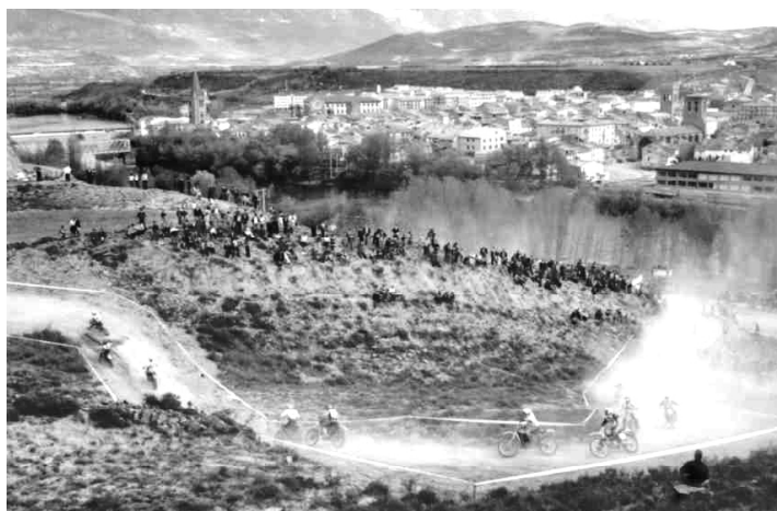
Carrera en el circuito de Sangüesa