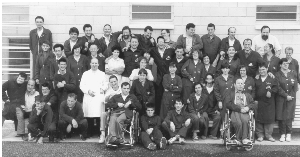
Plantilla del taller de Sangüesa en mayo de 1.992.

rifas, visitas, campañas de captación de socios y sobre todo sacar el problema a la calle.