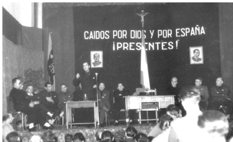
Acto de la Falange, el 20 de noviembre de 1959, en el Cinema España de Sangüesa. Día de los caídos por Dios y por España.

Este servicio tiene carácter obligatorio e inexcusable, esperando de esa Alcaldía una completa colaboración, ya que de lo contrario le exigiría apropiada responsabilidad, sin que pueda servir de excusa para no participar a mi Autoridad las actividades referidas, el que éstas lleguen a mi conocimiento por conducto distinto al de la Alcaldía, o sea por la Guardia Civil o cualquiera otros agentes de mi Autoridad». 289