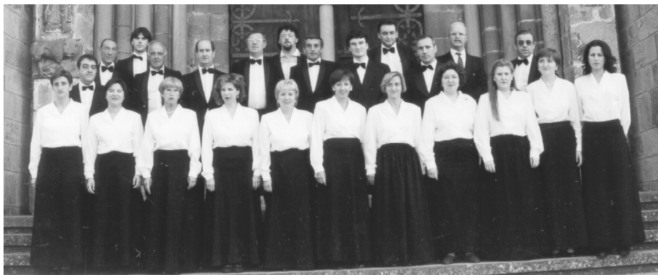
La Coral Nora, en el Monasterio de Leire, el 28-06-1998

Entre sus objetivos principales se encuentra el conocimiento, estudio e interpretación de la música universal, desde el canto gregoriano hasta las obras contemporáneas.