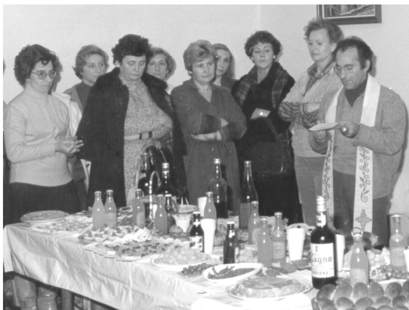
Acto de inauguración del local de las Amas de Casa, en la calle del Mercado.