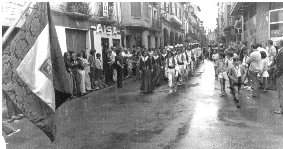
Rocamador Euskal Dantzari Taldea. Zangotza. 04-09-1.974