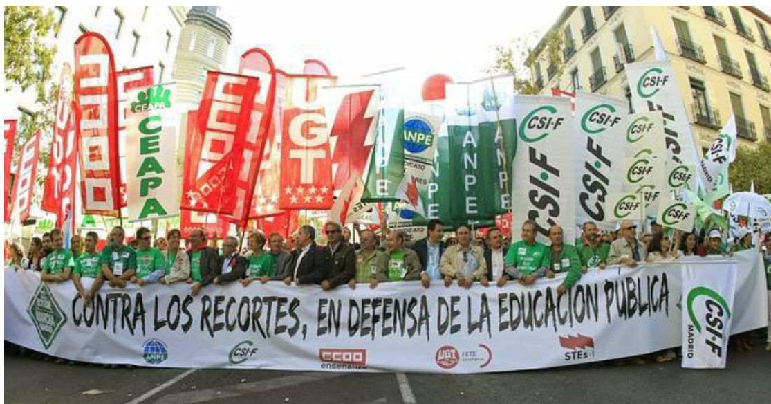
Protestas contra los recortes en educación en la ciudad de Madrid.

de los propios partidos podemos contrastar los porcentajes esgrimidos anteriormente.