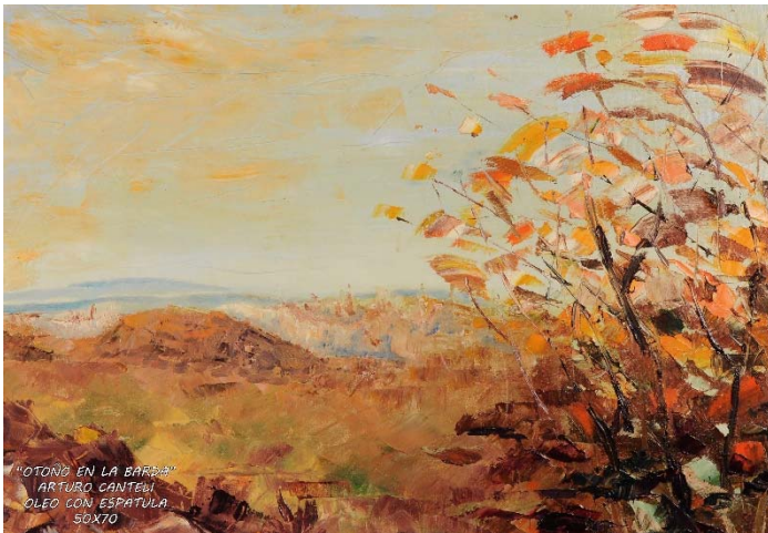
Otoño en la barda , óleo con espátula. Arturo Canteli

Es importante considerar la posibilidad de investigación sobre esta temática en la realidad escolar del país enfocándose en la estructura curricular desde los marcos legales, la cultura y formación del profesorado pro-colaboración interdisciplinaria como una posibilidad práctica desde las oportunidades de experiencia motriz que ofrece la Educación Física, las características de la infancia y juventud particular de cada realidad y/o las necesidades del contexto para su concreción.