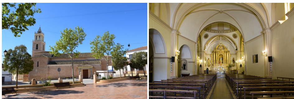
Iglesia de la Purísima Concepción de Barrax.

La dependencia de la iglesia de Barrax de la matriz de Lezuza, como es natural, no satisfacía a los vecinos de aquélla, y en el año 1774, el concejo de Barrax otorga un poder a Alonso Rodríguez de Bobada para iniciar los trámites de la segregación. Envían un primer escrito al arzobispado de Toledo en el que argumentan diversas razones para ello: que ambas villas distan entre sí tres leguas “ de camino muy áspero y fragoso y de frecuentes y abundantes nieves y lluvias ”; que el teniente de cura que regentaba la parroquial de Barrax no era “ persona de carrera que tenga la instrucciónn necesaria para ejercer la cura de almas ”; y por supuesto también aluden “ a la extrema necesidad que padece la iglesia en reparos, ornamentos, alhajas y demás adornos, (...) está caída por el coro, (...) el órgano está inservible y la torre sin campanas de provecho, pues una que había buena se ha quebrado ” (Jaén, 2011, pp. 50-51). Terminan pidiendo que sea iglesia independiente y que se ponga un cura propio.