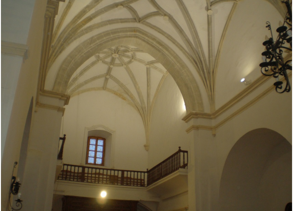
Coro de la iglesia de Lezuza, lugar donde estuvieron situados los órganos construidos por Francisco Gómez El Viejo (1581), por Francisco Buchosa (1746) y Gaspar de la Redonda (1773).

la Real Chancillería de Granada por incumplimiento de contrato (Santamaría, 1988, p.14). Y el cura, tras seis años de espera, solicita que la obra se ejecute con toda brevedad. Este largo pleito, según Enrique Máximo, ocasionaría la ruina económica del organero 16 .