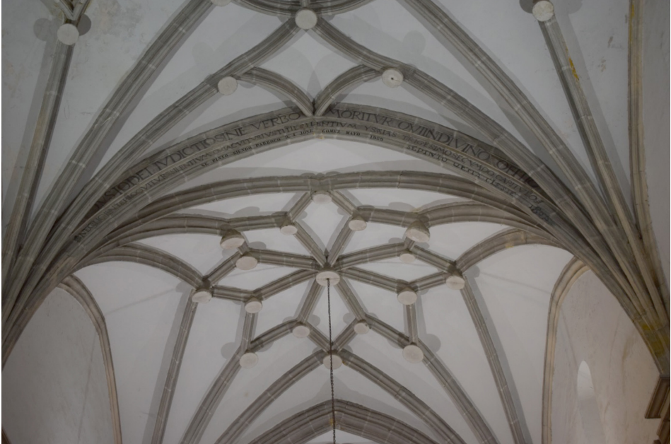
Arco perpiaño y bóvedas de crucería góticas de la iglesia de Lezuza. Inscripciones referentes al capítulo trigésimo segundo de Isaías. También aparece otra que dice: "SE PINTO QESTA CLESIE 1804". (Foto: J. A. Munera).

en todo su esplendor, con habilidad y destreza, consiguiendo que la trompeta magna, los nasardos y las quincenas inundasen de poesía y espiritualidad el templo parroquial.