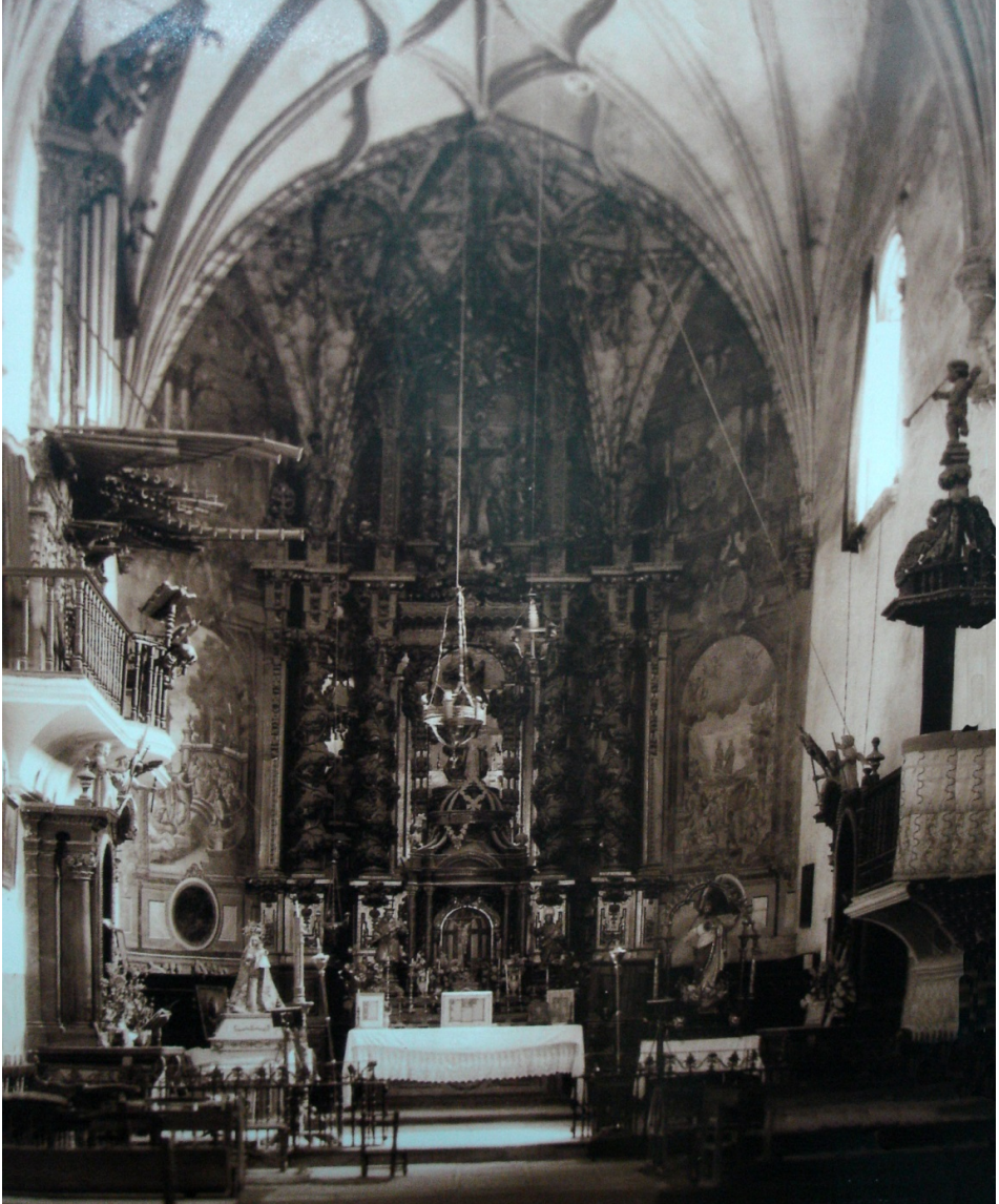
Presbiterio de la iglesia de Ntra. Sra. de la Asunción de Lezuza. A la izquierda, en el lado del evangelio, el órgano de Gaspar de la Redonda. (Foto Belda, hacia 1934).

Hasta aquí, un resumen de lo publicado en la revista Albasit . Nuevos descubrimientos y hallazgos nos hacen abordar esta nueva publicación en torno a los órganos que tuvo la iglesia de Lezuza.