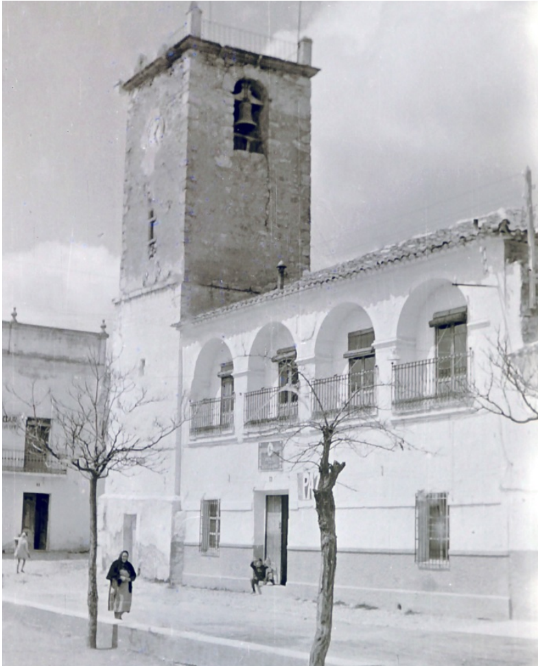
Antigua Torre del Reloj y Ayuntamiento de Lezuza. (Foto: A. Martínez Moreno, hacia 1965)

Antes del último pago, hubo de ser aprobada la obra por maestro inteligente en la materia. Y para este caso, el arzobispado de Toledo envió al organero de la catedral, Luis Berrojo 22 , “para la aprobación del órgano nuevo que se a echo” 23 . El informe fue favorable y se le abonaron al toledano 1.362 reales, por su desplazamiento y “por el gasto de comida y cevada” , claro está, ¡para las caballerías!