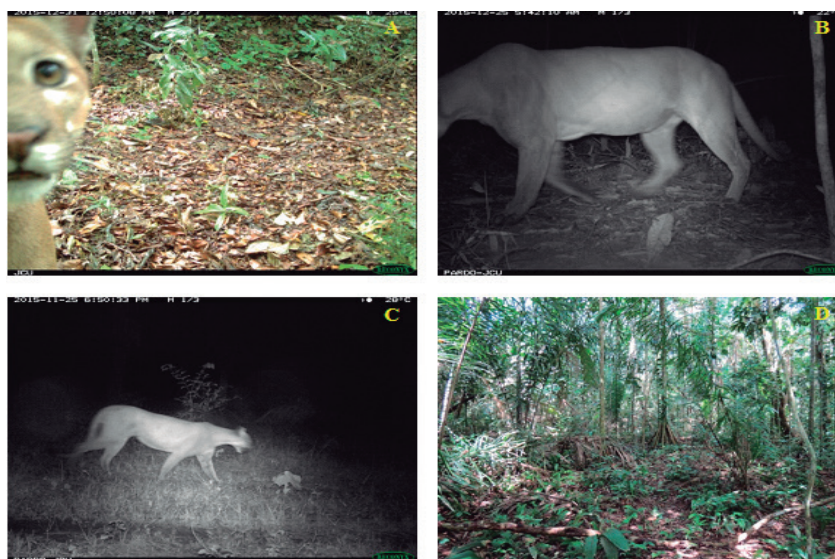
Figura 2. Fotos de individuos de puma ( Puma concolor ) detectados mediante fototrampeo (A, B, C). Vista general del bosque (D) donde se detectó el individuo de la imagen B. Zona rural del municipio de San Carlos de Guaroa.