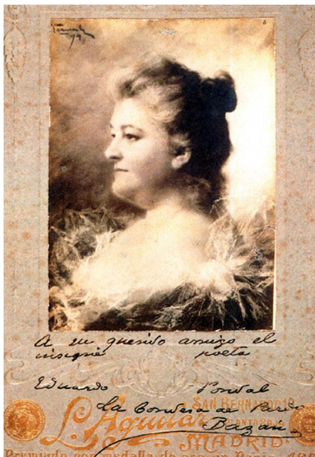
Primera imagen que Vaamonde realizó de Doña Emilia Pardo Bazán en el verano de 1894. Reproducción fotográfica del original, actualmente en paradero desconocido, con dedicatoria autógrafa de la escritora a Eduardo Pondal en 1902.