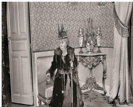
Emilia Pardo Bazán, escritora aristócrata que defendió los derechos de la mujer.