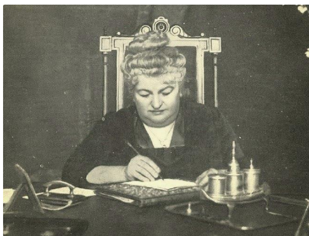
Emilia Pardo Bazán, escritora aristócrata que defendió los derechos de la mujer.