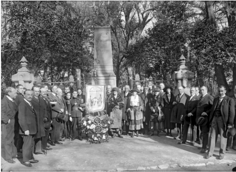
Imagen 6. Inauguración del monumento a los Niños Héroes en el bosque de Chapultepec en 1925 o 1926.