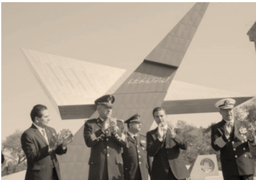
Imagen 21, Monumento Magno Conmemorativo del Centenario del Ejército Mexicano.

Los altares callejeros 39 son ahora el paradigma de sacralización del espacio público de la ciudad, contruidos por iniciativa de una persona o grupo que decide sacralizar el espacio público. Al parecer existe una necesidad de influir en el orden de las cosas para que sean favorables; este orden de las cosas puede ser concebido como la Divina Providencia que proviene de Dios, en donde los santos son encargados de abogar ante Él para disponer un orden de las cosas en el que los que le otorgan lealtad y le rezan sean beneficiados en él.