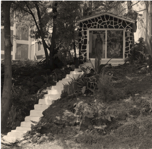
Imagen 22 Altar callejero en la rinconada de la Flora en Villa Panamericana, colonia Pedregal de Carrasco, Delegación Coyoacán en la Ciudad de México. Nótese la escalera que asciende hacia el citado altar en donde se encuentra la Virgen de Guadalupe.

Fuente: Imagen propia, 28 de julio de 2016.