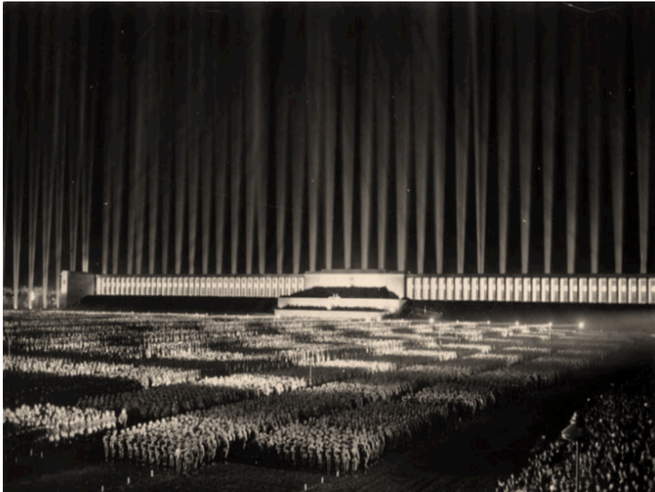
IMAGEN 2: La catedral de luz de Albert Speer en el Zeppelinfeld de Nuremberg. Los haces de las luces antiaéreas, proyectados hacia el cielo, constituyeron una forma muy ingeniosa de delimitar el gran espacio en el que se llevó el mitin nazi, mientras que la tribuna constituía una especie de altar hacia la consagración del Estado.