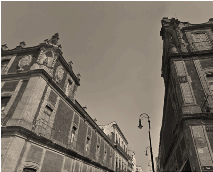
Imagen 4. Casas del Mayorazgo de Guerrero ubicadas en ambas esquinas de Moneda y Correo Mayor en la Ciudad de México. La casa del Sol y la casa de la Luna poseen hornacinas a la virgen María en la esquina de los parapetos del tercer cuerpo de ambas edificaciones.

Las hornacinas virreinales (imagen 4) tenían como objetivo la sacralización del espacio urbano con objetivos más allá de la expresión urbana de la fe “ante una sociedad que vivía permanentemente en los espacios abiertos [...] la importancia de las actividades al exterior produjo que las fachadas de las iglesias se convirtieran en el reflejo de sus altares, de forma que éstos salieron también a las calles”. 14