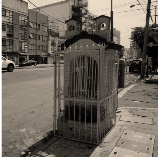
Imagen 23. Altar callejero en la esquina de Gral. Pedro Antonio de los Santos y Gral. Gómez Pedraza en la Colonia San Miguel Chapultepec II Sección en la Delegación Miguel Hidalgo, Ciudad de México