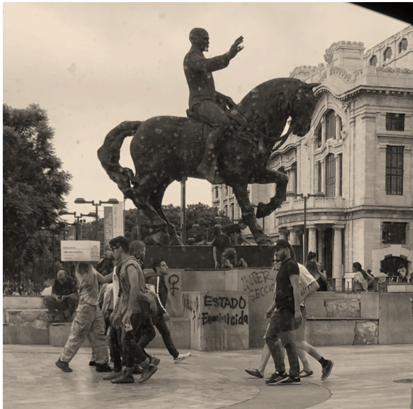
Imagen 9. Estatua ecuestre de Madero en la Alameda Central de la Ciudad de México.

En todo caso, la Revolución , como concepto repetido por setenta años, tenía un significado más profundo, al ser “la palabra mágica, la palabra que va a cambiarlo todo y que nos va a dar una alegría inmensa y una muerte rápida”, 37 ya que esta palabra mágica encerraba en sí misma el proyecto de nación, el sacrificio enorme y la utopía; cosa que la democracia no ha logrado abarcar del todo. El gobierno de Calderón intentó materializar la democracia buscando una liga con la historia del México moderno con la erección de la estatua ecuestre de Madero (imagen 9) en la Alameda Central de la Ciudad de México, esa imagen del “apóstol de la democracia”, como lo llama Krauze, parecía un intento de anclar a una nación despistada y sin rumbo otra vez en la Revolución mexicana, pero al no existir un proyecto de nación se ligaba al proyecto burgués de Madero desde una época neoliberal.