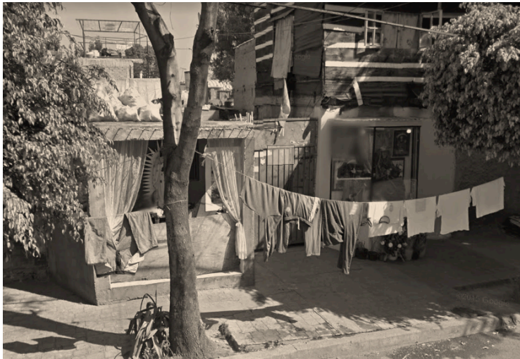
Imagen 25. Altares callejeros en la 2ª Cda. de Lago Wetter. Lo curioso de esta imagen es que el altar callejero de la izquierda está dedicado a la Virgen de Guadalupe, mientras que el de la derecha está dedicado a la Santa Muerte. Si bien los altares callejeros no son una construcción exclusiva de la Iglesia católica, el culto a la Santa Muerte carece del poder corporativo de la Iglesia católica. El culto a la Santa Muerte se mantiene en la marginalidad.

Fuente: Imagen propia, 1 de junio de 2019.