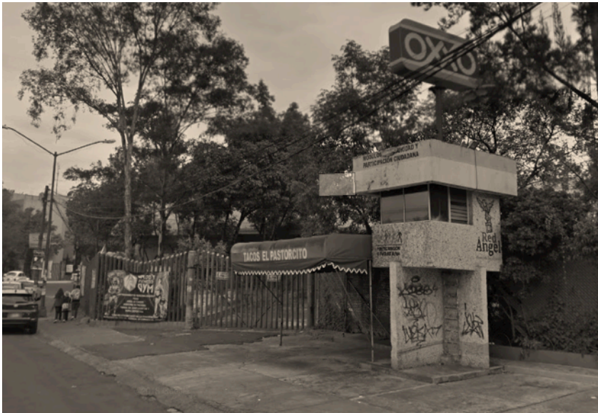
Imagen 7. Módulo policial sobre la Avenida Panamericana en la Colonia Pedregal de Carrasco de la delegación Coyoacán en la Ciudad de México. Es perfectamente visible la ausencia de un proyecto de nación actual, ya que la lucha contra la inseguridad es un concepto muy abstracto y ambiguo.

El vacío dejado por el PRI llevó a la organización de la sociedad civil y a la constitución de partidos políticos de oposición, pero dejó un hueco en la religiosidad popular laica, pues ante la falla sistémica, se dejaban de cumplir las promesas de la Revolución demostrando que ésta había muerto con todo su panteón de héroes y antihéroes y la necesidad de migrar llevaría a dar la espalda a aquello que se constituyó como sagrado para la ideología de Estado: la Patria .