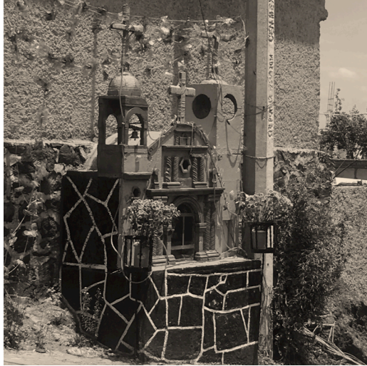
Imagen 24: Altar callejero en la calle de Chabacano, casi en la esquina de la Avenida México-Ajusco en el Pueblo de Santa María Petlalcalco, en la Delegación Tlalpan, Ciudad de México.

Fuente: Imagen propia, 1 de junio de 2019.