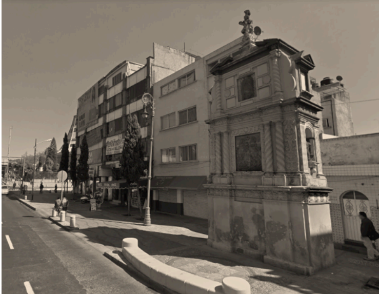
Imagen 5. Misterio que, en su segundo cuerpo, muestra la coronación de la Virgen María sobre la Calzada de los Misterios casi en la esquina con Zumárraga.