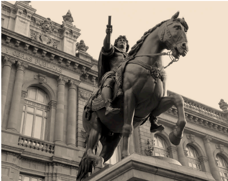
Imagen 5. Estatua ecuestre de Carlos IV, conocida popularmente como “el caballito” obra de Manuel Tolsá en su actual ubicación frente al Museo Nacional de Arte en la calle de Tacuba en el centro histórico de la Ciudad de México.