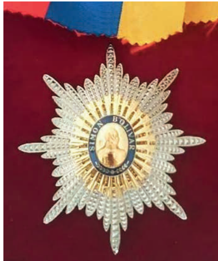
Placa del Collar de la Orden del Libertador