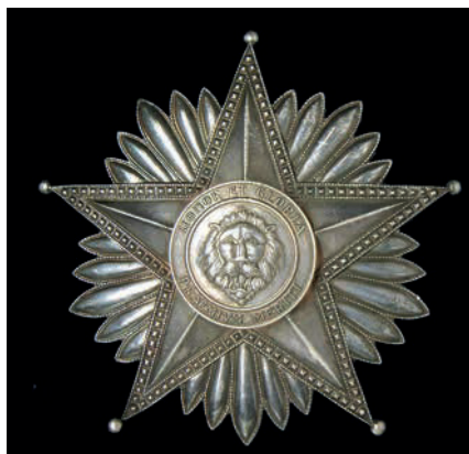
Collar y placa de la Orden Nacional del Mérito de Paraguay en el grado de Collar Mariscal Francisco Solano López