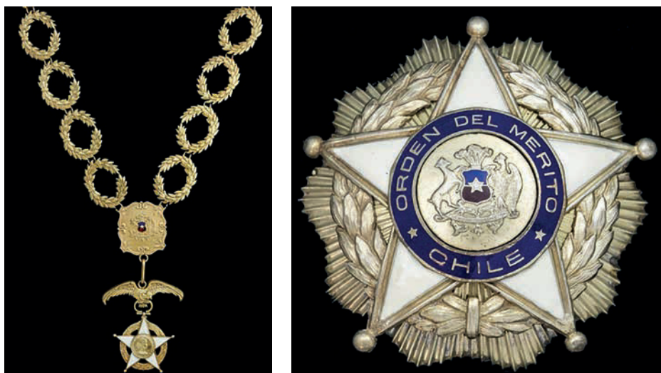
Collar y placa de la Orden Nacional del Mérito de Chile