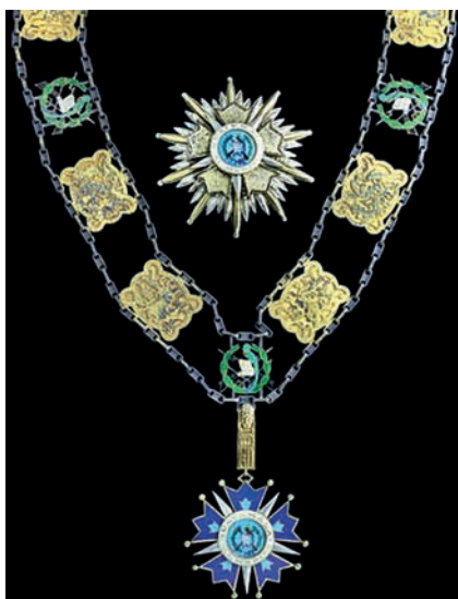
Gran Collar de la Orden del Quetzal