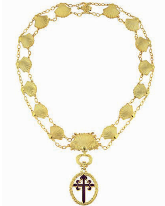
Gran Collar de la Orden Militar de Santiago de la Espada