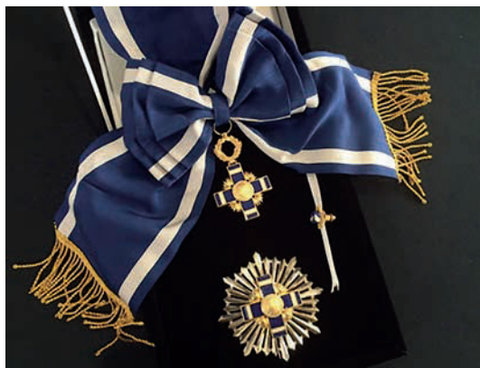
Imagen del conjunto de las insignias Gran Cruz, Placa de Oro con distinción especial de la Orden José Matías Delgado