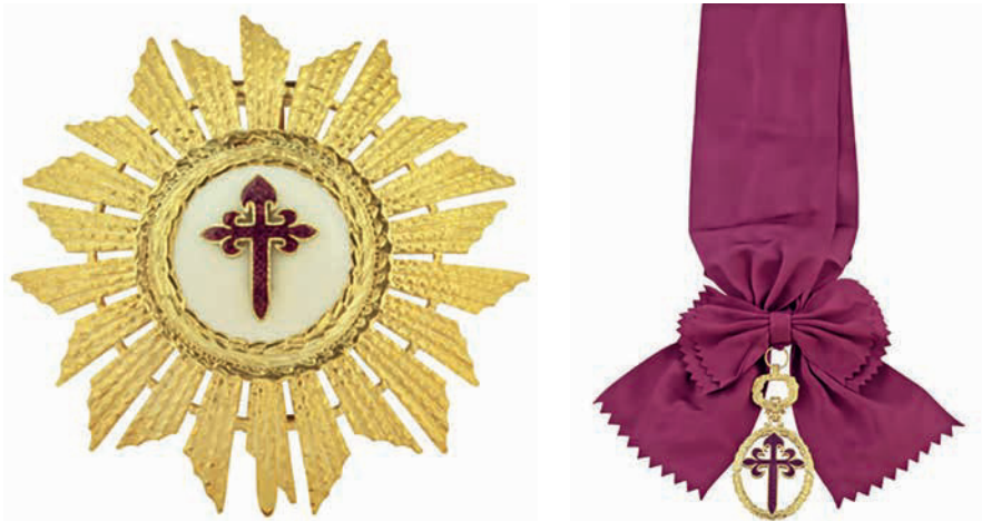
Placa y Banda del grado de Gran Collar de la Orden de Santiago de la Espada