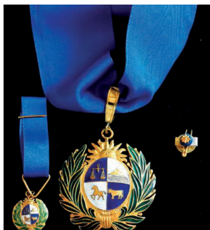
Medalla República Oriental del Uruguay

— Medalla República Oriental del Uruguay 70 (11 de enero de 1996).