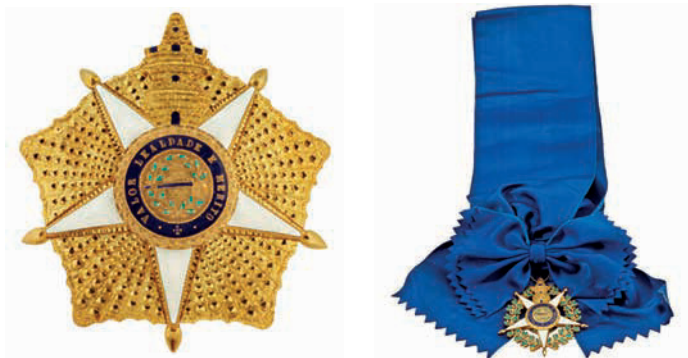
Placa, banda y venera de la Orden de la Torre y la Espada