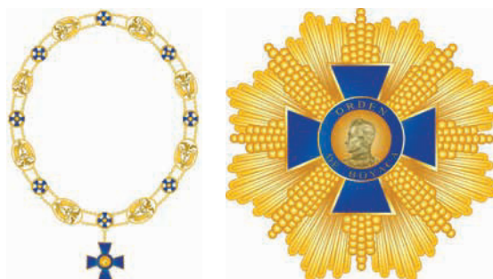
Diseños de las insignias para la categoría del Gran Collar de la Orden de Boyacá