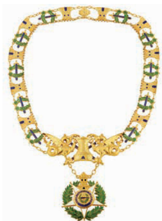
Gran collar de la Orden Militar de la Torre y la Espada