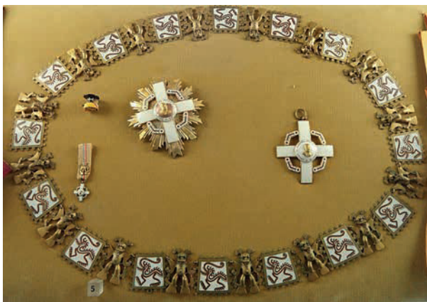
Collar, placa y venera de la Orden de «Manuel Amador Guerrero»

— Collar de la Orden de «Manuel Amador Guerrero» 23 (16 de septiembre 1977).