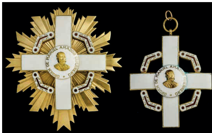
Detalle de la Placa y la venera de la Orden de «Manuel Amador Guerrero»