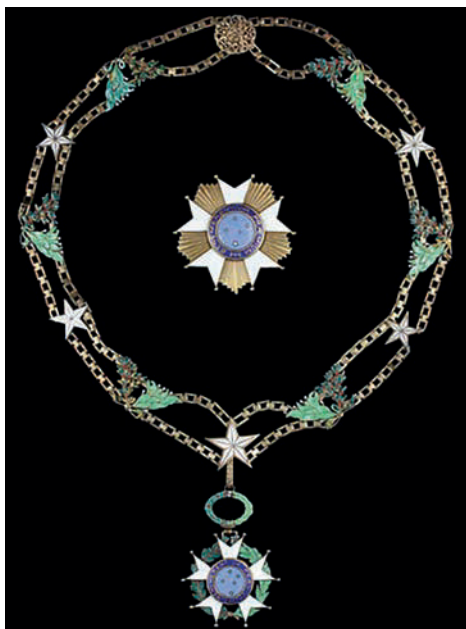
Insignias del Gran Collar de la Orden de la Cruz del Sur