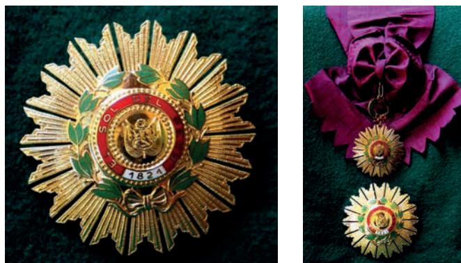
Insignias de la Gran Cruz de la Orden «El Sol del Perú»