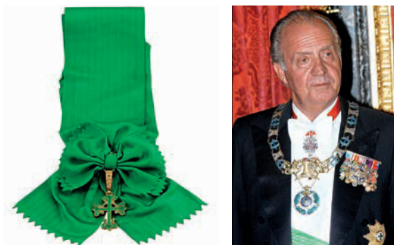
Banda y venera de la Gran Cruz de Orden Militar de Avis.

— Gran Cruz de la Orden Militar de Avis 84 (18 de junio de 2007 85 ).