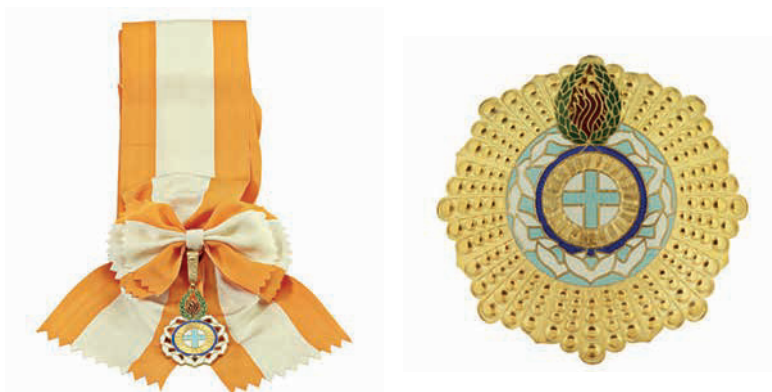
Insignias del grado de Gran Collar de la Orden de la Libertad