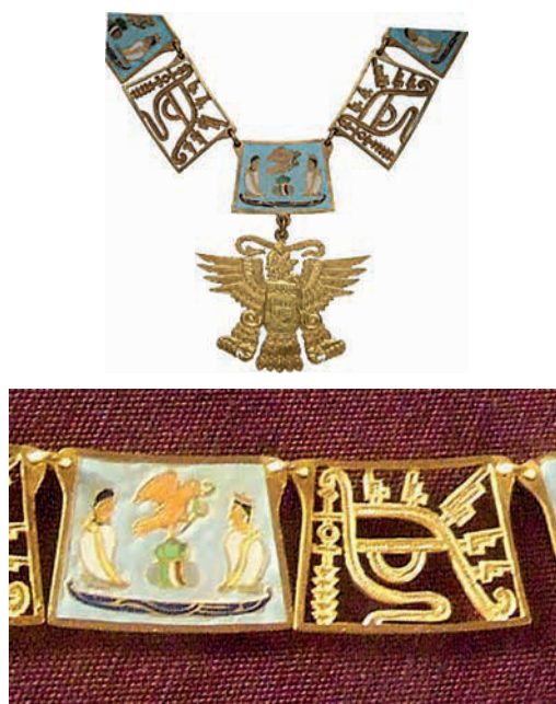
Detalles del Collar de la Orden Mexicana del Águila Azteca (medallón y eslabones)

— Collar de la Orden Mexicana del Águila Azteca 25 (17 de octubre 1977 26 ).