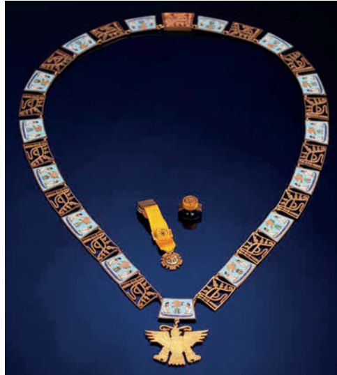
Collar de la Orden Mexicana del Águila Azteca