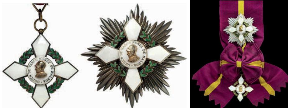
Detalle de la placa y la vena de la categoría Gran Cruz de la Orden de Vasco Núñez de Balboa 36