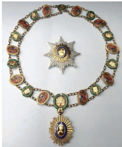
Gran Collar de la Orden del Libertador