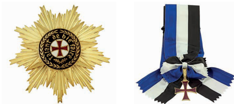
Banda y placa de la categoría Gran Collar de la Orden del Infante Don Enrique