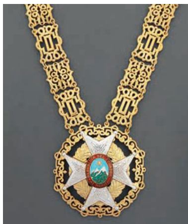
Gran Collar de la Orden Nacional del Mérito del Ecuador

— Gran Collar de la Orden Nacional al Mérito 41 (12 de mayo 1980).