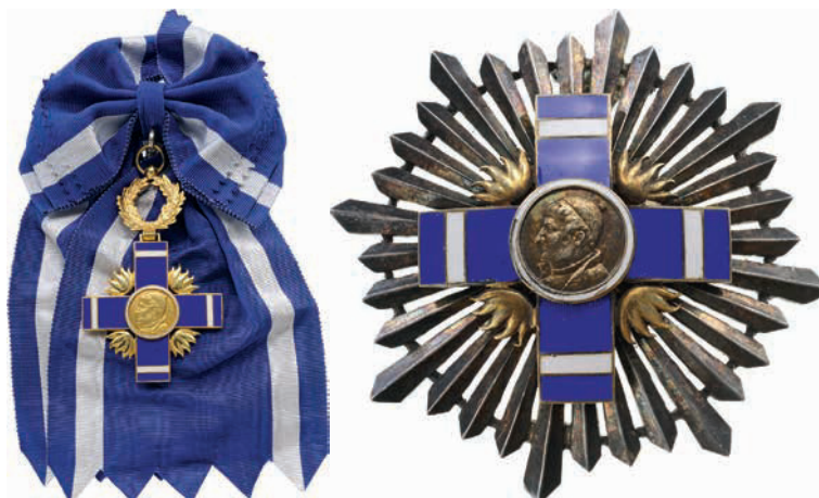
Nota: esta imagen corresponde a la Gran Cruz, Placa de Plata. Para la categoría Gran Cruz, Placa de Oro el rafagado de la placa sería dorado