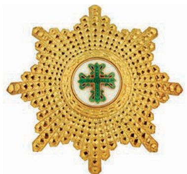
Placa de la Gran Cruz de Orden Militar de Avis