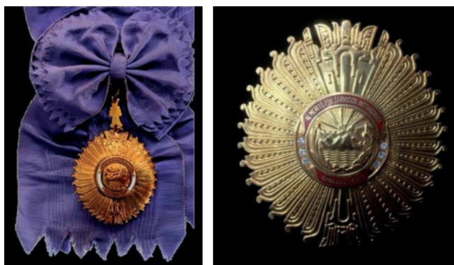
Banda, venera y placa de la Gran Cruz con brillantes de la Orden de Mérito por Servicios Distinguidos

— Gran Cruz con Brillantes de la Orden de Mérito por Servicios Distinguidos 62 (22 de octubre de 1991).