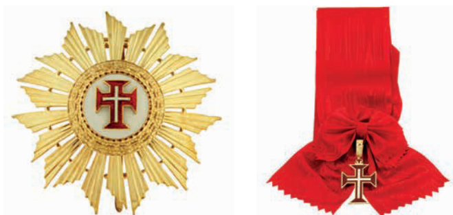
Placa, banda y venera de la Gran Cruz de la Orden Militar de Cristo de Portugal

— Gran Cruz de la Orden Militar de Cristo 72 (23 de agosto de 1996).