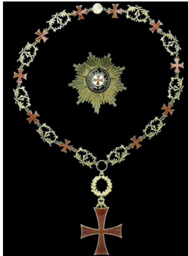
Collar de la Orden del Infante Don Enrique