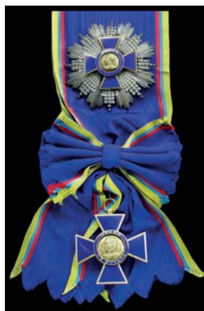
Diseño de la placa de oro de la Gran Cruz extraordinaria de la Orden de Boyacá (10)