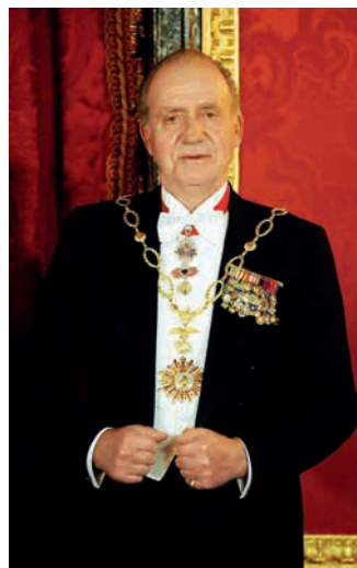
Collar de la Orden del Libertador San Martín