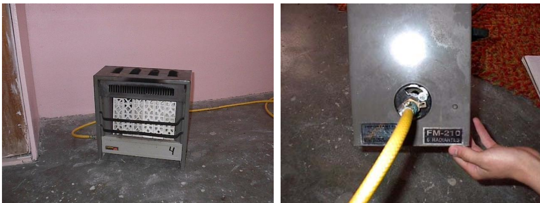
Figura 2 características de los Calentadores

La figura 2 muestra la apariencia de los calentadores utilizados en la presente investigación.