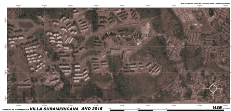
Figura 4. Villa Suramericana y alrededores (2015).