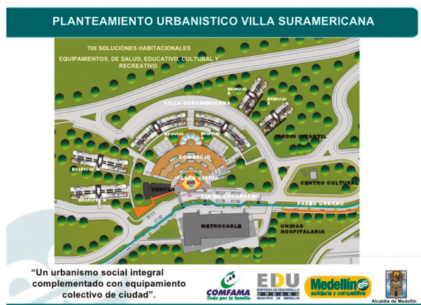
Figura 5. Diseño de la Villa Suramericana y sus alrededores (2008).

Fuente: Empresa de Desarrollo Urbano (EDU, s. f.).