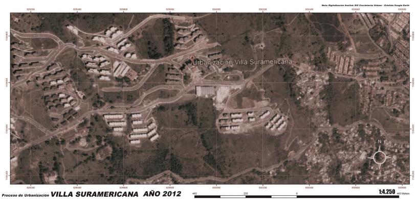
Figura 3. Villa Suramericana y alrededores (2012).