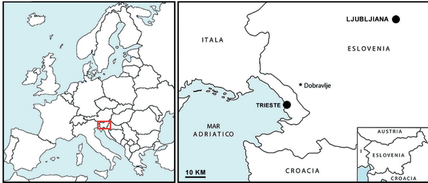
Figura 1. Situación geográfica con indicación de la localidad de Dobravlje en Eslovenia donde se recuperó el ejemplar de tortuga objeto de estudio.