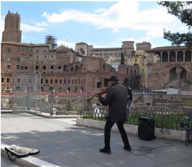
Miré los muros, fotografía, Patricia Bonjour

Esta investigación concluye que es necesario que los colegios abran espacios pedagógicos orientados hacia la formación del apoderado, en este caso escuela para padres.