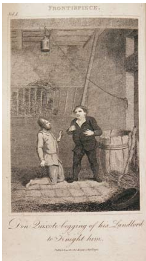
Lámina 4: Don Quijote pide un don al ventero (I, cap. 3): Anónimo (Londres, 1792).

Y el mundo de ficción se ampliará ahora con la participación de los personajes, que le van a seguir el juego “por tener que reír aquella noche”. Y así el ventero no sólo acepta –por unos minutos– “ser” dueño de un famoso castillo, sino que va a inventarse en ese momento un linaje y un pasado, que deja admirado al caballero andante –que lo escucha al pie de la letra– y divertido al lector –que va más allá de lo que se dice. Vale la pena rescatar este párrafo, lleno de guiños para los lectores de su época 3 :