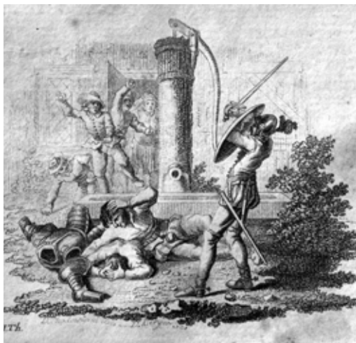
Lámina 23: Don Quijote es atacado por los arrieros (I, cap. 3): por D. Chodowiecki (Leipzig, 1780).

del Quijote en alemán impresa en 1780 [lámina 23]. Piedras que también aparecerán en la edición impresa en Madrid por la Imprenta Real entre 1797 y 1798 [lámina 24] que ofrece una lectura cómica de la obra, con la representación de episodios muy alejados de las ideas defendidas por las ediciones académicas o por la espléndida edición de Gabriel de Sancha, y ya más adelante en la edición francesa de 1866, con ilustraciones de Roux [lámina 25].