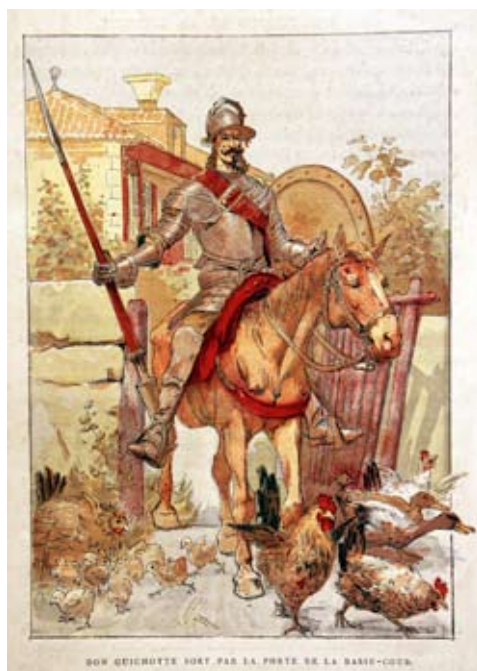
Lámina 1: Don Quijote en su primera salida (I, Cáp. 2): por Myrbach de Rheinfield, Felicien (París, 1883).

“ M ás apenas se vio en el campo, cuando le asaltó un pensamiento terrible, y tal, que por poco le hiciera dejar la comenzada empresa; y fue que le vino a la memoria que no era armado caballero y que, conforme a la ley de caballería, ni podía ni debía tomar armas con ningún caballero, y puesto que lo fuera, había de llevar armas blancas, como novel caballero, sin empresa en el escudo, hasta que por su esfuerzo la ganase. Estos pensamientos le hicieron titubear en su propósito; mas, pudiendo más su locura que otra razón alguna, propuso de hacerse armar caballero del primero que topase, a imitación de otros muchos que así lo hicieron, según él había leído en los libros que tal le tenían” (I, Cáp. 2) 1 . Don Quijote, el caballero andante que, como se sabe, salió una madrugada por la puerta del corral en busca de aventuras, conoce hasta en sus detalles los ritos y las características de la milicia, de la caballería andante.