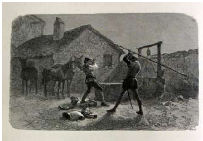
Lámina 30: Don Quijote ataca a uno de los arrieros (I, cap. 3): por Ricardo Balaca (Barcelona, 1780).

En el caso de la representación del acto de investidura, el humor se buscará, además de en la expresión de algunos de los personajes, como así lo hace Grandville en la edición de Tours de 1848 [lámina 31], en la representación de don Quijote en posturas poco acordes al momento solemne que se está representado; este es el camino que andará Robert Smirke en su edición de 1818 [lámina 32] o Houghton, en la edición londinense de 1866 [láminas 33]. Sobran las palabras.