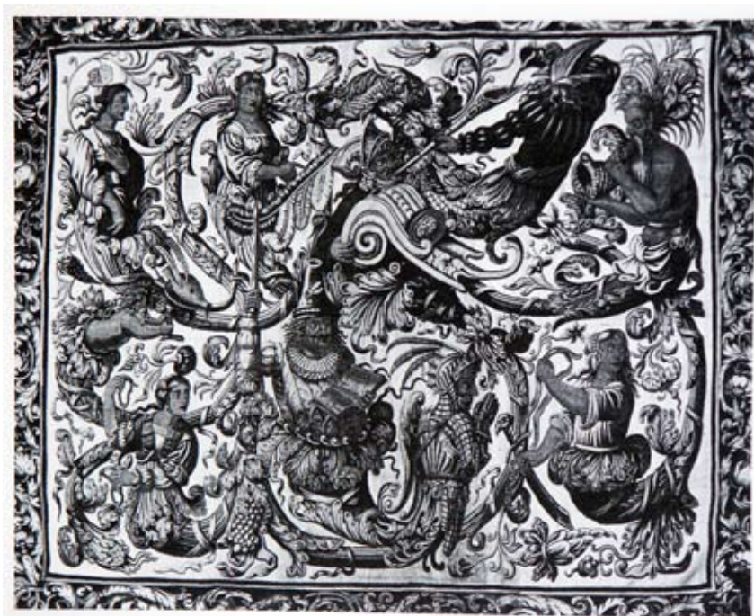
Lámina 13: Tapiz de Francis Poyntz (h. 1675)

Humor y solemnidad –que también resulta cómica cuando se tiene en cuenta no las acciones de los personajes, sino su capacidad para realizarlas– serán las líneas maestras de la recepción del Quijote , de este particular episodio durante el siglo XVII: un libro de caballerías cómico, como muy bien se aprecia en uno de los tapices de Francis Poyntz, de hacia 1675, conservado actualmente en el Cawdor Castle en Escocia [lámina 13]. Entre la maraña de personajes y de decoraciones, se aprecia la figura del ventero, con su espada en alto, la figura de las dos prostitutas, la expresión solemne del nuevo caballero andante, así como los elementos necesarios para poder identificar otro de los primeros episodios ilustrados de la primera parte del Quijote : la comida del caballero andante en la venta, con caña incluida.