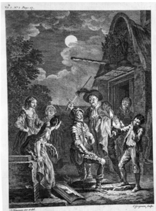
Lámina 17: Don Quijote es armado caballero (I, cap. 3): Charles Grignion, por dibujo de Francis Hayman (Londres, 1755).

Los mismos personajes que en la estampa francesa realizada a partir del cartón de Coypel; la misma actitud y el mismo momento de la imagen del modelo iconográfico holandés , estampada por Frederik Bouttats... pero hay algo en esta imagen diferente: las prostitutas, así como los personajes que miran la escena desde la puerta, parecen reír, parecen sonreírse con lo que están presenciando, pero ya no es la carcajada de las estampas francesas de Lagniet, ya no es esa cara burlona de la imagen de Coypel, si no que está todo comedido, porque lo que prevalece en la imagen, lo que realmente se ha convertido en su centro, es la actitud seria y solemne, como no podía ser de otro modo en momento tan trascendental en todo libro de caballerías, tanto del huésped, que lee en su libro, como de don Quijote, que, de rodillas, espera (casi impaciente) que con el espaldarazo dé comienzo su carrera de caballero andante. Imagen muy similar, aunque con algunos toques más cómicos, como suele ser habitual en su autor, es también la ideada por Francis Hayman para la edición londinense de 1755, que entra también dentro del modelo iconográfico inglés [lámina 17].