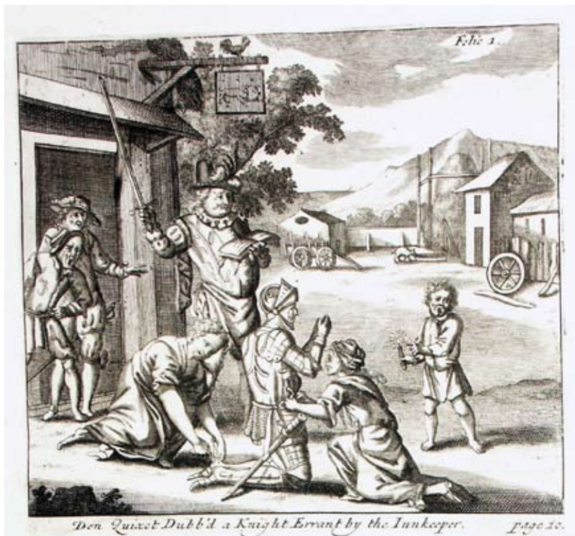
Lámina 11: Don Quijote es armado caballero (I, cap. 3): Anónima (Londres, 1687)

En la imagen múltiple que ofrece la estampa se rescatan los dos momentos anteriormente indicados: el momento en que don Quijote se dispone a pegar con su lanza a un arriero y el acto de investidura, en que todos los personajes, frente a lo que podíamos ver en la estampa francesa, muestran una solemnidad, más allá de los detalles cómicos en los que había basado Cervantes la comicidad de su texto. El Quijote es un libro de caballerías cómico, pero, sobre todo, un libro de caballerías, en que don Quijote ahora sí que parece recibir, como se merece, la orden que le abrirá las puertas a la fama de sus hazañas. Esta misma solemnidad es la que parece encontrarse en la estampa inglesa, de autoría anónima, que ilustra este episodio en la primera edición inglesa ilustrada de la obra cervantina, la impresa en Londres en 1687 [lámina 11].