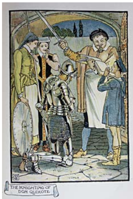
Lámina 22: Don Quijote es armado caballero (I, cap. 3): por Walter Crane (Londres, 1900).

6.2. En otros casos, se va a seguir prefiriendo una representación cómica del episodio, un incidir en detalles cómicos, concretados tanto en la actitud de los personajes como en sus gestos. En estas ediciones, como así sucedía en las primeras propuestas iconográficas del Quijote , se ilustrarán los dos episodios en que hemos dividido la aventura: tanto los golpes que reciben los arrieros o don Quijote en la vela, como el propio acto de investidura. Uno de los primeros grabadores en rescatar el momento en que don Quijote comienza a recibir la lluvia de piedras de los arrieros es Daniel Chodowieki en la edición ilustrada