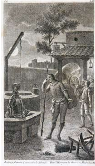
Lámina 34: Don Quijote vela las armas (I, cap. 3): F. Muntaner, por dibujo de Isidro y Antonio Carnicero (Madrid, 1782).