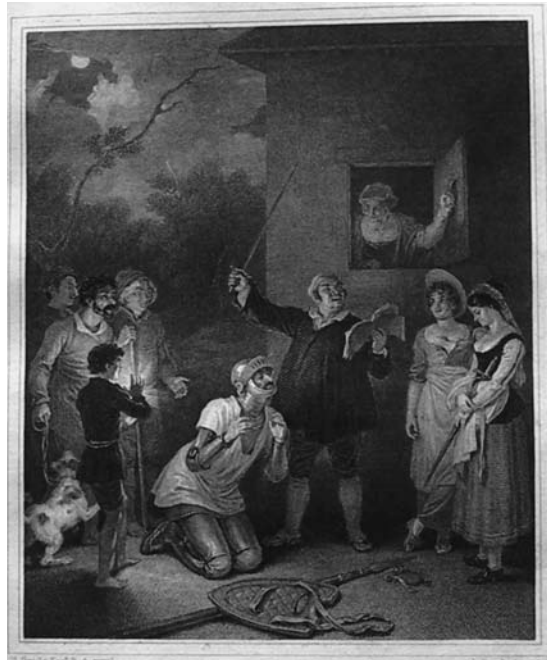
Lámina 32: Don Quijote es armado caballero (I, cap. 3): Robert Smirke (Londres, 1818)