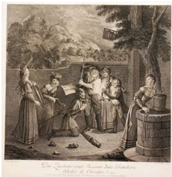
Lámina 15: Don Quijote es armado caballero (I, cap. 3): Charles Nicolás Cochin, el padre, a partir de cartón de Charles Antoine Coypel (París, 1724).

1724 se pone a la venta una serie de estampas sueltas basadas en estas imágenes, que serán algunas de las propuestas iconográficas más exitosas a lo largo de la centuria: no podía ser de otro modo, dado la preeminencia cultural del rococó francés por toda Europa. En la estampa grabada por Charles Nicolás Cochin, el padre, en 1724, se aprecia el gusto de Coypel por las representaciones teatrales, la clara disposición de los personajes, la solemnidad a la que se ha sometido toda la escena... una solemnidad forzada, a punto de estallar en medio de carcajadas y risas, como se muestra en la cara de varias de las mujeres que aparecen en la escena, y que miran –como suele ser habitual en este tipo de representaciones francesas- directamente al público, convirtiéndose en espejo de la reacción de los lectores coetáneos del Quijote a principios del siglo XVIII. El Quijote se va llenando de detalles, el Quijote va congregando a su alrededor a los más importantes artistas, a los más excelentes escritores... pero sigue siendo leído como un libro cómico, como un texto que hace las delicias de sus lectores, aunque ya los libros de caballerías se hayan convertido en una lectura lejana, en absoluto cotidiana, como había podido ser un siglo antes.