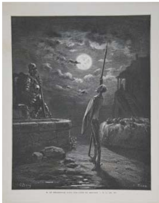
Lámina 38: Don Quijote vela las armas (I, cap. 3): Henri Pisan por dibujo de G. Doré (París, 1863)

Y en este ir conformando una nueva imagen, una lectura que vaya más allá del libro para acercarse al mito, es necesario colocar en un lugar destacado la propuesta de Gustave Doré, grabada por Henri Pisan e impresa en París en 1863 [lámina 38]: don Quijote en sombras, don Quijote en noche cerrada, Don Quijote sólo ante su próximo destino. Don Quijote en su apoteosis desde las primeras páginas del libro. Don Quijote levantando su espada a los cielos. Don Quijote desafiando a la luna por su amor por Dulcinea.