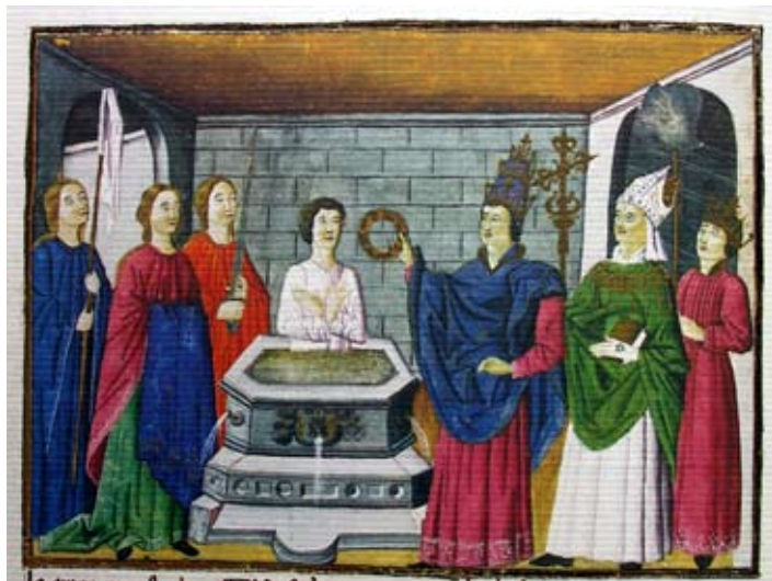
Lámina 6: Acto de investidura: Libro del cavallero Zifar , códice de finales del siglo XV

Normalmente, el ritual de investidura pone el punto de partida para la organización de torneos y otros tipos de festejos en los que, al tiempo que se comparte la alegría de contar con un nuevo caballero andante, permitía al joven demostrar sus habilidades.