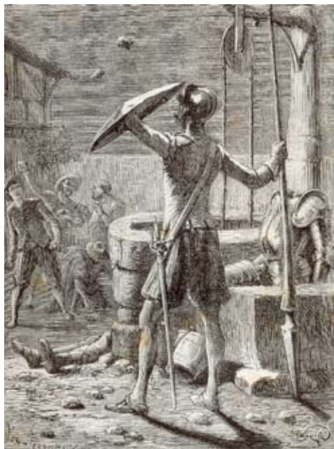
Lámina 25: Don Quijote es atacado por los arrieros (I, cap. 3): Yon y Pericón por dibujo de G. Roux (París, 1866)

En todo caso, no será este el momento más ilustrado de este episodio: se preferirá, como así sucedía en el siglo XVII, con los golpes que don Quijote arremete al primero o al segundo arriero, como así lo hará Thomas Stothard en la edición londinense de 1782 [lámina 26], George Cruikshank en 1831 [lámina 27], Alken, en una muy poco conocida serie de estampas, impresas en Londres también en 1831 [lámina 28], Tony Johannot en su edición super-ilustrada de 1836-1837 [lámina 29] o Ricardo Balaca, en su monumental edición ilustrada de 1880 [lámina 30].