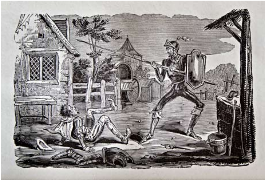
Lámina 27: Don Quijote ataca a uno de los arrieros (I, cap. 3): Sears a partir de dibujo de G. Cruikshank (Londres, 1831)