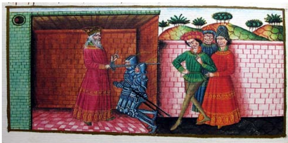
Lámina 5: Acto de investidura: Libro del cavallero Zifar , códice de finales del siglo XV