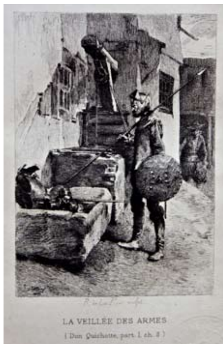
Lámina 37: Don Quijote vela las armas (I, cap. 3): por Ricardo de los Ríos, a partir de dibujo de Worms (París, 1884).