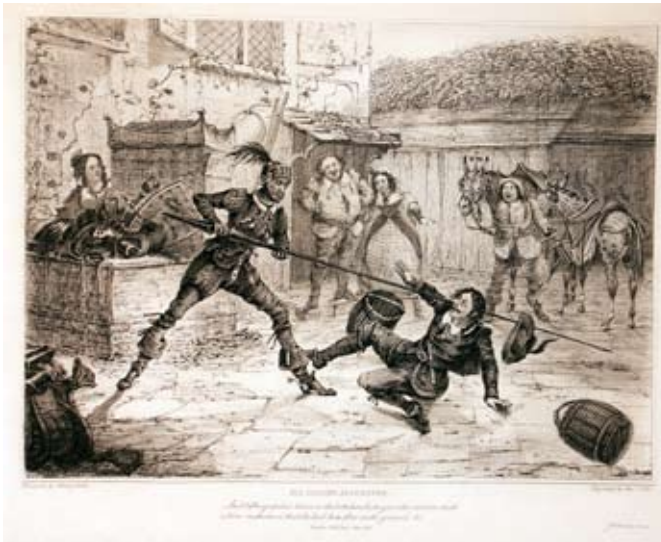
Lámina 28: Don Quijote ataca a uno de los arrieros (I, cap. 3): por Alken (Londres, 1831).