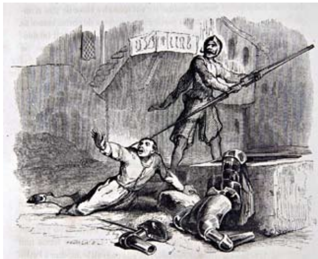
Lámina 29: Don Quijote ataca a uno de los arrieros (I, cap. 3): por Tony Johannot (París, 1836-1837).