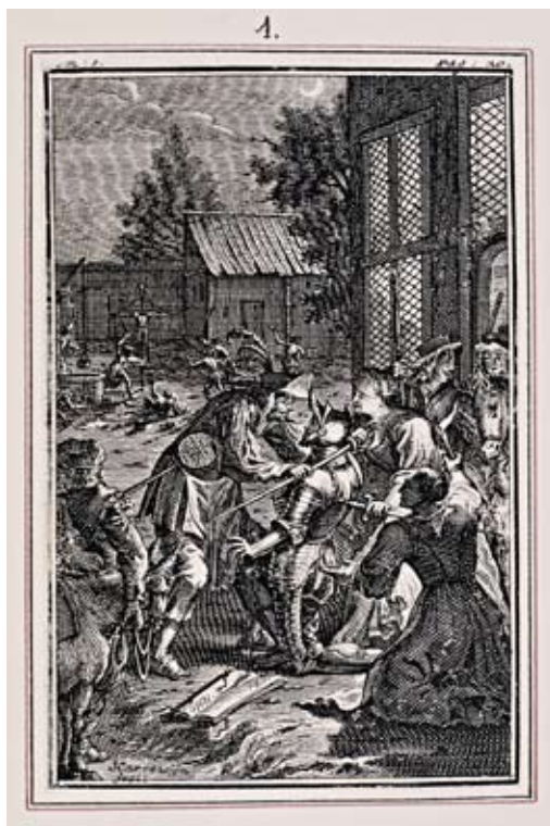
Lámina 12: Don Quijote es armado caballero (I, cap. 3): por Jacob Harrewyn (Bruselas, 1706)

En cambio, en la propuesta de transición del modelo iconográfico holandés , la edición impresa en Bruselas en 1706, con ilustraciones ideadas y grabadas por Jacob Harrewyn, se sigue de cerca la imagen realizada por Bouttats, pero incidiendo en algunas detalles cómicos, como la expresión del ventero, que ya no está empuñando la espada, mientras lee en el “libro donde asentaba la paja y la cebada que daba a los arrieros”, como si estuviera diciendo una “devota oración”, sino que le está dando con su espada el “gentil espaldarazo” que el caballero novel estaba esperando [lámina 12].