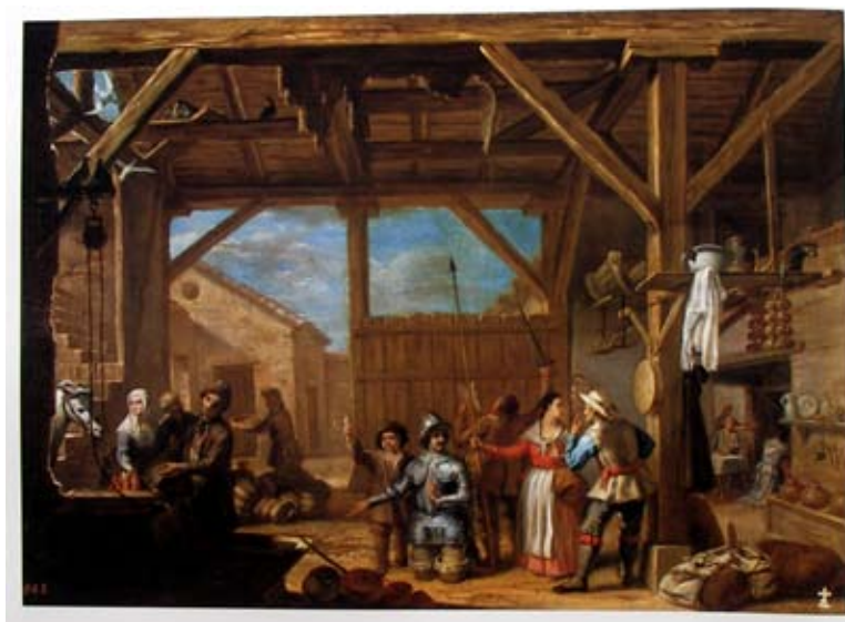
Lámina 14: Don Quijote es armado caballero (I, cap. 3); por Cristóbal Valero Iriarte (h 1720)

El pintor aragonés Cristóbal Valero Iriarte dedicó varios cuadros a representar diferentes aventuras del Quijote , todas ellas, en unos grandes espacios, en los que los detalles del interior de las ventas destacan por su preciosismo. Este episodio no dejó de ser pintado por él, en un cuadro actualmente conservado en el Museo del Prado, en que la escena ha ganado en costumbrismo lo que ha perdido en efectividad cómica [lámina 14].