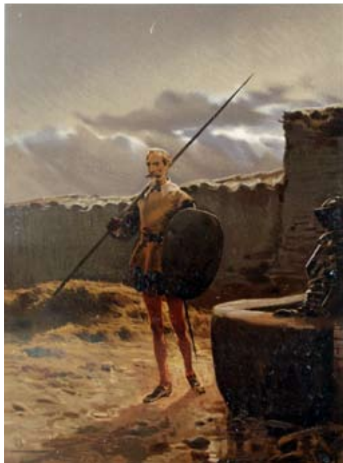
Lámina 36: Don Quijote vela las armas (I, cap. 3): por Ricardo Balaca (Barcelona, 1880).