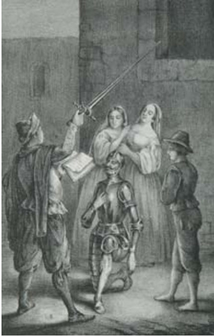
Lámina 19: Don Quijote es armado caballero (I, cap. 3): Litografía de Massen y Decaen (México, 1842).