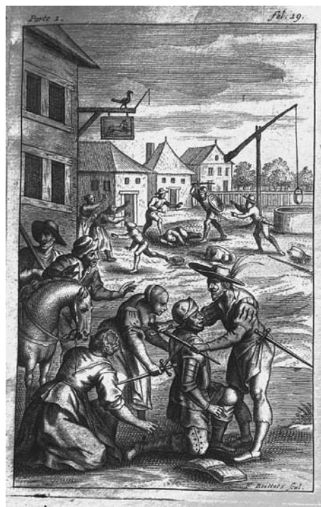
Lámina 10: Don Quijote es armado caballero (I, cap. 3): F. Bouttats por dibujo anónimo (Amberes, 1673).