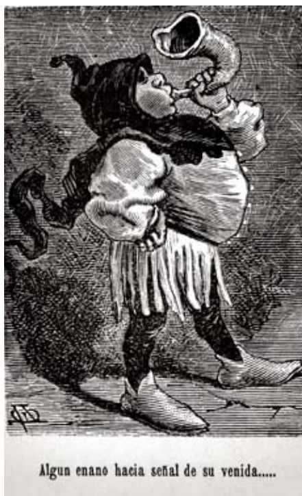
Lámina 2: El enano que toca su cuerno (I, cap. 2): F. Fusté, por dibujo de Apeles Mestres (Barcelona, 1879).

Y como a nuestro aventurero todo cuanto pensaba, veía o imaginaba le parecía ser hecho y pasar al modo de lo que había leído, luego que vio la venta se le representó que era un castillo con sus cuatro torres y chapiteles de luciente plata, sin faltarle su puente levadiza y honda cava, con todos aquellos adherentes que semejantes castillos se pintan (I, Cáp. 2, p. 52).