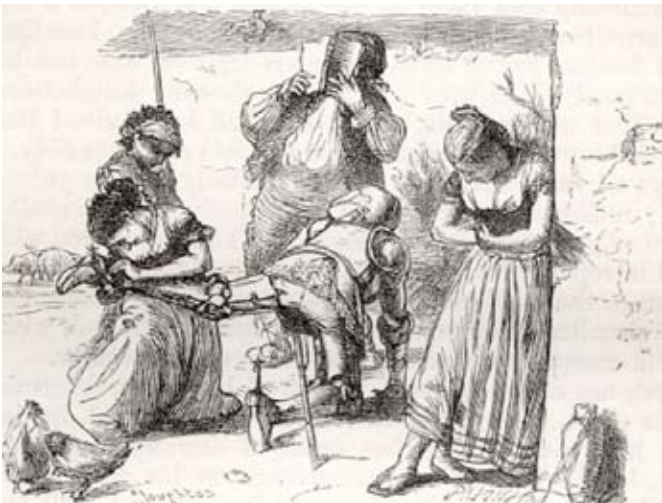
Lámina 33: Don Quijote es armado caballero (I, cap. 3): por Houghton (Londres, 1866).