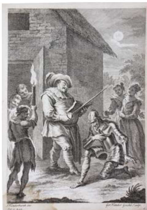
Lámina 16: Don Quijote es armado caballero (I, cap. 3): G. Vandergucht, por dibujo de J. Vanderbank (Londres, 1738).

Para ayudar a que estas nuevas ideas se difundieran, la edición de 1738 se llenó de estampas: con sus más de 60 imágenes, dibujadas en casi su totalidad por John Vanderbank, y grabadas, casi todas ellas, por Gerard Vandergucht, bien puede decirse que esta edición es una de las más lujosas de las que han tenido al texto cervantino como protagonista. Sólo hace falta mirar con atención la forma de representar el acto de investidura en esta edición para darnos cuenta de las nuevas lecturas, de las imprevisibles perspectivas que ahora se están defendiendo.