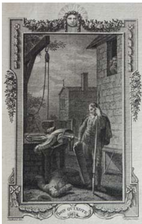
Lámina 26: Don Quijote ataca a uno de los arrieros (I, cap. 3): W. Angus, a partir de dibujo de Th. Stothard (Londres, 1782).