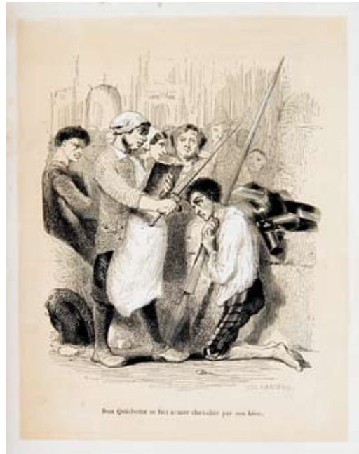
Lámina 20: Don Quijote es armado caballero (I, cap. 3): por Celestin Nanteuil (París, 1860).

barcelonesa de 1879 [lámina 21], o en esa maravillosa versión inglesa para niños ilustrada por Crane, en 1900, en que los personajes femeninos aguantan la risa, abriendo la brecha para una lectura menos seria, realizada ya desde la lectura de un libro universal, de un mito, de un clásico, que es el lugar que le corresponde al Quijote a principios del siglo XX [lámina 22].