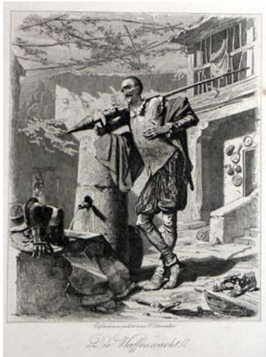
Lámina 35: Don Quijote vela las armas (I, cap. 3): Adolph Shrödter (Berlín, 1863).