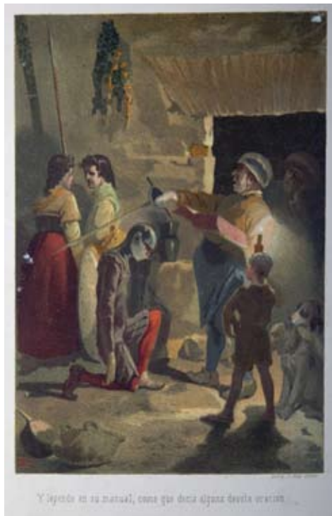
Lámina 21: Don Quijote es armado caballero (I, cap. 3): por Apeles Mestres (Barcelona, 1879).