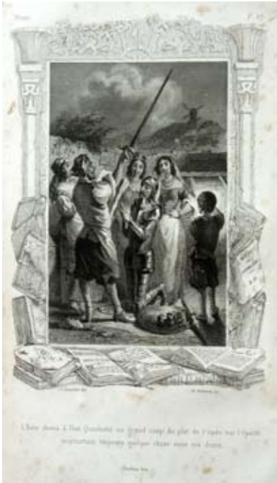
Lámina 31: Don Quijote es armado caballero (I, cap. 3): por Grandville (Tours, 1848)