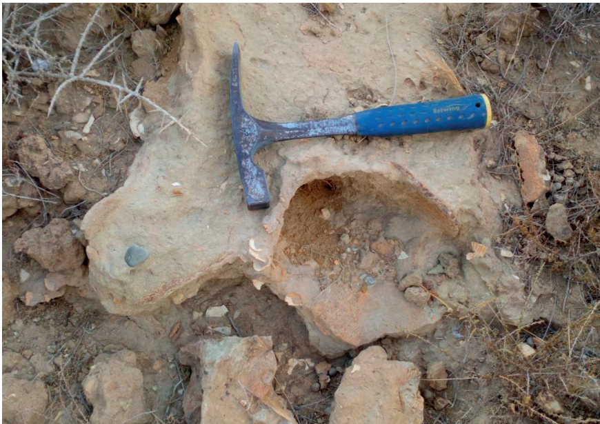
Figura 3. Evidencias de expolio en restos de vertebrados en el yacimiento de Lomillas de Juan Úbeda. Se aprecia un contramolde de una vértebra de ballena junto con esquirlas de hueso debidas a la extracción sin las medidas de protección necesarias.

En la actualidad el yacimiento se encuentra a merced de la práctica de actividades deportivas no controladas como enduro y trial con motocicletas, a lo que debe sumarse el expolio de elementos fósiles de gran tamaño (Fig. 3), por lo general relacionado con los restos fósiles de cetáceos, así como de elementos más pequeños que no se pueden cuantificar, como dientes de tiburón, bivalvos, gasterópodos, braquiópodos y un largo etcétera. Este riesgo de expolio se agrava debido a la cercanía de la ciudad de Almería y su fácil acceso por carretera.