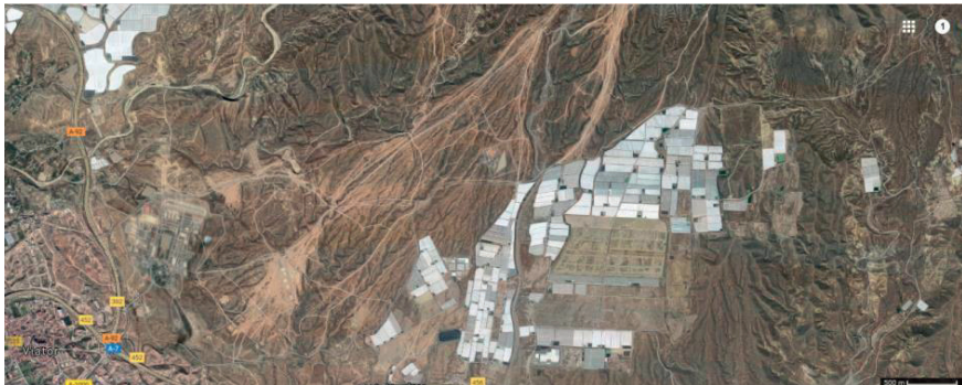
Figura 1. Vista general de la localización del yacimiento de Lomillas de Juan Úbeda, Almería.

El yacimiento de Lomillas de Juan Úbeda se encuentra localizado al Noreste de la ciudad de Almería, en el paraje de Lomillas de Juan Úbeda (Figura 1), con una altura de 300 metros sobre el nivel del mar. Este cerro presenta una gran concentración de invernaderos, así como solares donde se aprecian movimientos de tierra, alguna edificación dispersa y balsas de riego.