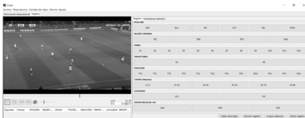
Figura 3. Instrumento LINCE v 1.1.

La toma de datos se realizó mediante el uso del software libre LINCE v 1.1. (Gabin, Camerino, Anguera y Castañer, 2012), que permite realizar el registro de categorías a la vez que se reproduce el vídeo del partido (Figura 3). A la derecha se sitúa el sistema notacional definido por el usuario, mientras que a la izquierda aparece la pantalla de vídeo y las diferentes botoneras creadas. Gracias a la posibilidad de exportar los datos al programa Excel, se facilita su posterior tratamiento en el software de análisis estadístico.