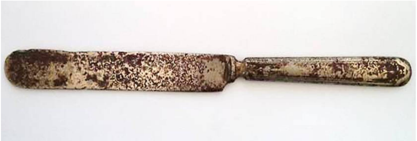
Figura 4. Cuchillo de plata de mantequilla encontrado en la hacienda cafetalera Fraternidad