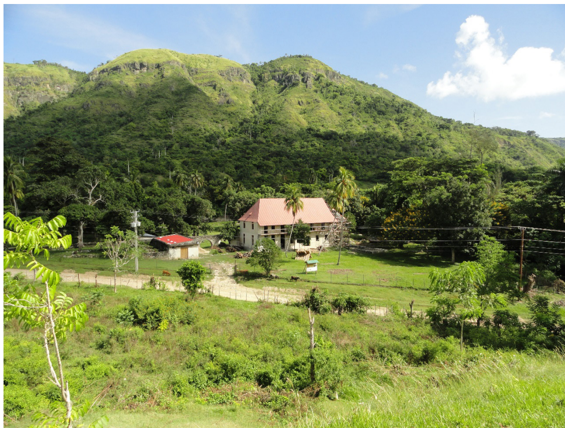
Figura 2. Vista de la hacienda cafetalera Fraternidad ubicada en el partido de Ramón de Las Yaguas