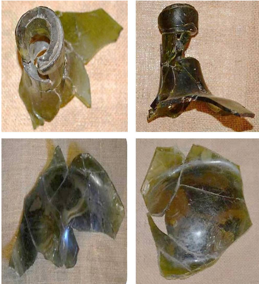
Figura 5. Fragmentos de Damajuana