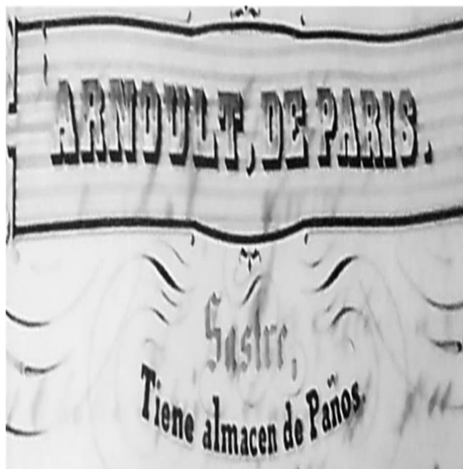
Figura 6. Recibo de la entrega de artículos de una sastrería