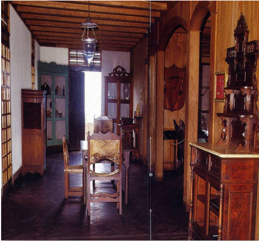
Figura 3. Imagen que muestra parte del estilo de vida francés