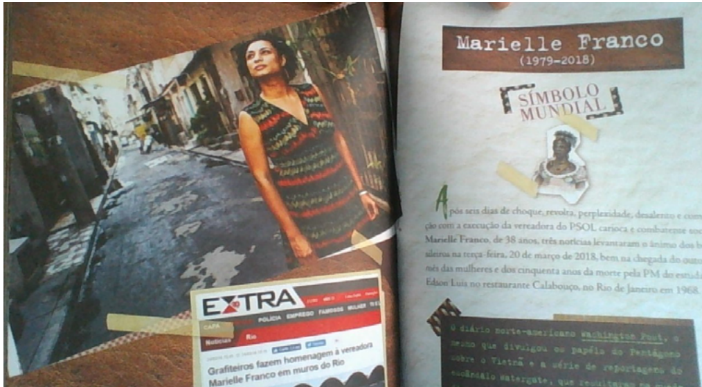
Figura 3: Marielle Franco: o assassinato do corpo não mata as ideias, outras mulheres virão por elas

Ao longo das enunciações, Palmério demonstra maestria analítica, o que garante a continuidade da leitura, estando sempre preocupado em manter a interação com o leitor e o tom crítico. A escolha léxico-semântica revela o sentido de indignação e de exaltação da força feminina no âmbito socioeconômico.