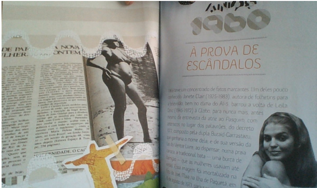
Figura 2: Leila Diniz enfrenta os poderosos: a emancipação do corpo feminino

Em “À prova de escândalos”, põem-se à vista desdobramentos da sobrevivência de Leila Diniz a episódios divulgados na mídia, com ecos na política relativos a família, censura e golpe. Diário não se exaure na análise do caso de Diniz e, nessa perspectiva, os aspectos de rebeldia e coragem se estendem em Rita Lee, Valentina Tereshkova e Luz Del Fuego; enquanto, no ano de 1967, a sociedade convive com a perseguição de educadoras do Rio de Janeiro e de São Paulo, em razão dos discursos sobre sexo nas escolas, e com a denúncia de Ligia Doutel sobre um projeto ambiental. Esses fatos são enunciados em posts com textos curtos e informativos, e há uma preocupação em alertar o leitor sobre problemas que se perpetuam na maioria das sociedades, mas são combatidos por mulheres audaciosas e comprometidas com a causa política. No mesmo percurso linguístico, outras figuras se destacam, como Thereza Goulart, Carmen da Silva, Maura Cançado, Elis Regina, Niomar Sodré e Hilda Hilst, a fim de construir mais uma página informativa.