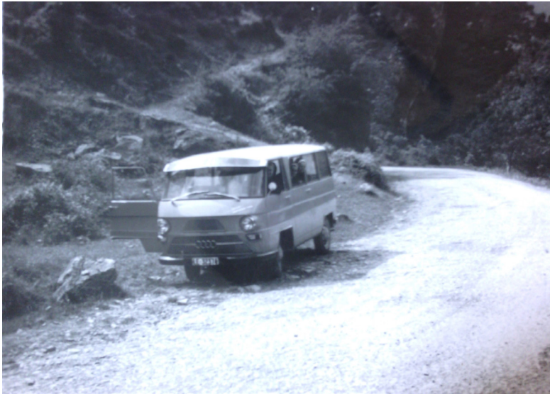
Figura 8: La primera van que compró la comunidad para llevar a las niñas y proveer servicios múltiples a la comunidad. La gente del lugar se sorprendió que las Religiosas condujeran la van dado que pocas mujeres tenían licencia de conducir y menos aún para conducir una van. Era el año 1964.

Después de haber narrado las raíces de las Religiosas fundadas por Barré y su vuelco en el siglo diecinueve hacia la creación de escuelas para las clases acomodadas, en nuestro caso, en España, nos concentramos ahora en el cambio ruptural que la provincia española experimentó en los «largos años sesenta» y, en particular, en la misión en Bembibre (Bruno-Jofré, 2016). Al mismo tiempo, indagamos la búsqueda transtemporal que emprendieron las Religiosas para entender su propio yo y su identidad colectiva, el carácter peculiar del apostolado en Bembibre y el giro dramático dejando el trabajo con los ricos y volcándose a un compromiso social muy temprano.