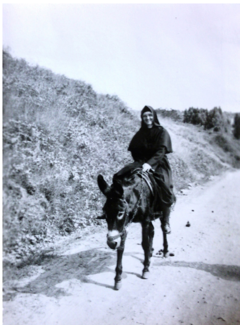
Figura 11: La fundadora de la misión en Bembibre y en Perú familiarizándose con la vida rural y de los pueblos en 1963.

Bembibre se habría de convertir en un escenario experimental viviente para los cambios que vendrían. La carta que convocó al Capítulo Extraordinario de 1968 de la congregación en su totalidad, expresaba que «su objetivo era revisar las constituciones para permitir a la congregación ser un testimonio vivo de Cristo en el mundo de hoy y trabajar de forma eficiente para el Reino de Dios» (Deleuze, 1967). Claramente, la Constitución pastoral sobre la Iglesia en el mundo actual ( Gaudium et Spes ) del Concilio Vaticano Segundo tuvo gran impacto en ésta y otras congregaciones.