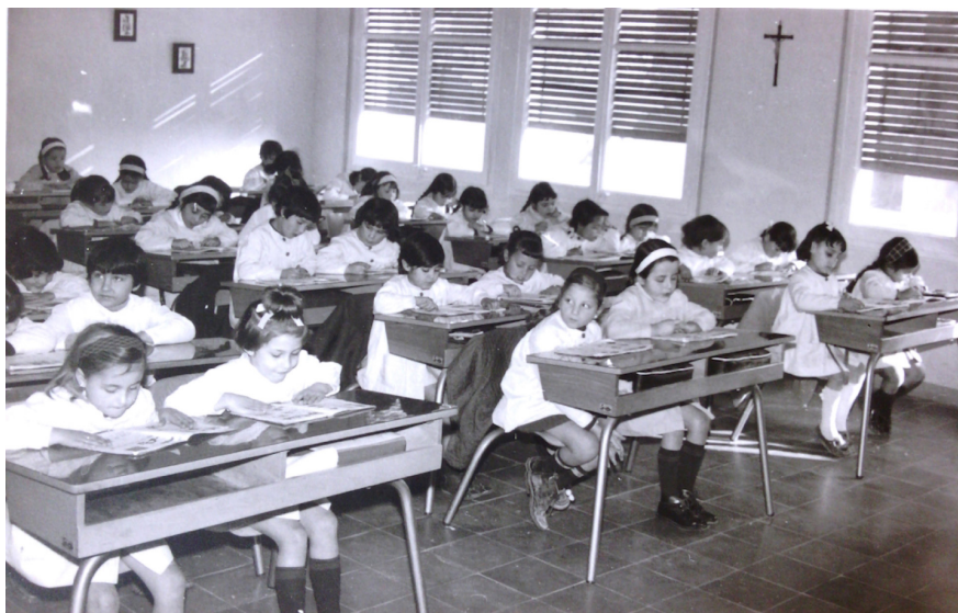
Figura 16: Clase en la primera escuela, 1964-1965.