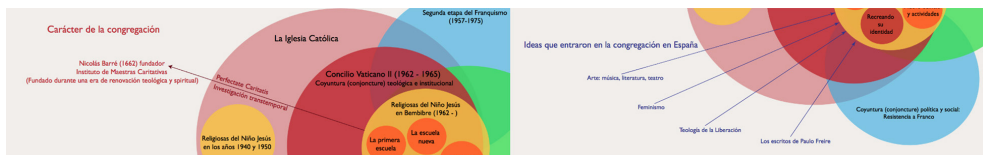
Figura 3: A la izquierda, vista de cerca de los elementos acerca del carácter de la congregación y su fundador, Nicolás Barré. A la derecha, vista de cerca de elementos del mapa identificando ideas que entraron a la congregación. Se puede hacer clic en cada una de estos rótulos para abrir una ventana con más información sobre el tema.

La visualización también expresa la idea de que las Religiosas en Bembibre desarrollaron su trabajo en gran parte inspiradas por la reconexión con el carácter original de la congregación (flecha y texto en rojo), junto con las influencias de ideas externas que entraron a la congregación (flechas y texto en azul). El decreto del Concilio Vaticano Segundo, Perfectae Caritatis , llamó a las congregaciones a retornar a la intención original del fundador/a, en el caso de las Religiosas del Niño Jesús, Nicolás Barré. Este viaje trans-temporal y el carácter internacional de la congregación facilitaron la entrada de nuevas ideas. Proveemos una ventana emergente sobre cada una de las ideas que aparecen en el mapa.