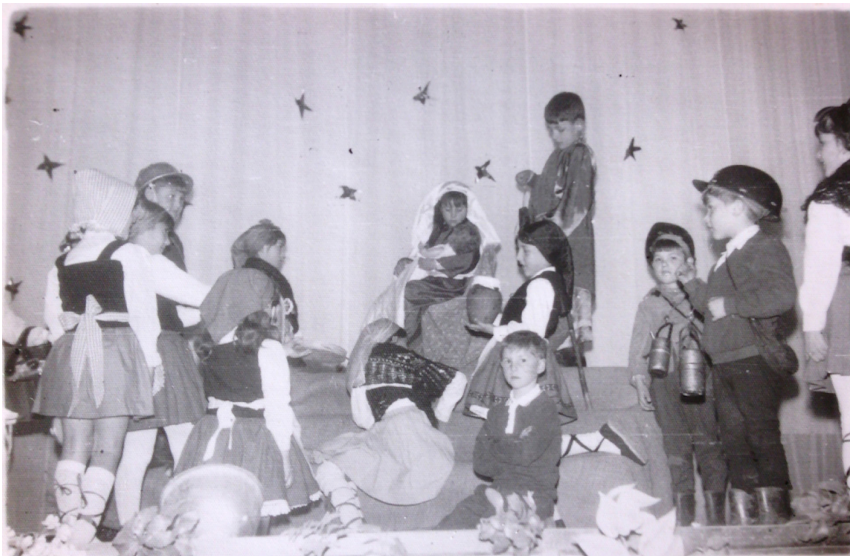
Figura15: 1967, Teatro Navideño.

Es evidente que las Religiosas adoptaron una noción de escuela popular en Bembibre y, si bien se ocuparon de pedagogizar la fe, estaban abiertas a todos y todas, y su intención era usar la educación para el bien público (común).