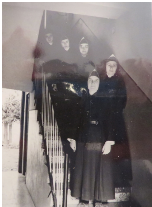
Figura 6: En las escaleras de la casa alquilada, 1964.

En el análisis, vamos a relacionar tres enfoques conceptuales: transtemporalidad (explorando los lazos espirituales y teológicos con el fundador, Barré), transnacionalidad (dado el carácter internacional de la congregación originariamente de Francia), y contextualización situando la congregación dentro de configuraciones históricas concéntricas y en coyunturas políticas, sociales, y religiosas (Pinar, 2011).