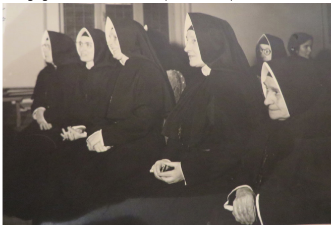
Figura 7: Hábito llamado gótico en 1956, fue la primera modificación.

Era una manera de circunscribir la decisión de la Iglesia de excluir a las mujeres del apostolado activo, tomada por el Concilio de Trento (1545-1563) y los decretos de Pío V de mediados del siglo XVI que estaban todavía en efecto en los siglos XVII y XVIII (Lux-Sterrit & Mangion, 2011). Se necesitaban religiosas sin clausura para instruir/educar y adoctrinar a los pobres en los principios Católicos después de las Reformas Protestantes. Se trataba de la educacionalización de la fe. La Iglesia Católica había comenzado a usar la educación como un medio para resolver problemas sociales y mantener la fé en la feligresía sin desviaciones; las escuelas tenían una fuerte función confesional. Los Jesuítas habían sido pioneros en centrar su ministerio en la educación en el siglo XVI y sus escuelas se expandieron en redes. El Catolicismo francés atravesaba en el siglo diecisiete un período de renovación teológica y espiritual, generando una coyuntura particular. Nicholás Barré, Jean Eudes, Vincent de Paul, Jean- Jacques Olier, Pierre de Bérulle, y Jean-Baptiste de La Salle, entre otros, vieron la necesidad de hacer algo para resolver los problemas sociales que los rodeaban (Bergin, 2014). Partiendo de los fundamentos iniciales de lo que se conocería como Iluminismo, Barré y De La Salle pusieron en moción principios en línea con lo que se considera una educación moderna. Sus ideas estaban contextualmente conectadas a las ideas del pedagogo Johan Comenius (1592-1670).