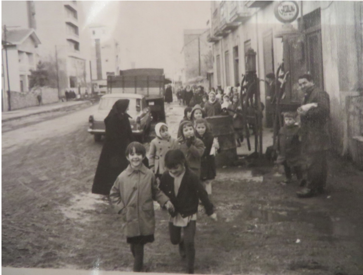
Figura 10: Casa vieja en Bembibre, alquilada, donde se abrió la primera escuela en la Avenida Villafranca. La congregación construyó un edificio nuevo en el que empezaron a dar clase en 1966, antes que se terminara. Los niños/as se reunían en la plaza y las Hermanas los llevaban a la escuela. Es una foto tomada como testimonio de la misión para su memorialización. Muestra el contraste con los Colegios de las grandes ciudades como Barcelona y Madrid. La foto no tiene fecha, pero es de los primeros años en Bembibre.

El Concilio, y en particular, su Declaración sobre la libertad religiosa, Dignitatis Humanae (1965), tuvo fuerte impacto en España, país sin libertad religiosa. Eventualmente, gracias a la presión ejercida por grupos políticos y civiles y el contexto de debates intensos, se promulgó la Ley Orgánica de Libertad Religiosa de 1967; ley que se hizo compatible con el estado confesional (Abbott, 1966, pp. 672-679).