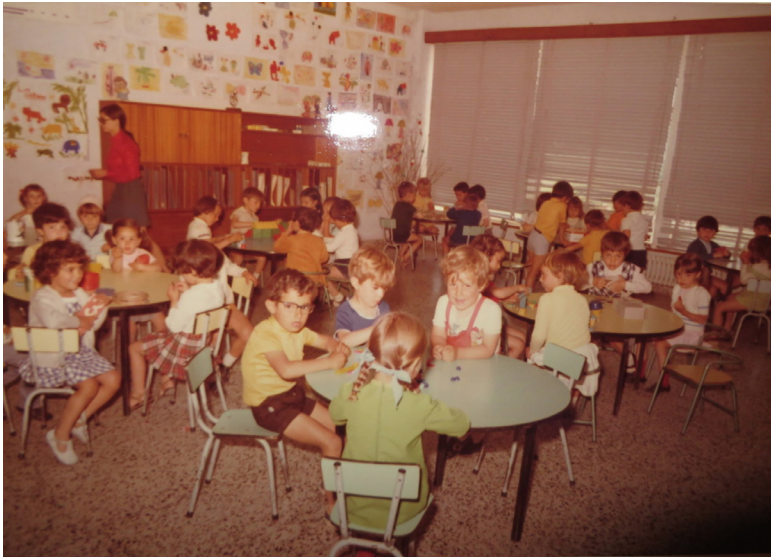
Figura 17: Kindergarten en 1970. Los niñas y niños tienen tres años.

Había también conexiones con las Hermandades Obreras de Acción Católica. Las Religiosas proporcionaron un espacio físico para las reuniones que tenía implicaciones políticas y sociales profundas. El contexto político era desafiante. Las Religiosas, así como miembros de la comunidad de Bembibre, tienen memorias de represión política, en particular en los años sesenta y los tempranos setenta. Sin embargo, las Religiosas usaron los espacios políticos y especialmente la Ley General de Educación de 1970 para recibir fondos para su escuela y para otros servicios tal como la residencia para niñas que vivían en zonas aledañas.