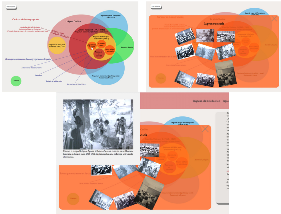
Figura 2: Ilustración de las interacciones de un usuario con este trabajo. Arriba a la izquierda: el usuario selecciona la sección «La primera escuela». Arriba a la derecha: se abre la ventana «La primera escuela» que muestra una colección de fotografías. Abajo: al hacer clic en una de las imágenes, se abre esa imagen en una nueva ventana junto con un título descriptivo.

La visualización también expresa la idea de que las Religiosas en Bembibre desarrollaron su trabajo en gran parte inspiradas por la reconexión con el carácter original de la congregación (flecha y texto en rojo), junto con las influencias de ideas externas que entraron a la congregación (flechas y texto en azul). El decreto del Concilio Vaticano Segundo, Perfectae Caritatis , llamó a las congregaciones a retornar a la intención original del fundador/a, en el caso de las Religiosas del Niño Jesús, Nicolás Barré. Este viaje trans-temporal y el carácter internacional de la congregación facilitaron la entrada de nuevas ideas. Proveemos una ventana emergente sobre cada una de las ideas que aparecen en el mapa.