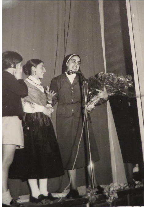
Figura 14: Premios a estudiantes al fin del año escolar 1967-1968. Las estudiantes están vestidas de Bercianas y la Religiosa tiene un hábito modificado.

Es evidente que las Religiosas adoptaron una noción de escuela popular en Bembibre y, si bien se ocuparon de pedagogizar la fe, estaban abiertas a todos y todas, y su intención era usar la educación para el bien público (común).