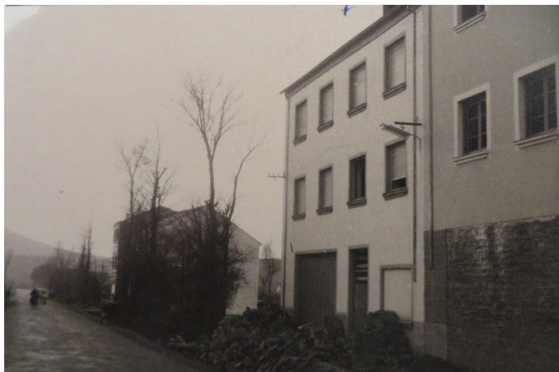
Figura 5: Calle de Bembibre en los años sesenta

En el análisis, vamos a relacionar tres enfoques conceptuales: transtemporalidad (explorando los lazos espirituales y teológicos con el fundador, Barré), transnacionalidad (dado el carácter internacional de la congregación originariamente de Francia), y contextualización situando la congregación dentro de configuraciones históricas concéntricas y en coyunturas políticas, sociales, y religiosas (Pinar, 2011).