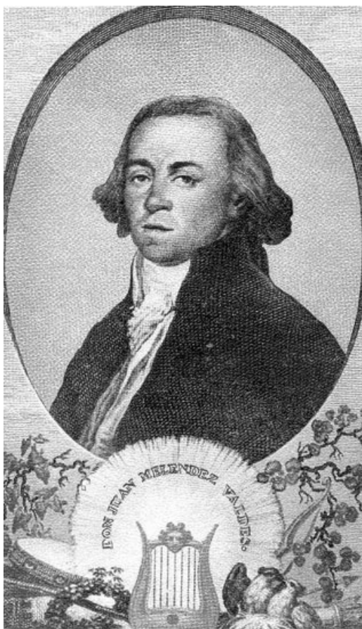
Retrato de Juan Meléndez Valdés.

Casi todos los escritos de Quintana sobre el compositor de Ribera del Fresno fueron recogidos en el tomo diecinueve de la Biblioteca de Autores Españoles al que antes nos hemos referido. 194 Aquí, en concreto, figuran los siguientes capítulos que se dedican a Meléndez, o en los que se incluyen páginas sobre Meléndez: “Sobre la poesía castellana del siglo XVIII” (pp. 145-157), “Meléndez Valdés” y “Noticia histórica y literaria de Meléndez” (107-121). En todos estos textos sobre el extremeño basamos nuestra investigación incluida en este artículo.