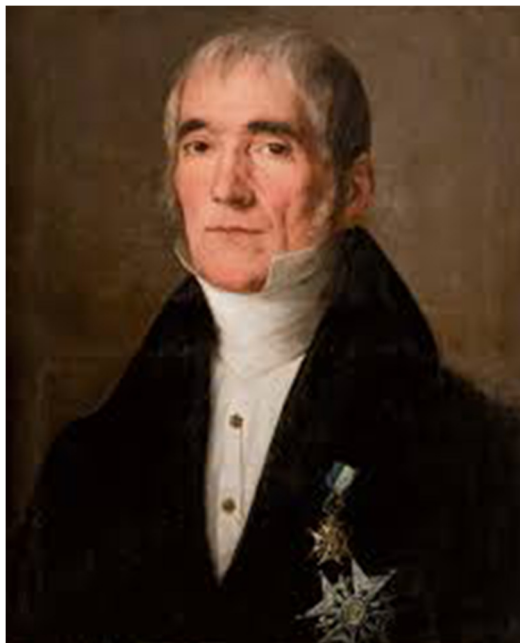
Antonio María Esquivel, Manuel José Quintana (1832)

En el presente trabajo nos vamos a ocupar de uno de los creadores abordados por Manuel José Quintana en las páginas de sus obras dedicadas a crítica e historia literaria, a su amigo, a quien consideraba su maestro, el extremeño, natural de Ribera del Fresno (Badajoz), Juan Meléndez Valdés.