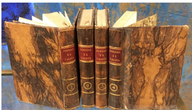
Los cuatro tomos de Poesías de Juan Meléndez Valdés, preparadas por Manuel José Quintana (Madrid, Imprenta Nacional, 1820)

En sus “NOTAS” “ Sobre el texto seguido en las poesías de Meléndez ” Quintana explica y justifica los criterios que utilizó para preparar su selección de las obras del autor extremeño ubicadas entre las páginas 193 y 307 de este mismo volumen cuarto de sus Poesías selectas castellanas , y para elegir y depurar los textos que allí se incluyen. Intenta mostrarse como un crítico imparcial, a pesar de las relaciones personales que le unieron al creador de Ribera del Fresno, y del gran cariño y admiración que, evidentemente, a éste profesaba. Muestra grandes ansias de hacer gala de un gran rigor filológico, y un patente deseo de dar a conocer las lecturas de los poemas que estuviesen revestidas de una mayor calidad. Explica que, como criterio generalizado, tomó como base las versiones más antiguas de las obras, por juzgar peores muchas de las enmiendas introducidas en ellas por el propio Meléndez en diversas etapas de su biografía, y, en especial, en los últimos años de su vida, cuando se hallaba preparando la última recopilación de su producción que quería entregar a las prensas.