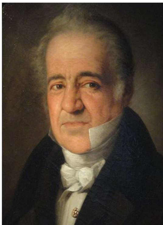
Manuel José Quintana, taller de Vicente López (1830).