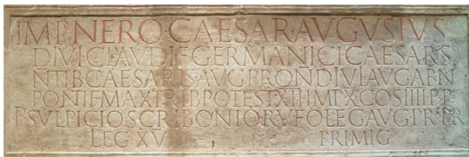
Figura 1. Inscripción dedicada a Nerón (Colonia)

Imp(erator) Nero Caesar Augustus / divi Claudi f(ilius) Germanici Caesaris / n(e)pos Tib(eri) Caesaris Aug(usti) pron(e)pos divi Aug(usti) abn(e)pos / pontif(ex) max(imus) trib(unicia) potest(ate) XII imp(erator) X co(n)s(ul) IIII p(ater) p(at)riae / P(ublio) Sulpicio Scribonio Rufo leg(ato) Aug(usti) pro pr(a)etore / leg(io) XV Primig(enia) 4 .