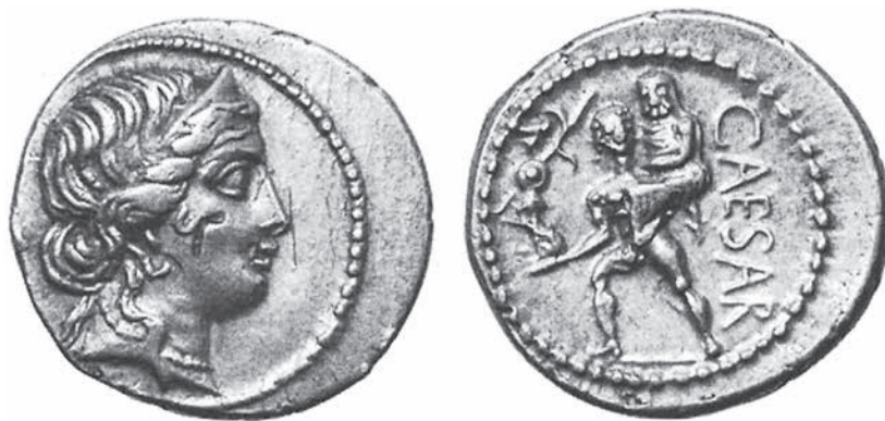
Figura 2. Denario mostrando a Julio César como descendiente de Eneas