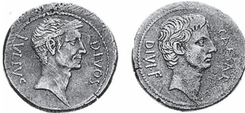
Figura 4. Bronce mostrando a Julio César divinizado y a César Octaviano como su hijo

Además organizó rápidamente su culto y construyó en Roma un templo dedicado a su memoria, que aparece en el reverso de la segunda pieza 17 , en el frontón lo indica claramente (DIVO IVL), y dentro se aprecia la estatua de Julio César sosteniendo un lituo, a uno de los lados aparece el altar y en lo alto del templo la estrella de