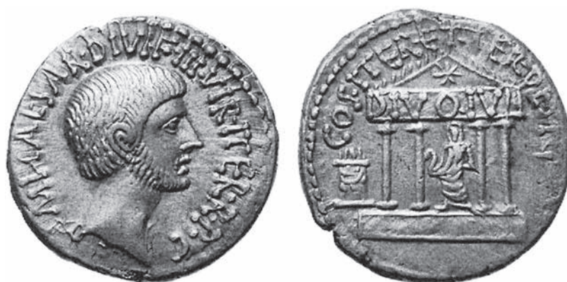
Figura 5. Denario mostrando el templo dedicado al divinizado Julio César

divinización, modelo que serviría para el posterior culto imperial. En el anverso de esta pieza aparece Octavio con una larga leyenda que muestra la evolución de su poder: IMP CAESAR DIVI F III VIR ITER RPC (Imperator, Triunviro Rei Publica Constituenda de nuevo) COS ITER ET TER DESIG (cónsul en dos ocasiones y designado para una tercera) (figura n.º 5).