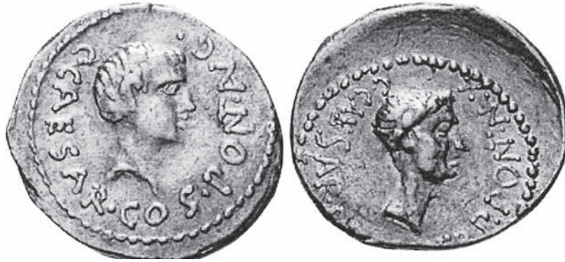
Figura 3. Aureo que muestra a César Octaviano como hijo de César

moneda 16 , donde aparecen los retratos de ambos y los nuevos nombres oficiales de ambos (figura n.º 4).