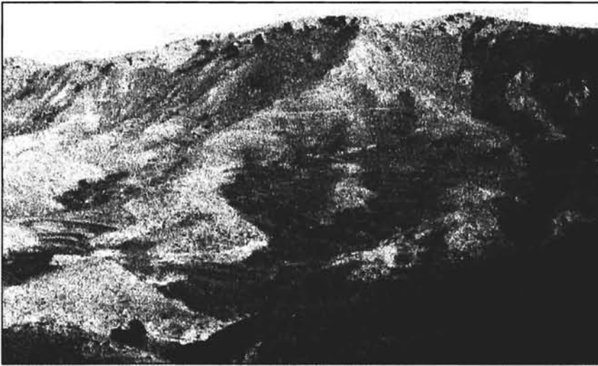
Foto 4.- Repoblaciones año 1950/51. MUP 79bis Murcia