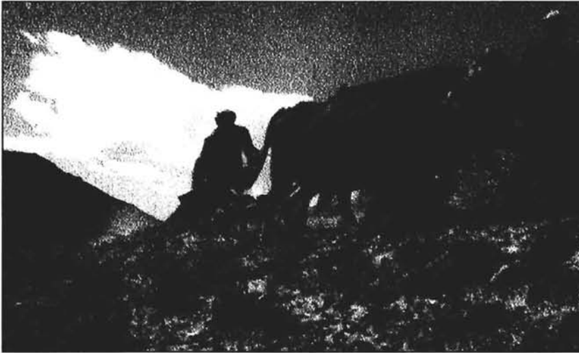
Foto 2.- Aterrazando con bueyes. Almería 1957