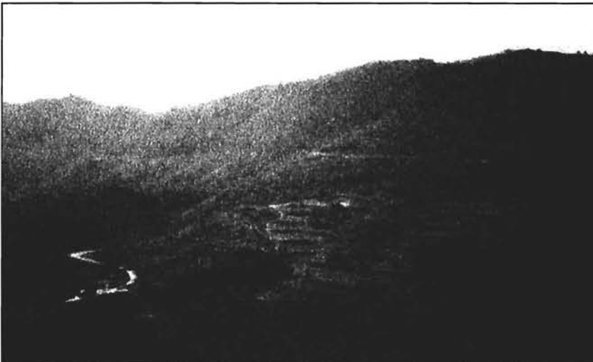
Foto 5.- Mismas repoblaciones en el año 1997

ello menos interesante. Es la recreación de la secuencia temporal de las fotos, realizando instantáneas de la zona fotografiada, viendo el antes y después, pudiendo tener elementos para juzgar con una visión retrospectiva, lo que en otros momentos quizá fuera criticado.