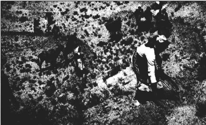
Foto 3.- Plantación de chumberas. Almería 1957

recopilar y difundir todas las fotografías antiguas y menos antiguas sobre los trabajos forestales sirviendo de material de apoyo, para estudios de paisaje, de evolución forestal, o simplemente para que quede como un mudo testigo de lo que unos trabajos, quizá criticados en su momento, han sido capaces de lograr.