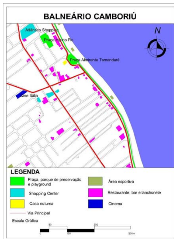
Figura 6: Infraestructura recreativa del Área Central de Balneario Camboriú

En Balneario Camboriú estos espacios se dispersan en la Barra Sur, la costanera central de la playa, las dos calles siguientes, y las Avenidas Atlântica y Brasil (Figuras 6 y 7). Parte de la infraestructura de estos lugares coincide con parques y plazas, y se relacionan con el río y el mar, lugares de gran circulación y de alta densidad. El área de mayor concentración de bares y restaurantes se ubica cerca de las plazas Tamandaré y Higino Pio, y de los shoppings centers .