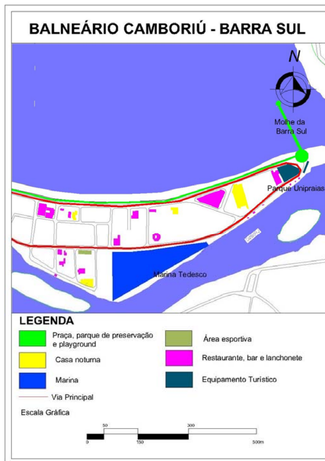
Figura 7: Infraestructura recreativa de la Barra Sur en Balneario Camboriu