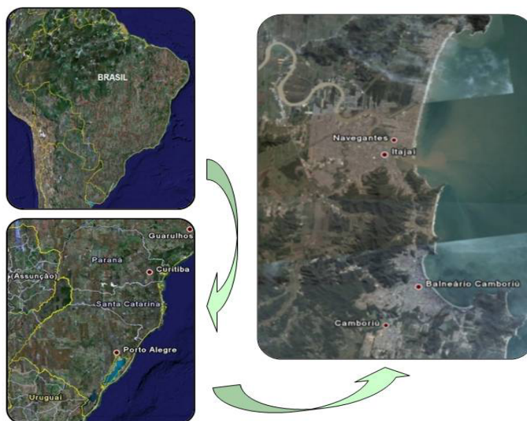
Figura 3: Localización del conglomerado Itajaí/Balneário Camboriú

Organización: Lina Juliana Tavares Viana (2008)