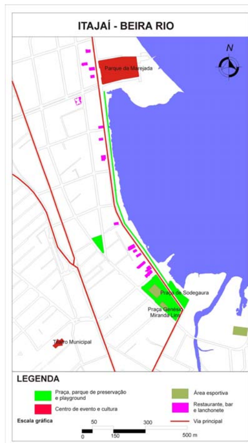
Figura 5: Infraestructura recreativa de Beira Rio - Itajaí