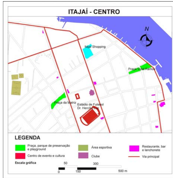
Figura 4: Infraestructura recreativa del área central de Itajaí