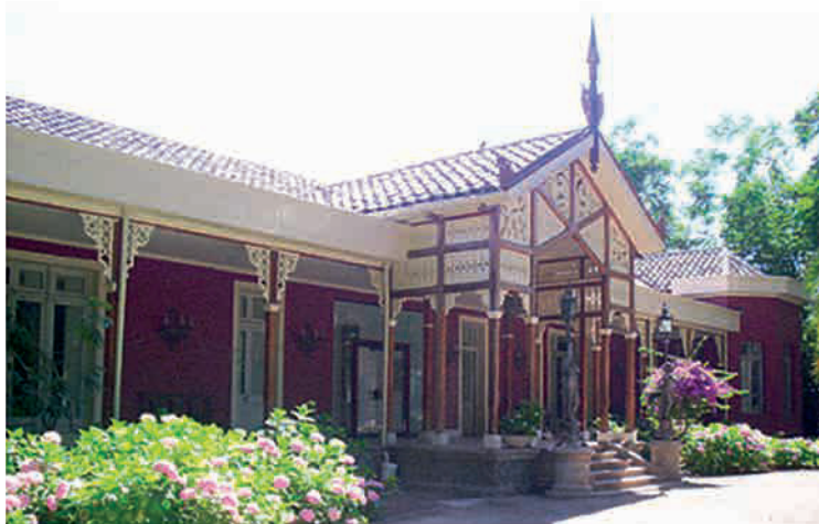
Hacienda Parque García de la Huerta en San Bernardo (Chile)