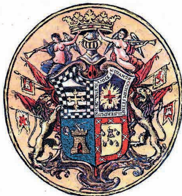
Armas del I Virrey del Rio de la Plata, Pedro de Ceballos y Cortés.

https://heraldicaargentina.blogspot.com.es/2013/06/escudo-de-pedro-de-cevallos.html