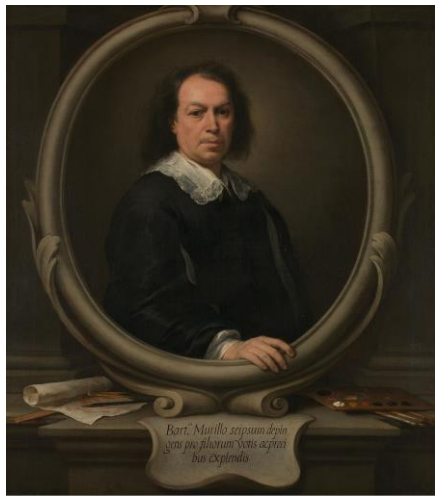
Fig. 1: Bartolomé Esteban Murillo, Autorretrato