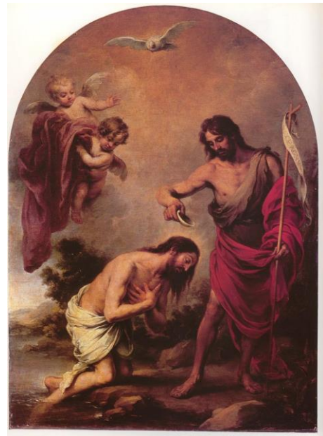
Fig. 2: Murillo, Bautismo de Cristo , catedral de Sevilla