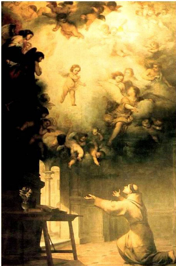
Fig. 3: Murillo, Visión de San Antonio , catedral de Sevilla