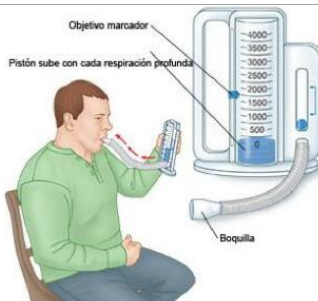
Figura 3. Manejo del espirómetro incentivo.