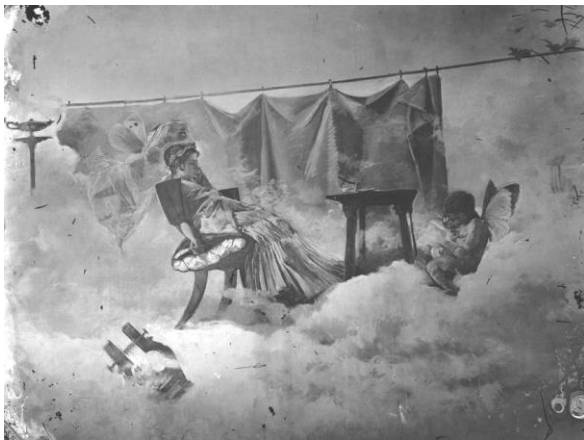
Figura 4. La alegoría del Café . Lienzo pintado por Emilio Sala para el techo del café de Fornos de Madrid, fotografía por J. Laurent y Cía. Fuente: Ruiz Vernacci (Instituto del Patrimonio Cultural de España, Ministerio de Educación, Cultura y Deporte).