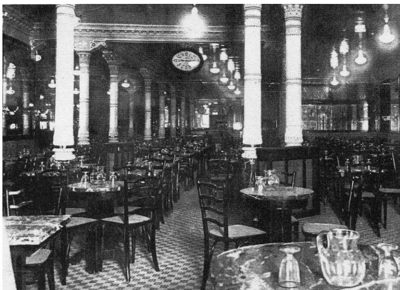
Fig. 7. Vista parcial del interior del café Riesgo , 1928.