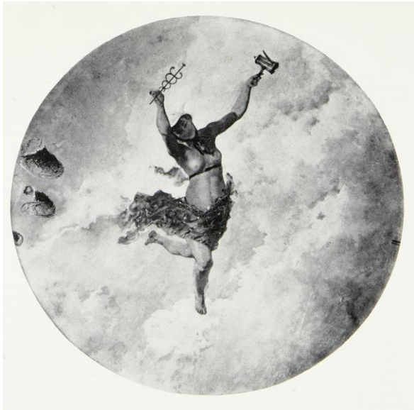
Fig. 3. Figura de Mercurio para la decoración del café de Fornos , por Emilio Sala Francés, 1879.

tado, o más bien acurrucado en la nube que forman los vapores que se elevan de la tierra al amanecer un travieso geniecillo o putti le vierte café en el tintero, mientras que otro, envuelto en tules y con alas de pensamiento, viene a traerle esa inspiración que se siente en las primeras horas de la mañana, después de haber pasado la noche en vela. La lámpara que había ardido toda la noche se apaga a la primera claridad del alba. Al mismo tiempo, sobre el barrote que sostiene una cortina, viene a posarse un grupo de pájaros, cuyo plumaje está aún húmedo por el rocío de la madrugada ( La Unión , 1879: 1-2).