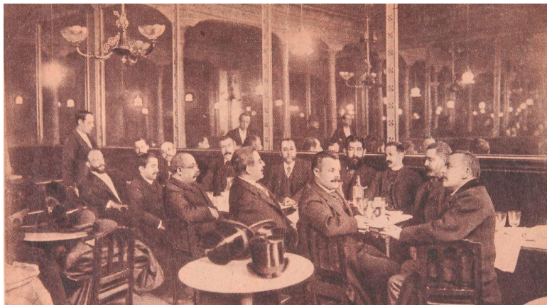
Fig. 6. Tertulia literaria en el café de Fornos , Madrid.

dros y, en concreto, de artistas como Jaime Morera, Eliseo Meifrén y José Lupiáñez (Romano, 1928: 17).