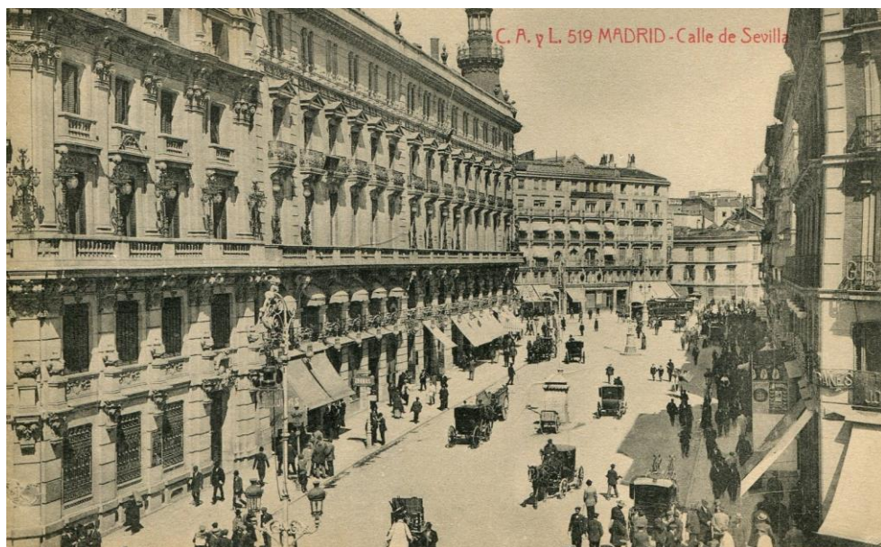
Figura 1. Vista parcial de la calle de Sevilla y al fondo se aprecia la calle de Alcalá y el edificio del café de Fornos (con toldo), angular con la calle de los Peligros, hacia 1920.

El Fornos (sito en la calle de Alcalá esquina con la de la Virgen de los Peligros, casi medianero con el edificio de la Aduana) fue inaugurado el 20 de julio de 1870 por los hermanos Manuel y Carlos Fornos, y un día después se abrió al público ( Diario Oficial de Avisos de Madrid , 1870: 4). Su inmueble fue proyectado por el arquitecto cántabro Jerónimo de la Gándara y se convirtió en uno de los más distinguidos y monumentales de la calle de Alcalá (Cabello, 1933: 15) (Fig. 1). Su nombre va unido al del desaparecido convento de Nuestra Señora de la Piedad (conocido como de las Vallecas) 12 , dado que sobre sus solares se levantaron la casa de este café y del restaurant de los Cisnes . Antes de su construcción, este terreno albergó un barracón improvisado en el que se celebraron exposiciones de pintura como la que tuvo lugar en 1864, y en la que se exhibieron dos cuadros del artista valenciano Salvador Martínez Cubells (titulados El baile y Visita del novio ), entre otras obras ( La Ilustración Moderna , 1892: 108).