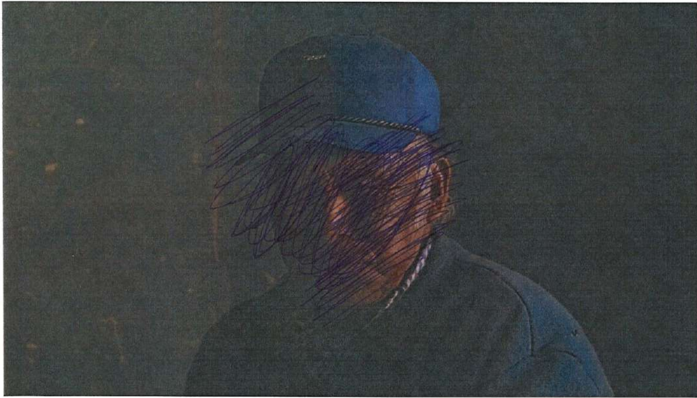
Video 3 (fotograma 94) https://vimeo.com/308294346