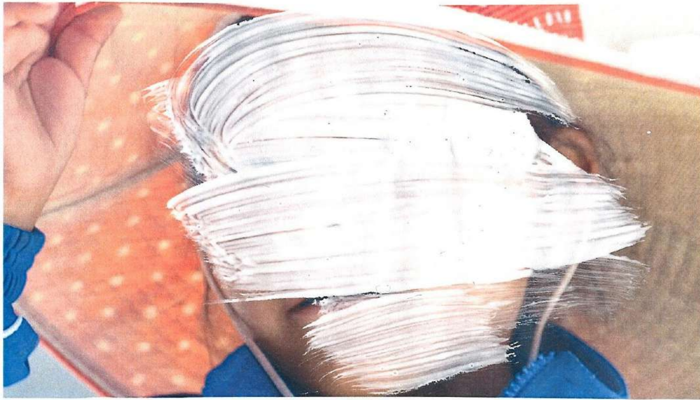
Video 2 (fotograma 109) https://vimeo.com/308294147

censura, la distancia de las necesidades verdaderas de los Chipaya, la opacidad de su reconocimiento como autónomos .