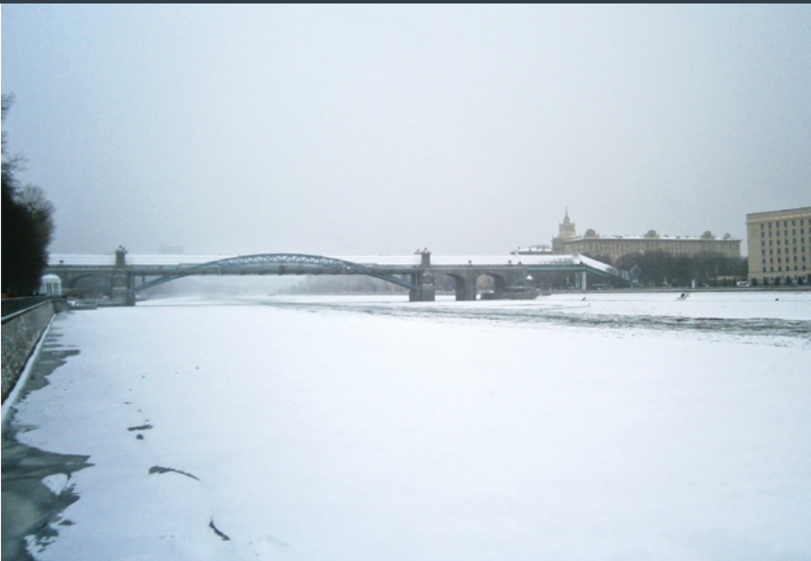
El río congelado