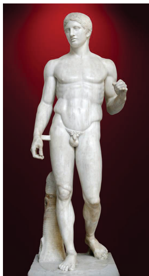
Figura 1. Policleito, Doriforo , copia romana en mármol de original griego en bronce (ca.440 a.C.), Museo Arqueológico de Nápoles. Ejemplo de escultura en contrapposto .