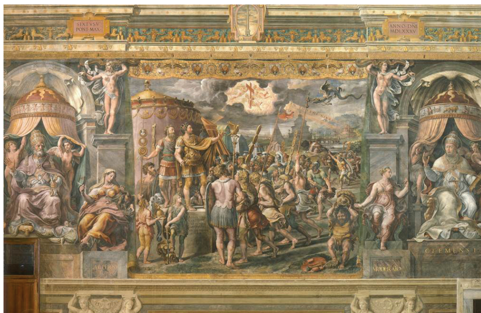
Figura 6. Taller de Rafael y Giulio Romano, La aparición de la Cruz , fresco, 1520-24, Sala de Constantino, Apartamentos papales, Vaticano.