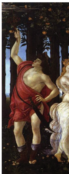
Figura 2. Sandro Botticelli, Detalle de «Mercurio» en La Primavera , témpera sobre tabla, ca.1482, Uffizi, Florencia.