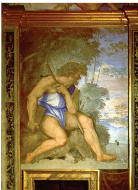
Figura 4. Sebastiano del Piombo, Polifemo , fresco, 1511, Villa Farnesina, Roma.