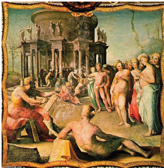
Figura 7. Domenico Beccafumi, Zeuxis y sus modelos, fresco, 1519-23, Palazzo Venturi, Siena. Fuente de la imagen: https://www.wga.hu/html_m/b/beccafum/1/06ventur.html