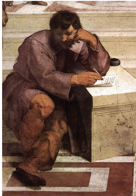
Figura 9. Rafael, Detalle del «Retrato de Miguelangel/Heráclito» en la Escuela de Atenas , fresco, 1508-12, Stanza della Segnatura, Apartamentos papales, Vaticano.