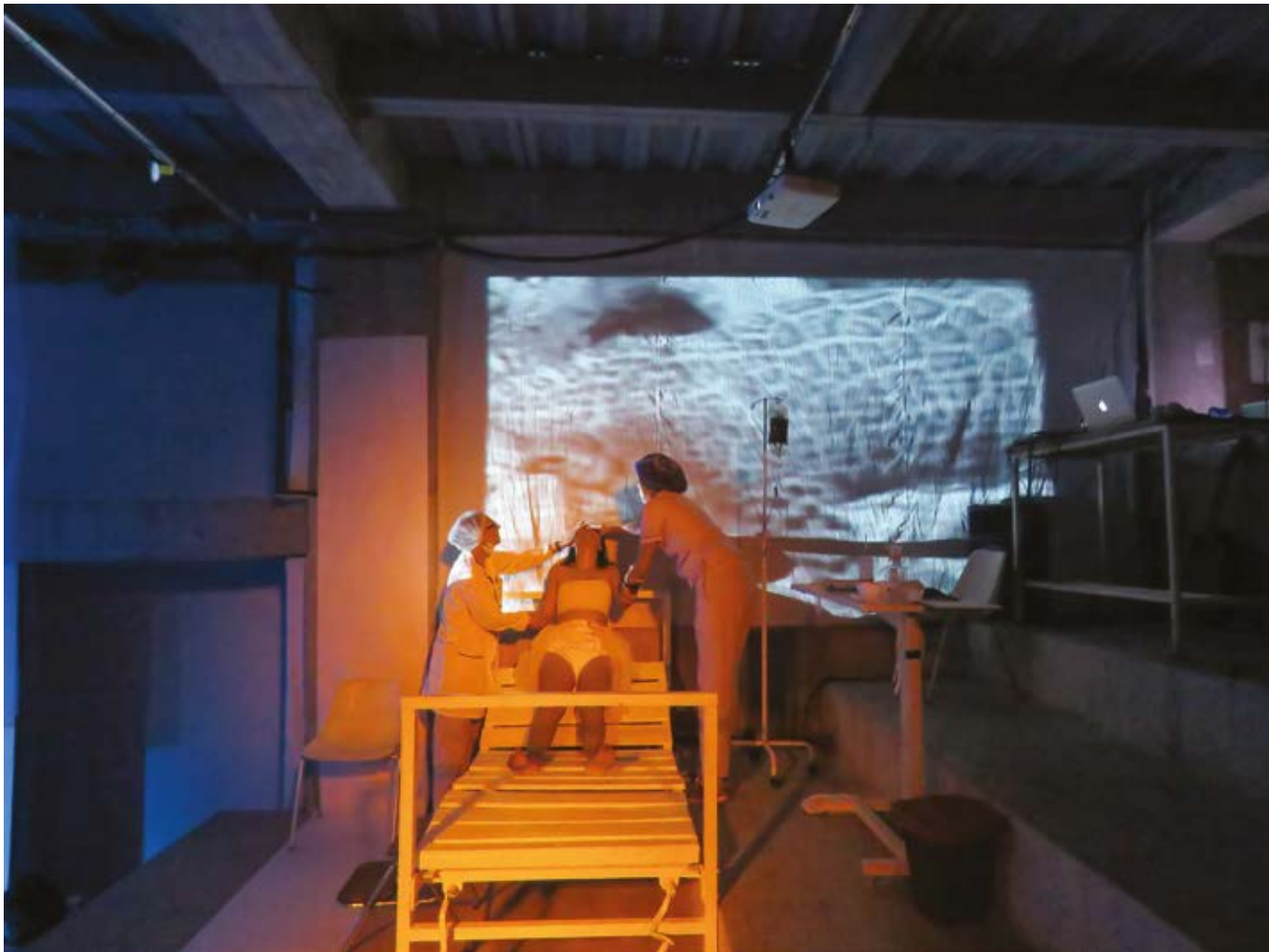
Imagen 9. Relación cuerpo, vídeo, mapping .

pedazos de los cuerpos rotos, que son la metáfora de la nación. Una pierna, una cabeza, un brazo, un dedo, un torso: hallazgos recurrentes, como registros de un sistema perverso que aniquila a sus ciudadanos para instaurar el silencio, para comprar el miedo y fortalecer el poder. No es una guerra declarada, son apenas los números de una ecuación que infarta las estadísticas, y que moldean una insensibilidad cultural, pretextos de un control más amplio de un poder que nunca define sus fronteras ni aplaca su hambre.