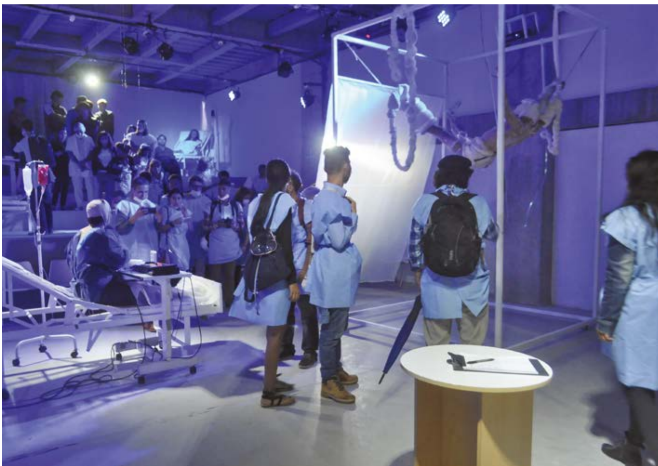
Imagen 8. Acción performática "El Fajadito".

culmina, como cuando canta en entresueños con Liza Minelly "Life is a cabaret":