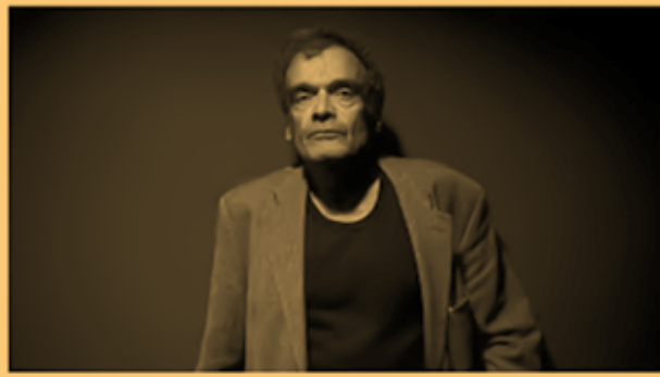
An Interview with Harun Farocki • Senses of Cine... sensesofcinema.com