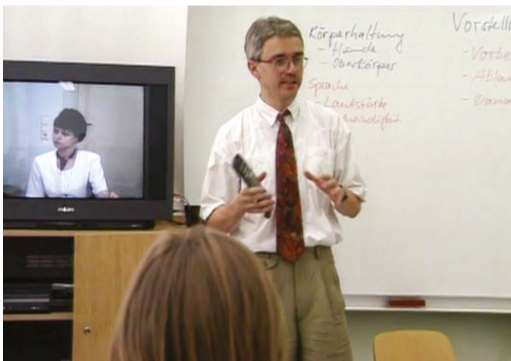
Imagen 3. "The Interview", Harun Farocki, (1997).

Es cierto que, mediante el conjunto de estas operaciones, la audiencia queda sin opción a una mirada empática respecto de lo que ve. Pero, lo verdaderamente relevante aquí es, sin embargo, que cada uno de los procedimientos técnicos y estéticos señalados posee su «reflejo político». Ampliando lo dicho con la filosofía de Foucault, especialmente con su libro Vigilar y Castigar , resulta importante señalar la idea de que las relaciones de poder se componen con el saber . Para visualizar este aspecto en la película, el rol de los instructores es fundamental. Quizá por eso, Farocki no descuida en ningún momento el modo en que estos monitores actúan e influyen —muy humanamente , por cierto— sobre quienes reciben la instrucción. Como vemos, de comienzo a fin a través de las imágenes y las conversaciones, son saberes convencionales que tienen que ver con la efectividad y la estrategia comunicativa. Se trata de aprender las funciones formalizadas . Esto es, acciones que son entendidas en relación con su finalidad (Deleuze, 2014, p. 156, mi énfasis). La finalidad es justamente lo que Farocki mantiene en estado de latencia entre las imágenes de The Interview : el fin al que se aspira consiste meramente en el éxito en la