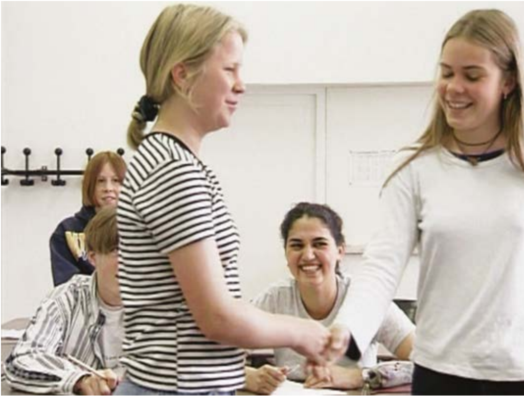
Imagen 4. "The Interview", Harun Farocki, (1997).

entrevista. 3 Este destino forzoso impregna íntegramente las conversaciones de un «tú debes» unidireccional. Lo cual delata, a su vez, la existencia de una ley moral que Farocki detecta, y yo diría que se burla de ella.