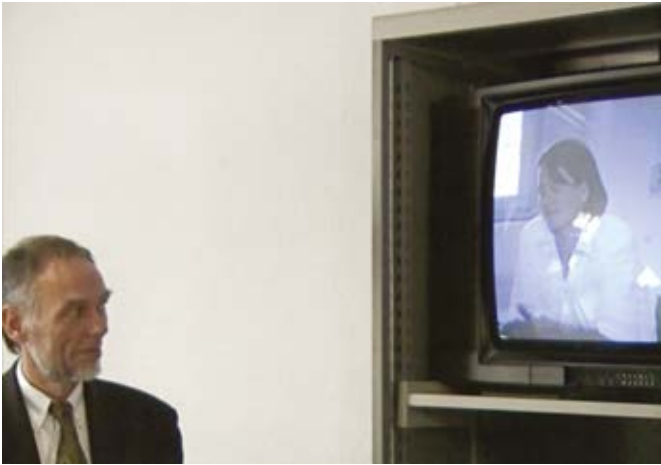
Imagen 2. "The Interview", Harun Farocki, (1997).

los mismos métodos de racionalización de los que se sirven los sectores militar e industrial para su desarrollo; los cuales, como diría Simone Weil, «se presentan como métodos de organización científica del trabajo» (Weil, 2014, p. 224).