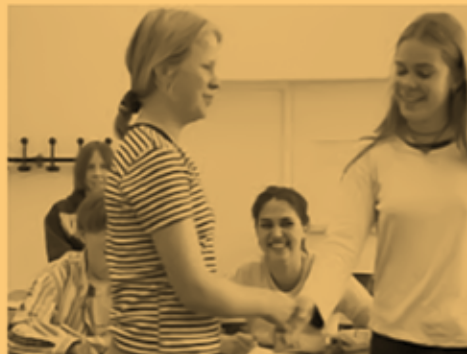
The Interview | Video Data Bank vdb.org