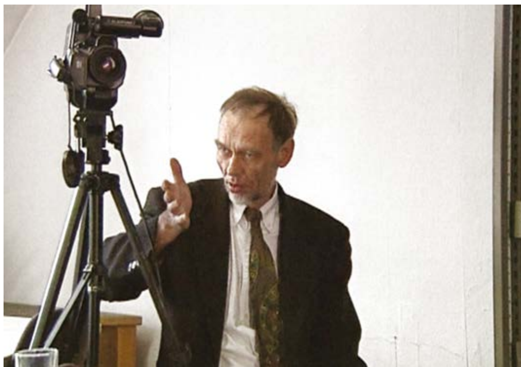
Imagen 1. "The Interview", Harun Farocki, (1997).