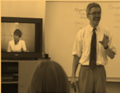
Where to begin with late filmmaker an... chicagoreader.com