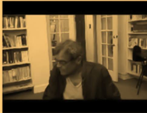
Harun Farocki Interview - YouTube youtube.com