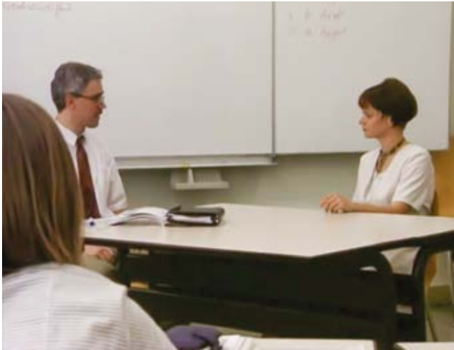
Imagen 6 y 7. "The Interview", Harun Farocki, (1997).