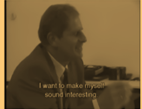
Harun Farocki | pietmondriaan.com pietmondriaan.com