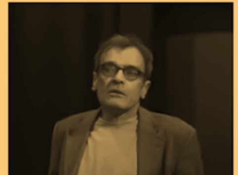
BBC Radio – Interview with Filmmak... thenoseinvestigates.wordpress.com