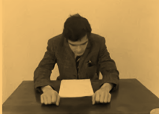
Harun Farocki: Serious games | Artlink Ma... artlink.com.au