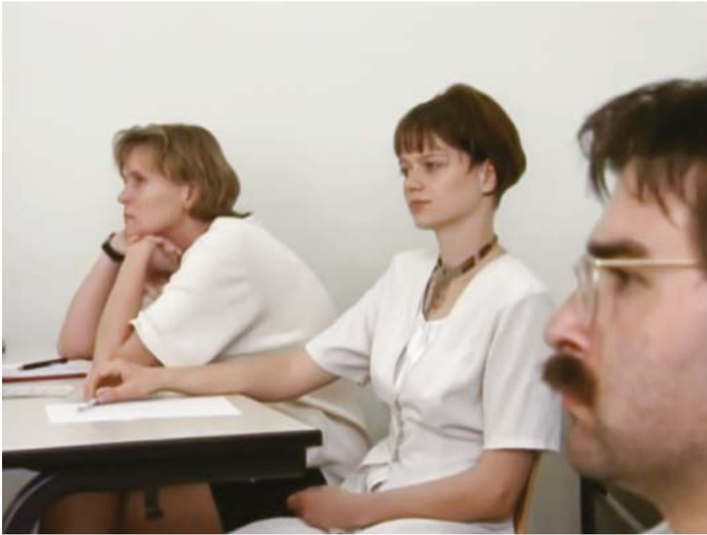
Imagen 5. "The Interview", Harun Farocki, (1997).

Vayamos por partes, en el apartado anterior me había referido a cómo lo mostrado en la imagen es recordado, de este modo, fragmentando los cuerpos que retrata. 5 Pero, precisamente Farocki —y la audiencia a través del filme— asiste a un ambiente social, con la implicación ineludible de un marco político 6 donde el aspirante al puesto de trabajo aparece limitado, como percibido a través de una plantilla donde se observan analíticamente solo las partes o aspectos que a priori se consideran relevantes. Esta plantilla, aplicada sobre cada aspirante, visibiliza unas cualidades personales, al tiempo que ensombrece u oculta otras. El aspirante debe por tanto hacerse encajar ; en otras palabras, está