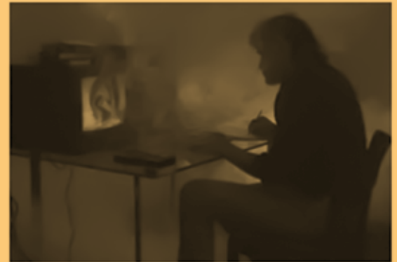
An Interview with Harun Farocki • Senses of... sensesofcinema.com