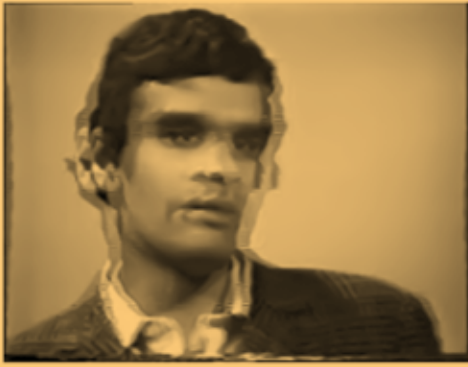
Art of the Interview: Harun Farocki – ... thenewinquiry.com