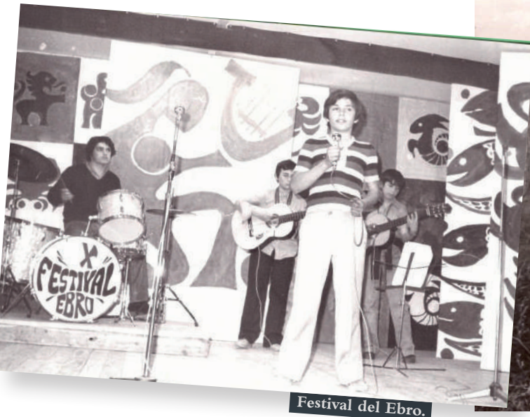
Festival del Ebro.