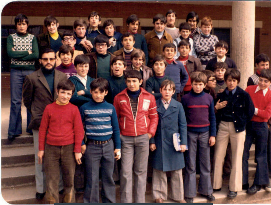
Alumnos becados por el Ministerio de Trabajo.

El número más importante de los alumnos internos fue enviado por el Ministerio de Trabajo, que becabá sus estudios, ropa, alojamiento y manutención. Eran hijos de trabajadores que habían sufrido accidentes de trabajo, enfermedades laborales (como la silicosis, propia de los mineros) o habían quedado en situación de orfandad, procedentes de Asturias, León, Palencia, Madrid y Zaragoza.