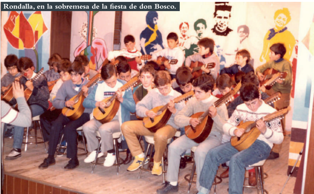
Rondalla, en la sobremesa de la fiesta de don Bosco.

Aunque se comenzó a edificar como seminario, su primer cometido fue casa de formación para los jóvenes salesianos estudiantes de Filosofía. Esta etapa fue muy corta, pues en 1972 los filósofos se trasladaron