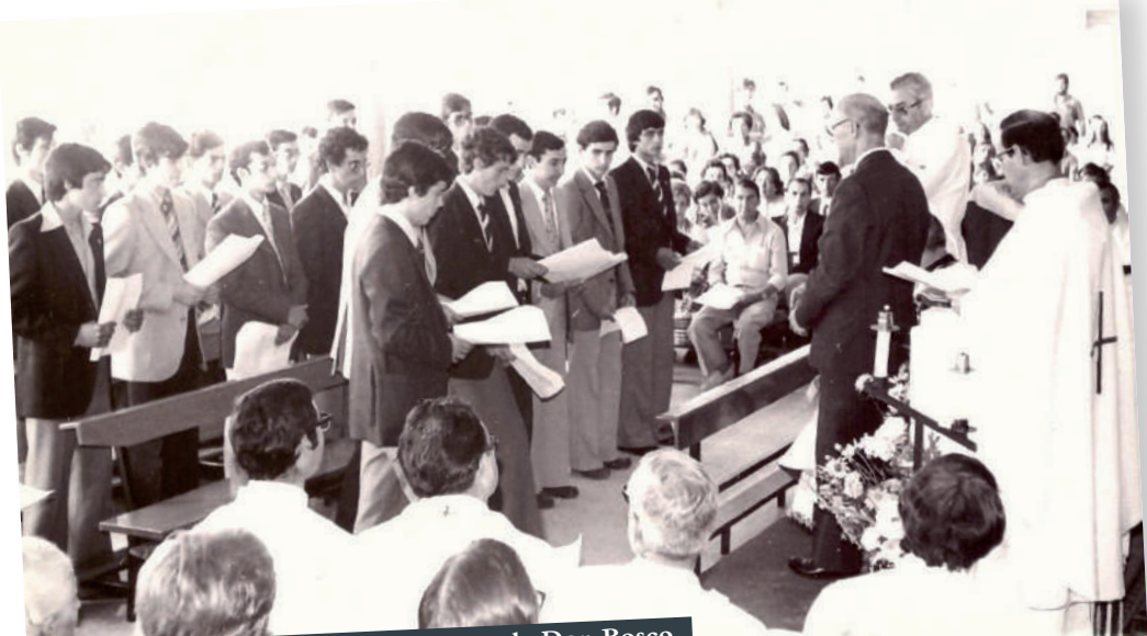
Profesión de novicios, como Salesianos de Don Bosco.