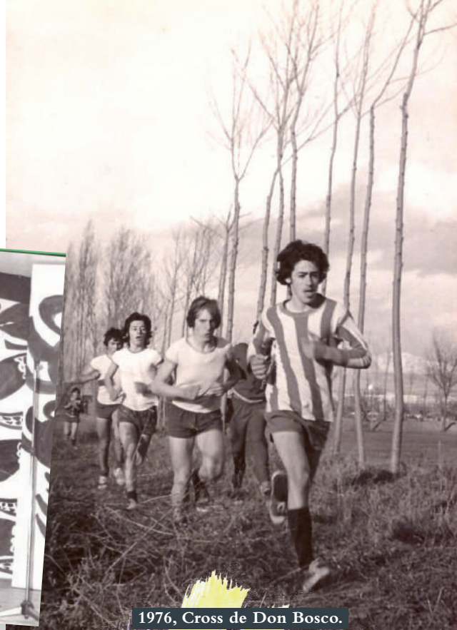
1976, Cross de Don Bosco.

a Urnieta (Guipúzcoa) dejando su huella salesiana entre los pequeños seminaristas y los no seminaristas, en la celebración de las fiestas salesianas, sobremesas y veladas que amenizaba la propia rondalla, festivales, teatro, zarzuelas y el deporte –especialmente el balonmano–, la olimpiada de María Auxiliadora... A día de hoy, todavía se sigue celebrando entre los alumnos el Festival del Ebro, de carácter musical, y el Cross Don Bosco, reforzado ahora gracias al trabajo del Club Deportivo Salesianos Domingo Savio.