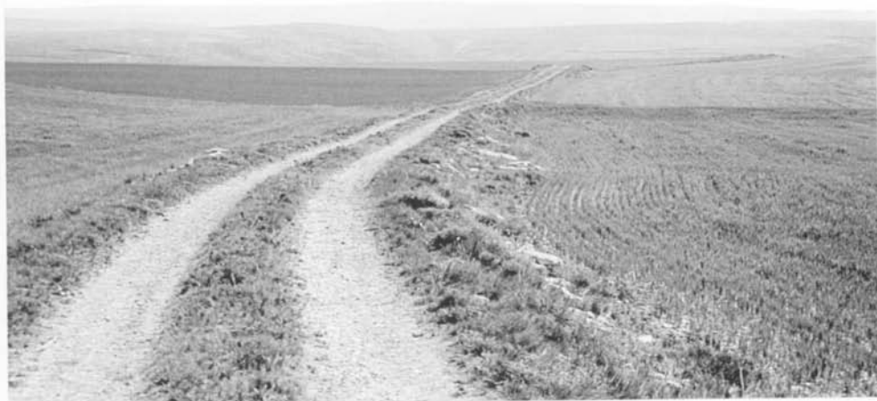
Prolongados terraplenes de la vía de Italia a Hispania en Cerezo de Riotirón (Burgos)

Sus características geométricas y de rodabilidad son excelentes, en contraposición con el Camino de Santiago equivalente entre Nájera y Belorado de muy malas condiciones geométricas, al discurrir por un terreno muy accidentado que sólo con el transcurso de los siglos y con mucho esfuerzo pudo convertirse en carretera.