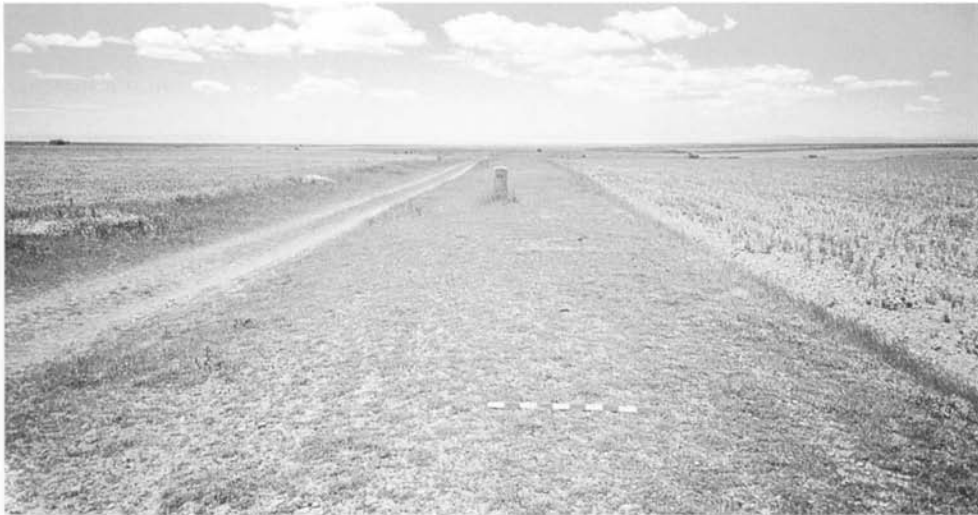
La Calzada de los Peregrinos, intacta entre Calzadilla de los Hermanillos y Reliegos (León), con el hito del Camino de Santiago en el medio del terraplén.

Probablemente sean, en lo que yo conozco, los restos de vía romana mejor conservados en España.