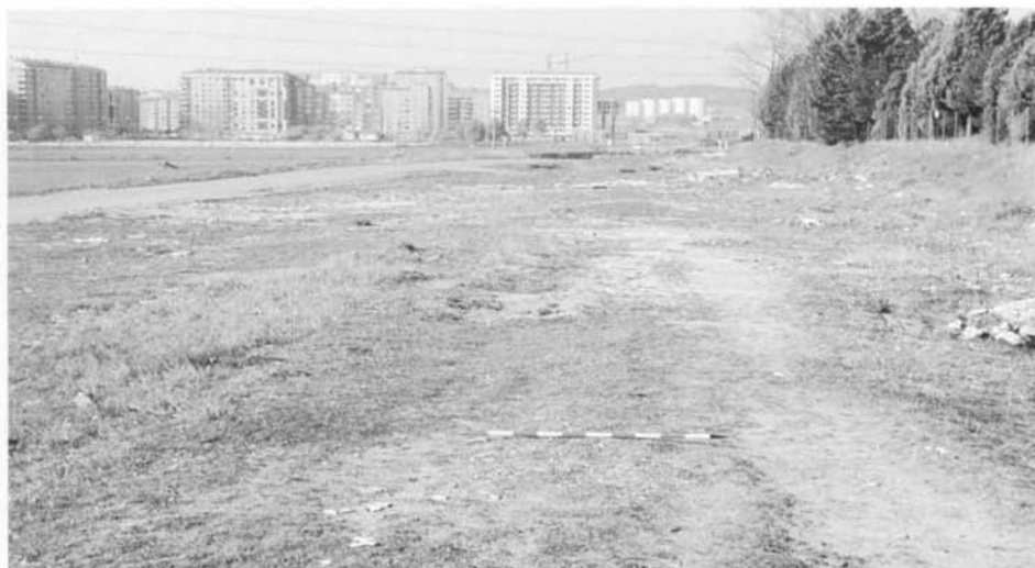
La vía romana entrando en Burgos capital cuyas casas se ven al fondo.

medieval, la vía romana entre Burgos y Melgar pierde su función de vía de tránsito principal.