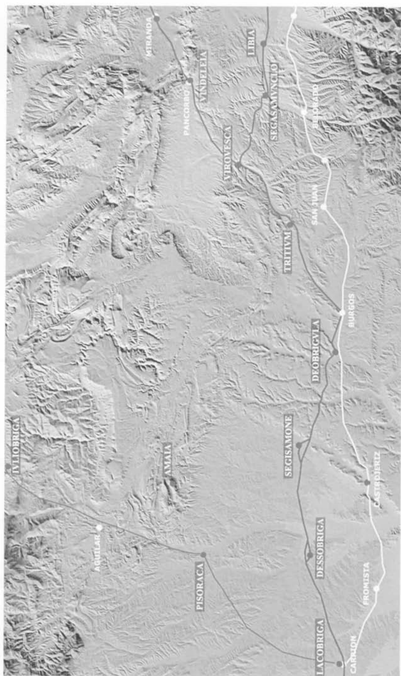
La Vía Romana de Italia a Hispania y el Camino de Santiago en Castilla y León, tramo 1