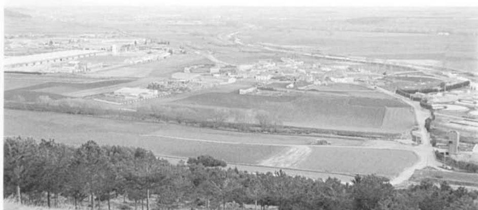
Vista general de la vía romana atravesando Villalonquéjar (Burgos) y el río Ubierna en primer plano

Mencionaré aquí también la existencia en el antiguo barrio de la Judería burgalesa, junto a la muralla, del templo de N ra S ra de la Vieja Rúa cuyo solar refleja Coello en el plano de la ciudad de Burgos de 1868 y que seguramente rememoraba su emplazamiento junto a la vía romana.