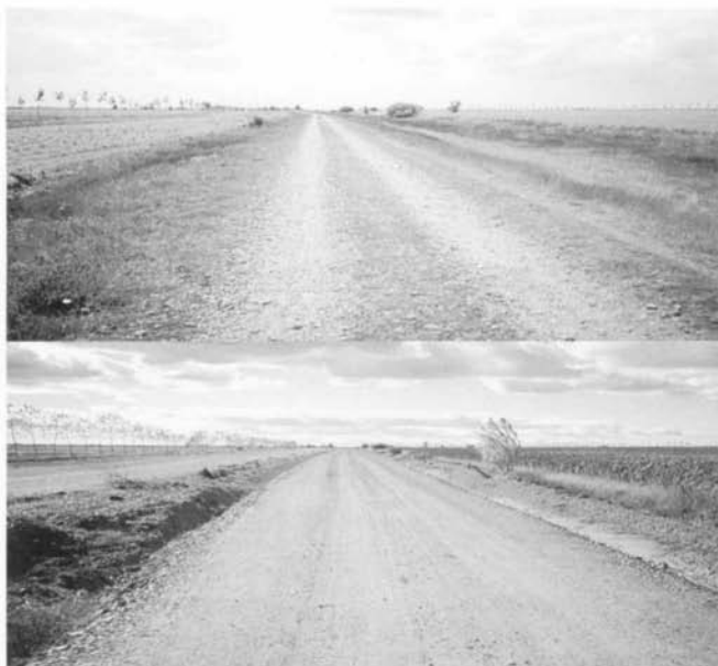
La Calzada de los Peregrinos entre Carrión y Calzadilla de la Cueva, antes y después de su transformación en camino de concentración en 1998.

namiento integral del Camino de Santiago en la región Castellano-Leonesa, desperdiciando con ello y tal vez definitivamente la posibilidad de recuperar la vía romana de la Calzada de los Peregrinos para su uso lúdico.