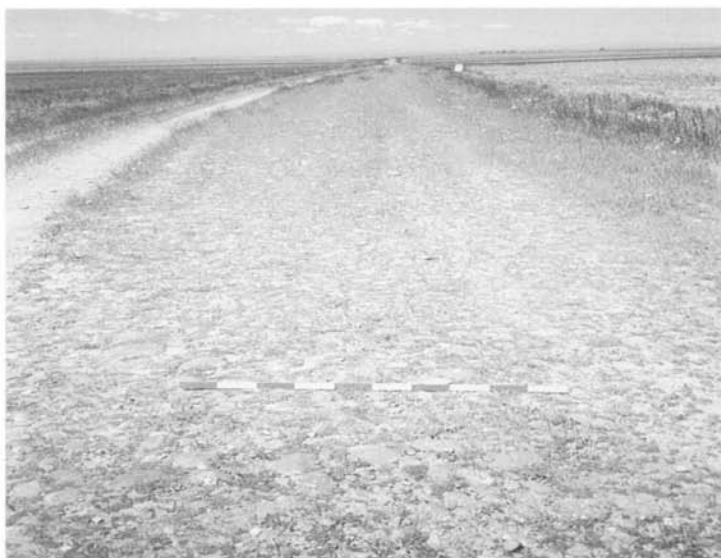
Aspecto de la capa de rodadura de la Calzada de los Peregrinos en León

Sin embargo hoy ya sabemos que el río Porma era cruzado por aquí, por Marne, por la vía romana y que tras este cruce, hoy sin puente y con el curso del río bastante desviado, se bifurcaba para dirigirse a León por la Vía de Italia (nº 1) y a Astorga por la vía de Asturica a Tarracone (nº 32).