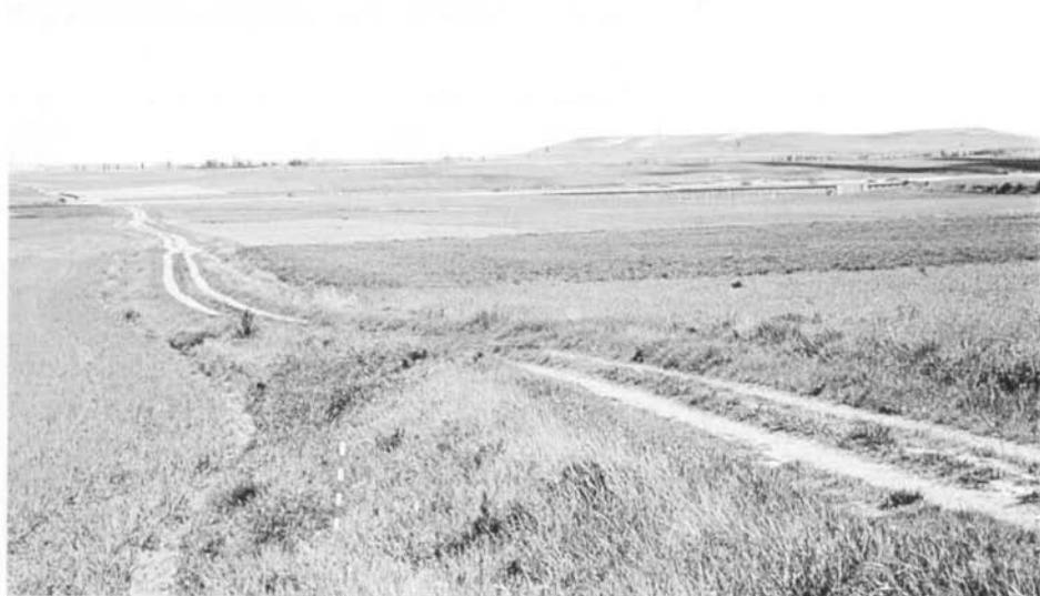
Terraplén de la Carrera Francesa, en el lugar de La Carrancha, en la mojonera Villadiezma (Palencia)

Existe un yacimiento muy interesante a este respecto que es el de los restos del Santuario medieval de San Cristóbal 27 , advocación característica de la peregrinación a Santiago, en término de Carrión de los Condes a quinientos metros al sur de la vía romana y a mitad de camino entre Arconada y Carrión.