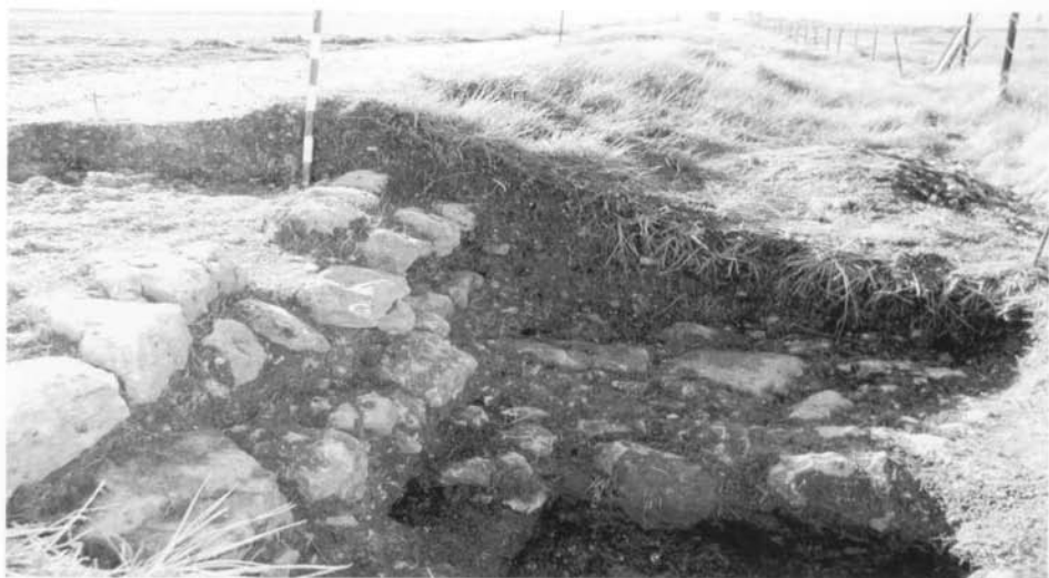
Cata arqueológica que descubre la impresionante cimentación del firme de la vía romana, en el lugar de las Mijaradas-Hurones (Burgos)

Sin embargo, entre Belorado y Burgos, el Camino de Santiago, al igual que ocurría en su tramo anterior, discurre por terreno accidentado poco apto