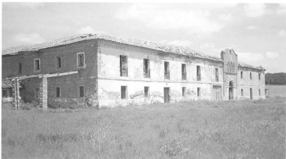
Ruinas del hospital de peregrinos de Santa María de las Tiendas, antigua abadía del Gran Cavalier .

conocieron la obra de Cipriano dieron por bueno el paso de la vía por el puente medieval que acompaña a la ermita 40 .