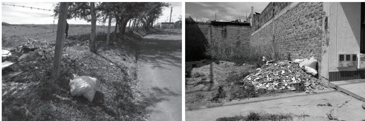
Figura 2. A, disposición de escombros en la avenida Pedro Tafur (Ibagué); B, disposición de escombros en el barrio Santa Rita (Ibagué, Colombia).

En cuanto a los sistemas de gestión que se pueden implementar en Ibagué están: el reciclaje, la reutilización y la disposición final en escombreras, con el fin mitigar y darle un valor agregado a los residuos. De acuerdo a la encuesta realizada, el 67% de las constructoras están implementando la disposición final de los residuos generados en escombreras legales; es decir, con permiso de las entidades medioambientales para hacer la recepción de los RCD. El 33% está acogiéndose a la clasificación y selección de estos residuos en obra con el objetivo de aprovechar al máximo sus residuos en el mismo proyecto. No obstante, se tienen evidencias fotográficas de que algunos residuos no están llegando a su destino final en la escombrera, sino que son depositados en otros lugares dando lugar a la alteración del paisaje y al aumento de la problemática ambiental. Esto tal vez sea causado por constructoras que no están legalmente constituidas y que al realizar pequeñas reformas, originan y disponen dichos residuos en sitios indebidos, con el fin de evitar los costes de disposición final (Figura 2).